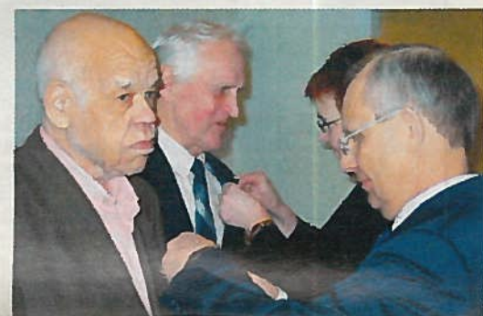
SOTAINVALIDEILLE MITALEJA LIEKSASSA