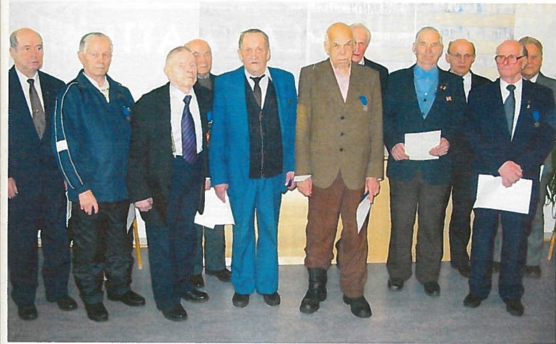
Kuvassa Suomen Valkoisen Ruusun ritarikunnan I luokan mitalin ja ansiomerkkien saneita lieksalaisia sotainvalideja.