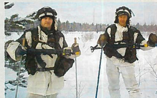
OPERAATIO UMPIHANKI NURMEKSESSÄ