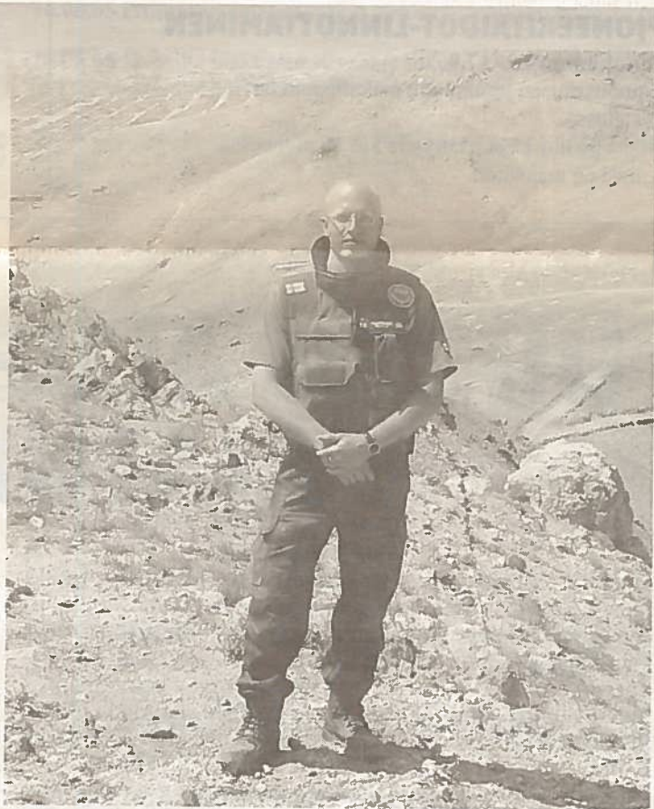
Partiossa Kabuln laitamilla maaliskuussa 2004.

Ilmoittautumiset ja lisätietoja: aluetuomari.joensuu@mil.fi, 013-181 3054. Reserviläissarjan ja retkisarjan osallistumismaksu on 20 euroa henkilöä sisältäen ruuan, vakuutuksen, ohjelman ja saunan. Kanootin voi tuoda itse tai vuokrata etukäteen järjestäjiltä kahdeksalla eurolla. Lisätietoja voi kysellä myös ratamestarilta: tomi.kervinen@traktori.net.