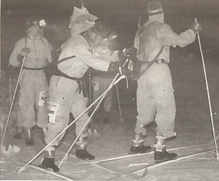
Pohjois-Karjalan Reserviläispiirin voittoisa joukkue ensimmäisessä vaihdossa Tikkanen seurojentalolla.

teissa, mutta löytyi seuraavana päivänä lähiseudun talosta. Yksinhiihdosta luovuttiin ja pari seuraavaa vuotta jätettiin väliin. Vuoden 1939 viesti hiihettiin Kuopiosta Mikkeliiin mutta sotavuodet katkaisivat perinteen väliaikaisesti. Oltermannia alettiin hiihtää taas vuonna 1951 ja perinne on jatkunut katkeamattomana.