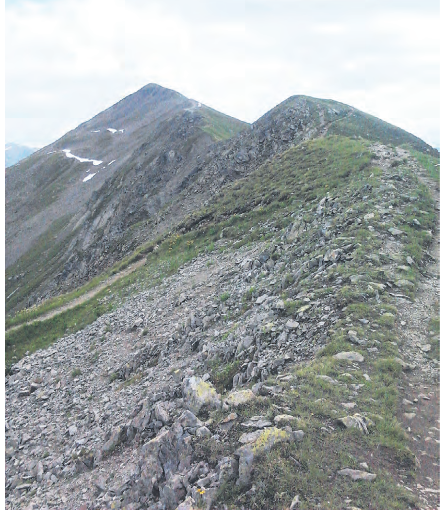
Vuorijuoksussa kilpailujen kokonaisnoususumma nousee yleensä useampaan tuhanteen metriin.

S ykemittarini näyttää ajaksi 4 tuntia 40 minuuttia ohittaessani kyltin, jossa lukee ”1km to the finish!”. Kapean kadun ja sen reunalla nököttävien rakennusten välistä korviini kantautuva musiikki voimistuu nopeaan tahtiin ja päätän ottaa loppukirin. Hetken päästä huomaan jo olevani Davosin urheilukentän laidalla, jossa katsomot ovat täynnä kannustavia ja alppikelloja hervottomasti heiluttavia ihmisiä. Spurttaan villisti urheilukentän portista sisään ja kaarran maalisuoralle. Maalilinjaa ylittäessäni kuuluttaja toivottaa minut tervetulleeksi Davosiin ja kertoo kaikille minun tulevan Suomesta – huikeaa! Loppuajakseni kirjataan 4:46:40 ja sillä sijoitun lopputuloksissa sijalle 34 (maaliin tulleet kaikkiaan 758). Sijoitusta tärkeämpää on kuitenkin se tunne, minkä vuorille kiipeäminen ja niiden ylittäminen minulle antaa. Vuorija polkujuoksun avulla voin kilvoitella ja tavoitella jotain sellaista, mitä ei voi rahassa mitata. Vuorien taa, sinne minä haluan aina vain ja uudestaan!