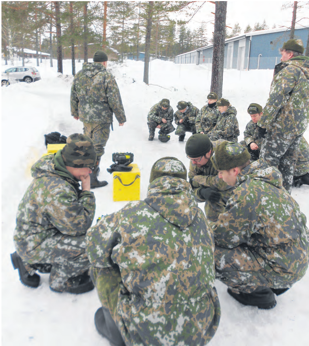
Pioneerikurssi pidettiin maaliskuussa.