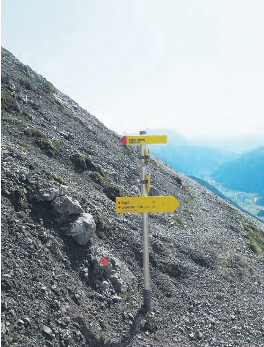
Vuori- ja vuoristajuoksuissa kilpailumaastoina ovat vuoristot, vaellusreitit, polut ja tiet.

Käveleekö kenkäs vaikka jalat jarruttaa, kohti kylmää kylää jossa vapaus vallan saa. Aavehuudot korviin kaikuu, pyytää seuraamaan, uskallatko nousta kohti vuorta kulkemaan?