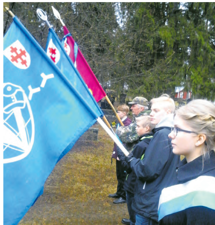
Liperin yläkoululaiset ja reserviläiset muodostivat sankarihaudoille lippulinnan.