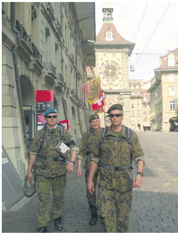
Pohjois-Karjalan pojat historiallisen Bernin keskustassa.

Historiallisen Bernin kaupungin jälkeen alkoi olla mielessä jo kotimatkan junailut. Niinpä nostimme marssivauhtia ja etenimme miltei tauoitta maaliin. Maalissa vastaanotimme marssimitalit, kunniakirjat ja otimme muutaman yhteiskuvan. Pikaisesti bunkkerille, jossa nopea huolto, pakkaaminen ja siirtyminen reittiä Belp-Bern-Zürich lentokentälle ja edelleen Helsingin kautta Joensuuhun. Sateinen kotikaupunki otti meidät vastaan aamuyöstä. Lyhyiden yöunien jälkeen alkoikin arki ja Sveitsin marssi oli enää vain upea muisto muiden kansainvälisten marssikokemusten ketjussa.