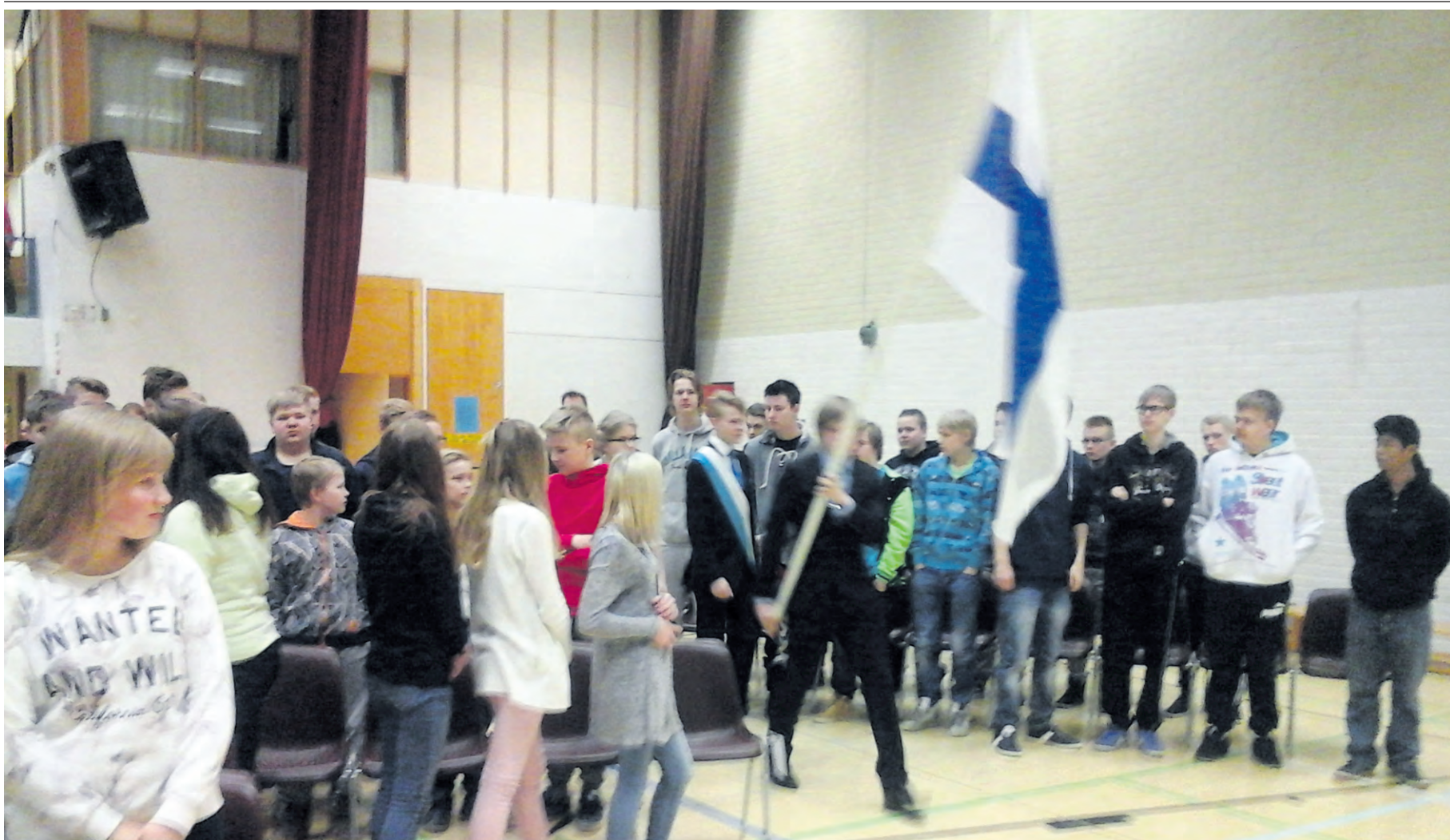
Suomen lippu saapuu juhlaan uljaasti liehuen.