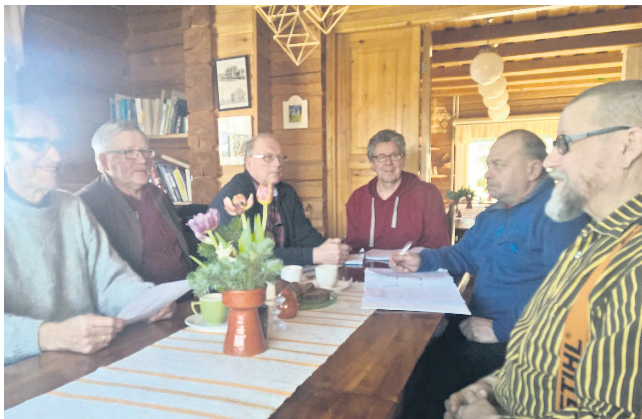
Valtimon Reservinupseerit ja Reserviläiset toimivat tulevaisuudessa entistä enemmän yhdessä.