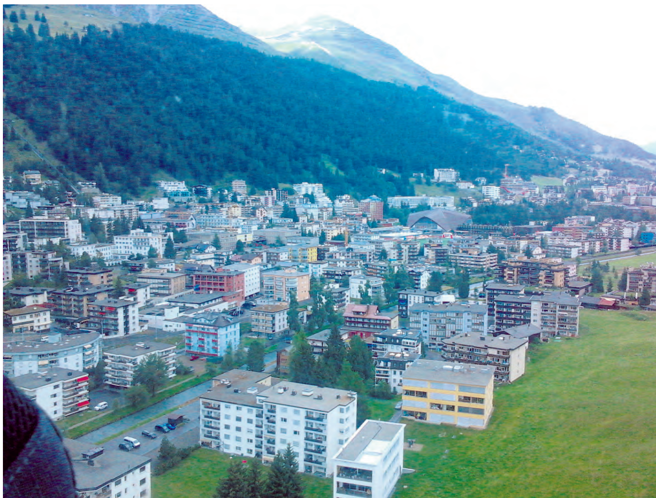
Davos sijaitsee Alppien juurella.

O n heinäkuinen keskiviikkoamu, kello on 5.57 ja istun levottomana Helsinki-Vantaan lentokentän 1. terminaalissa hieman kovalla nahkasohvalla. Aurinko on noussut juuri taivaanrannasta ja katselen toiveikkaana ulos ikkunasta, perhoslauman pyöriessä vatsan pohjassa kihelmöivästi. Takamukseni ei meinaa pysyä penkissä, haluaisin vaan juosta – juosta loputtomasti. Lopulta kaiuttimista heleä naisääni kuuluttaa ”Hyvät matkustajat, Lufthansan lento LH 855 Helsingistä Frankfurtiin on nyt valmiina. Pyydämme ystävällisesti teitä siirtymään lähtöportille 21.”