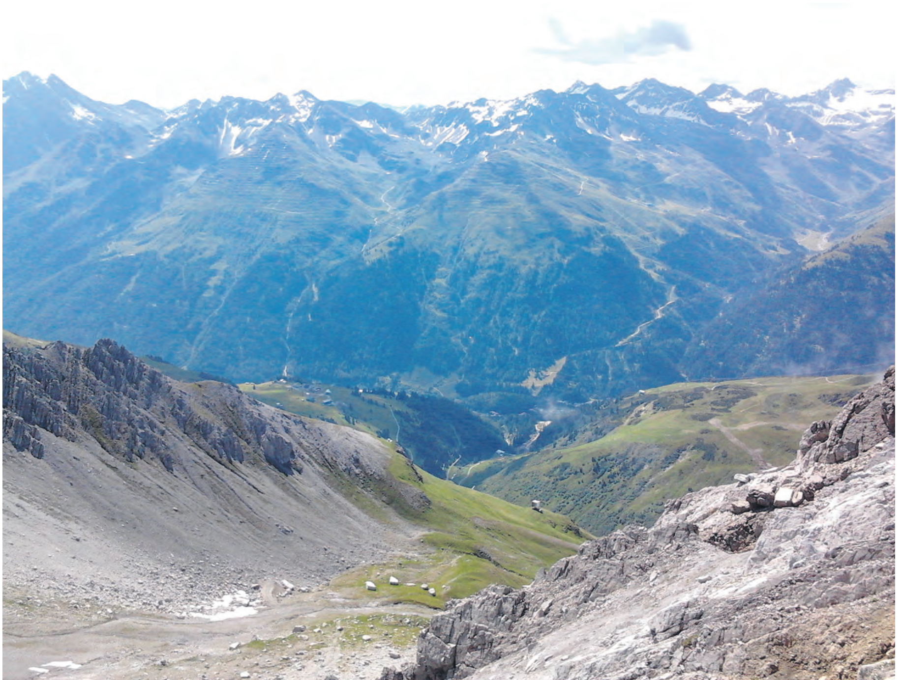
Vuorien taa, sinne minä haluan aina vain ja uudestaan!