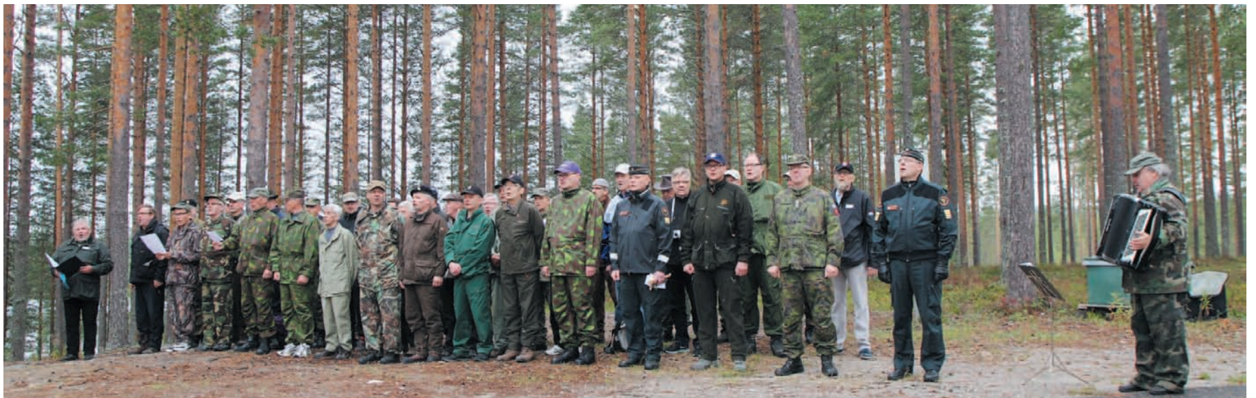
Jotostelijat kokoontuneena lipunnostoon.