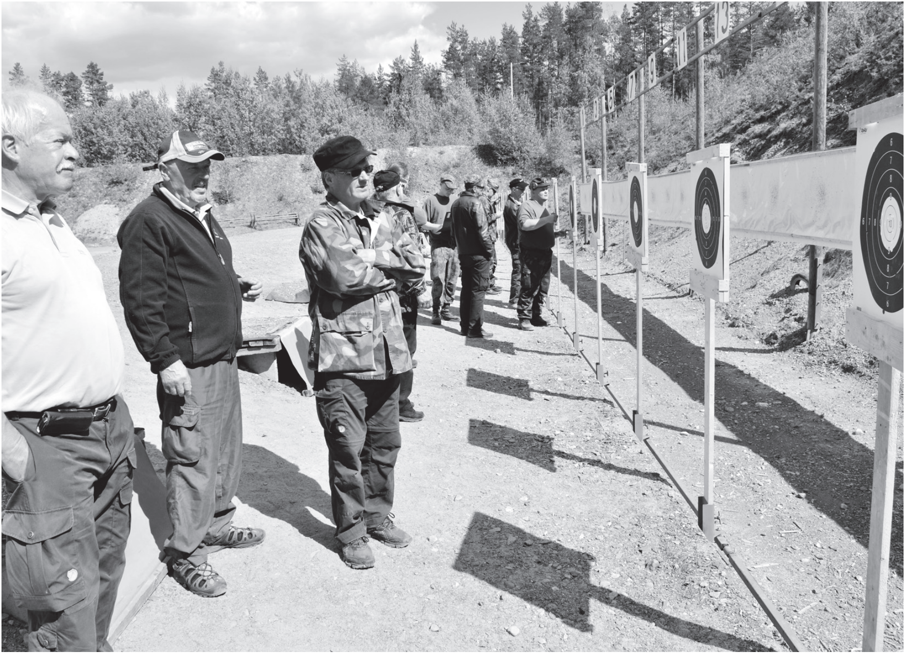
Ampumaratojen kohtalo on askarruttanut alan harrastajien mieliä maakunnassa. Tässä kuvassa Iiomantsin miehet tarkastelevat vielä tauluja Kontiorannan ampumaradalla.