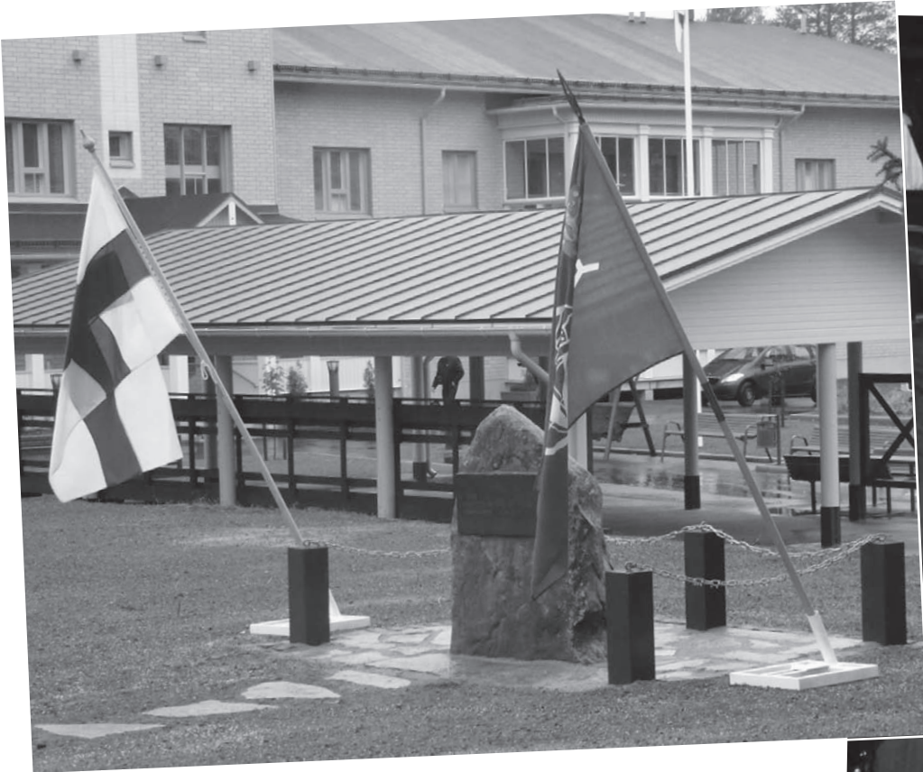
Valtimon kunnostettu muistomerkki. Takana uusi palvelutalo.