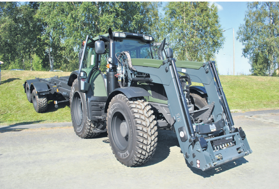
Materiaalikuljetuksiin on otettu käyttöön traktoreita, joista löytyy etukuormaa- ja suurempien tavaroiden siirtämiseen konteista kohteille ja joukoille.

Toiminta ja toiminnot täytyy synkronoida, että vastustajaan päästään vaikuttamaan halutulla tavalla. Lennokit, sensorit ja pimeätoimintavälineet tuovat lisää tietoa päätöksentekoon. Uudet johtamisvälineet mahdollistavat taisteluiden johtamisen