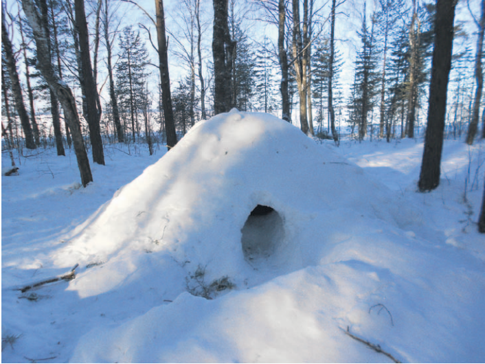
Sotilaallisia valmiuksia palvelevaa koulutusta.