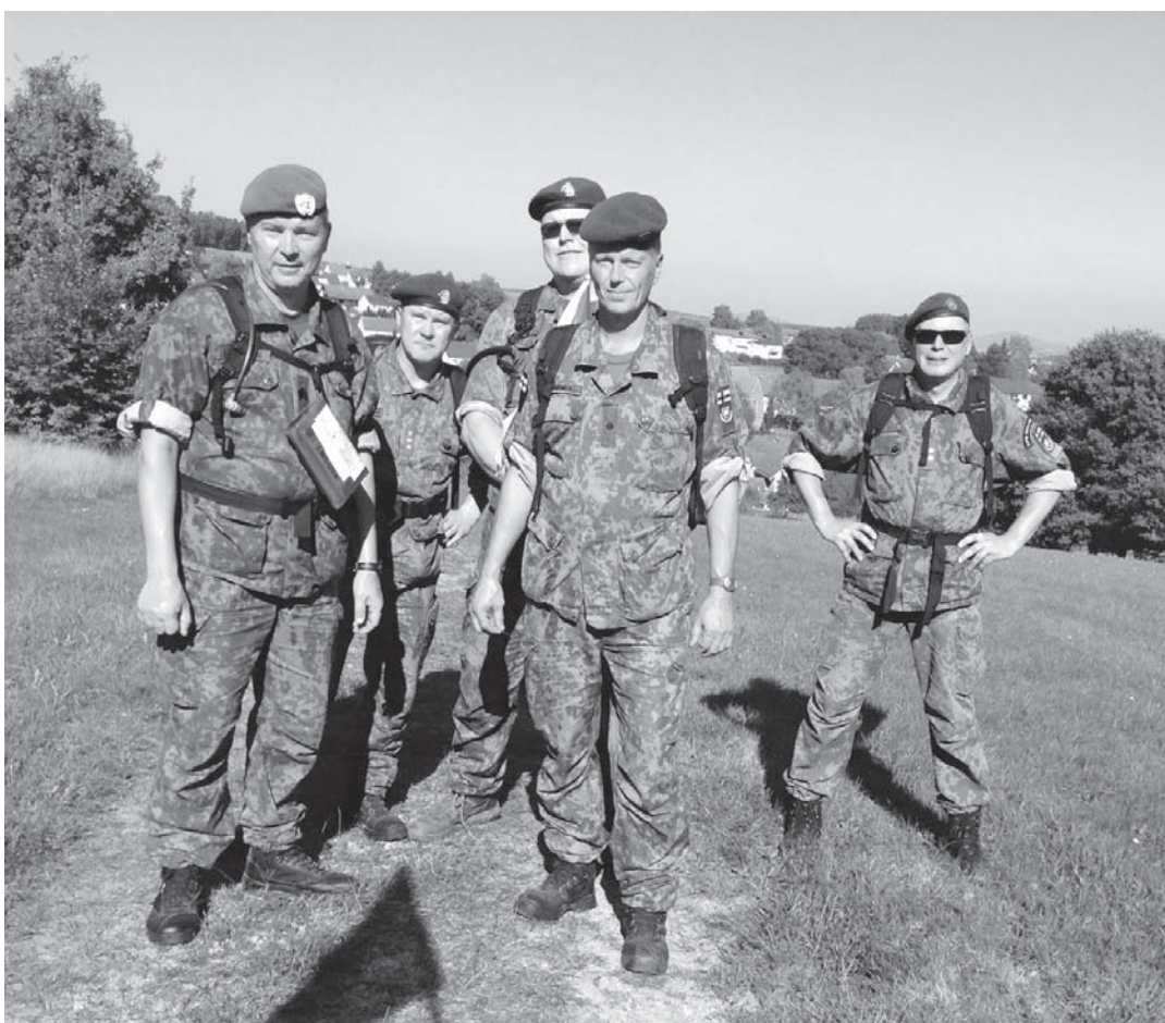
Aurinko heli marssijoita ensimmäisen päivän ajan.

Tekstit: Harri Norismaa ja Jyrki Huusko, Joensuun Reserviupseerit