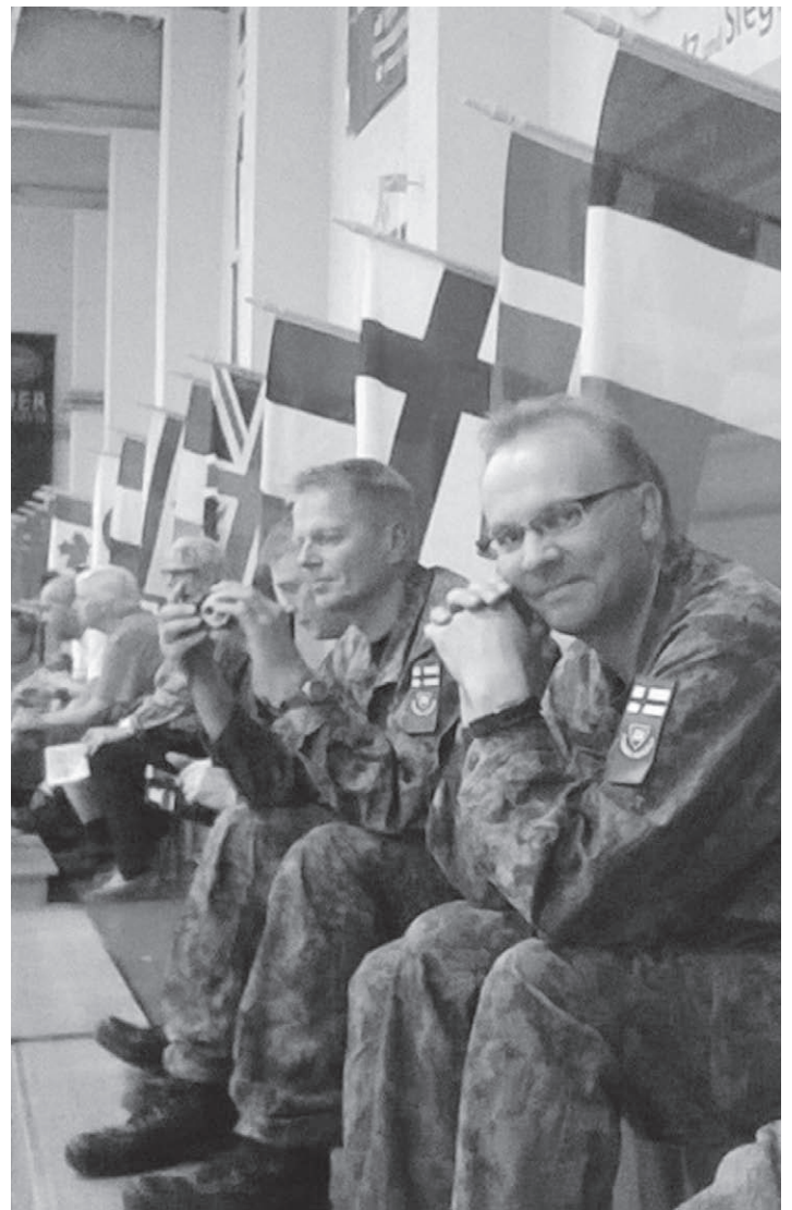
Tapahtuman avajaisissa.

Fulda-marssin marssittuamme suoritimme huollon ja otimme joukkuekuvia muistoksi saksanmaalta. Lopulta jätimme hyvästit Fuldalle ja junailimme itsemme ensin Frankfurtiin, josta siirryimme lentäen Helsinkiin. Pitkän matkapäivän päätteeksi Pertti autoili meidät aamuksi varmoin ottein Joensuuhun. Samoilla silmillä vedetyn maanantaisen työpäivän jälkeen keskustelimme, että viitsiäkseen tehdä tällaista, täytyy meidän todella tykätä tästä reserviläis-touhusta.