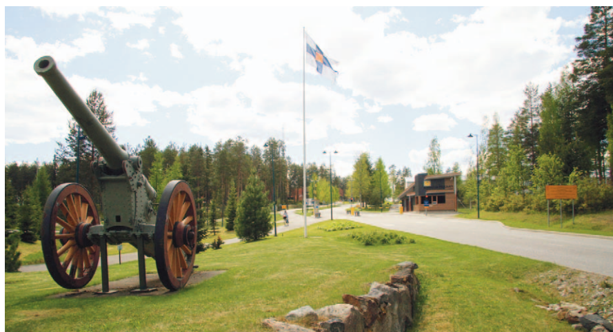
Kainuun prikaatin portti.