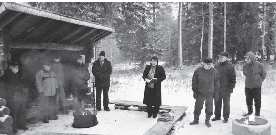
Viime vuonna hiljennettiin reserviläisten joulutulille Iiomantsissa marraskuun viimeisenä päivänä.