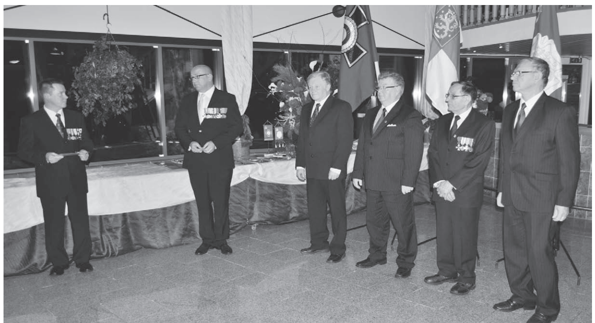
Itsenäisyyspäivän tienoilla järjestettävässä Marskin Malja -tilaisuudessa huomioidaan ylennettyjä sekä ansioituneita reserviläisiä.