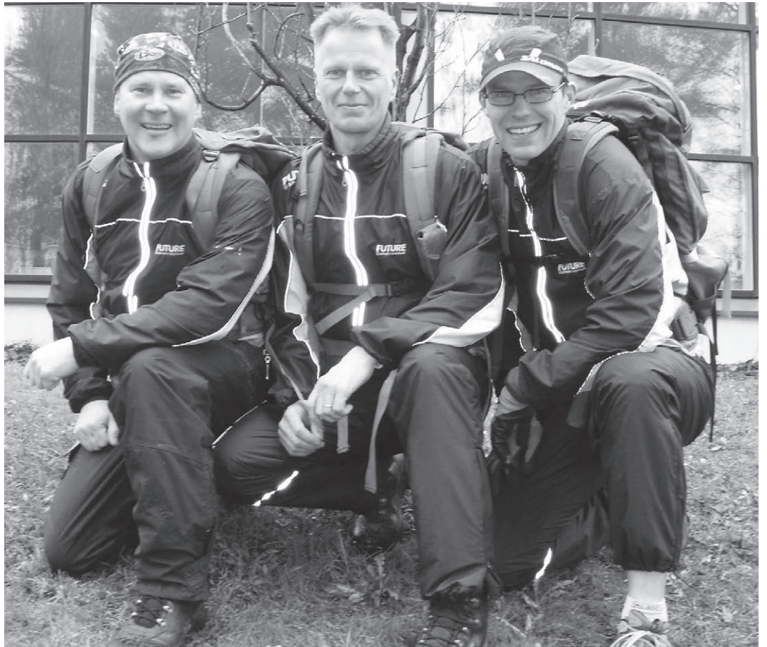
Me olemme Pohjois-Karjalasta, Suomesta.

Sen jälkeen joukkue on osallistunut kuusi kertaa maailman suurimpaan marssitapahtumaan Nijmegenin marssille Hollannissa ja viimeisimpänä Fulda-marsille Saksassa. Minä olen ollut puuhastelemassa kaikkia Team MPK:n retkiä. Yhdelle keikalle en saanut houkutelua ketään mukaan täältä meiltä päin, mutta en antanut sen omaa menoani häiritä, sillä samanhenkisii löy-