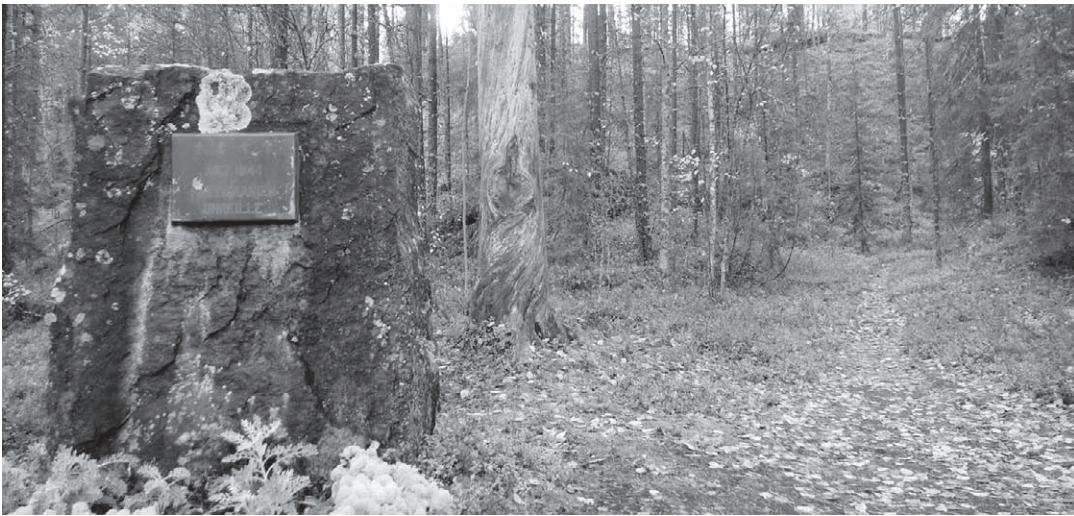
Neuvostopartisaanit tekivät kesän ja syksyn aikana vuonna 1944 lukuisia iskuja siviileitäkin vastaan Pielisjärvellä. Kontiolahden reserviläiset vierailivat kauhun paikoilla melko tarkalleen 70 vuotta myöhemmin.