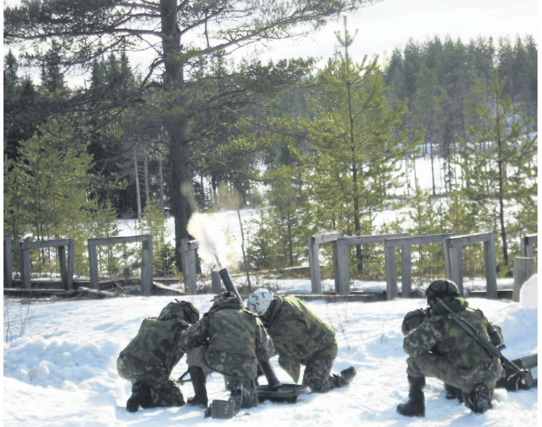
Sotilaallista koulutusta.