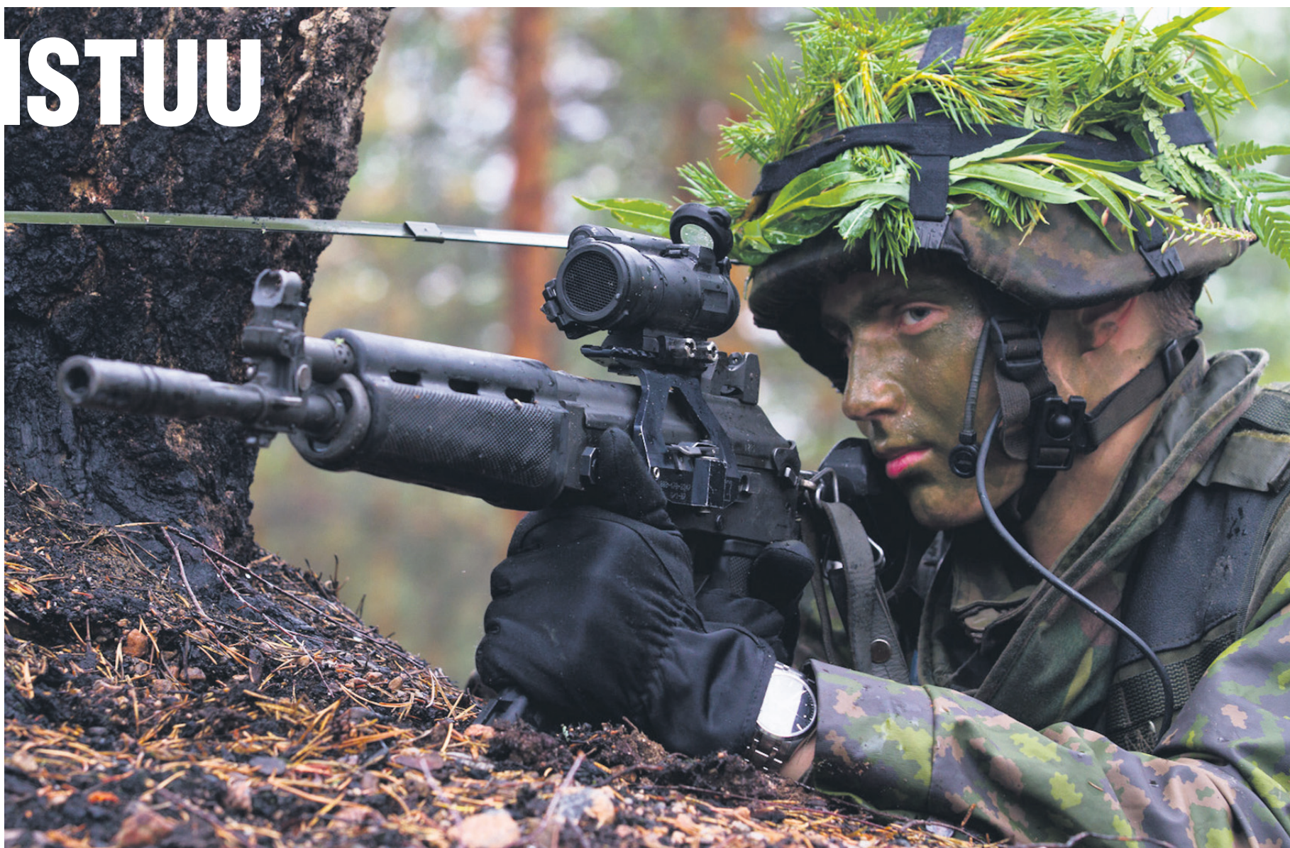
Taistelija valmiina.

laajalla alueella ja kokonaistulenkäytön johtamisen. Epäsuora tuli, suorammuntatuli panssarintorjunta-aseet ja räjähdyspanokset saadaan keskitettyä tuhoamisalueille ja näin pystytään vaikuttamaan vastustajaan halutulla tavalla. Johtamis- ja paikantamisvälineiden johdosta vastustajaan pystytään vaikuttamaan hajautetusta ryhmyksestä, eivätkä omat joukot ja aseet joudu tästä johtuen niin suuren asevaikutuksen kohteeksi.