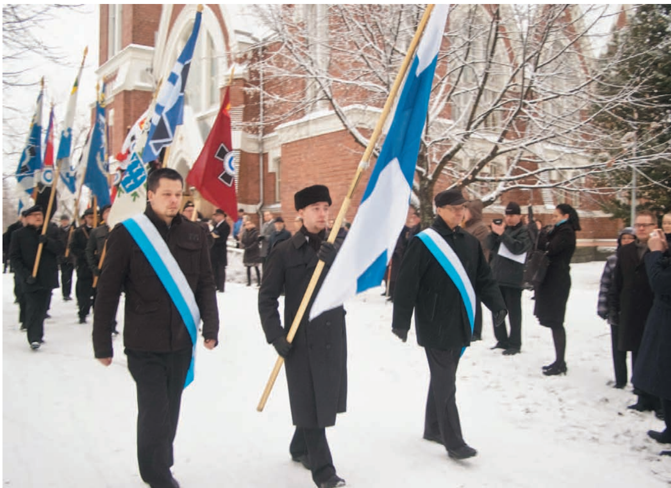
Joensuun kirkossa järjestetyn jumalanpalveluksen jälkeen lippulinna suuntasi kohti yliopiston Carelia -salia.