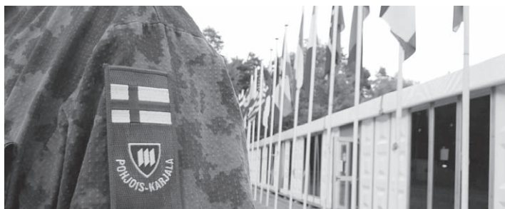
Tästä se kaikki alkoi.