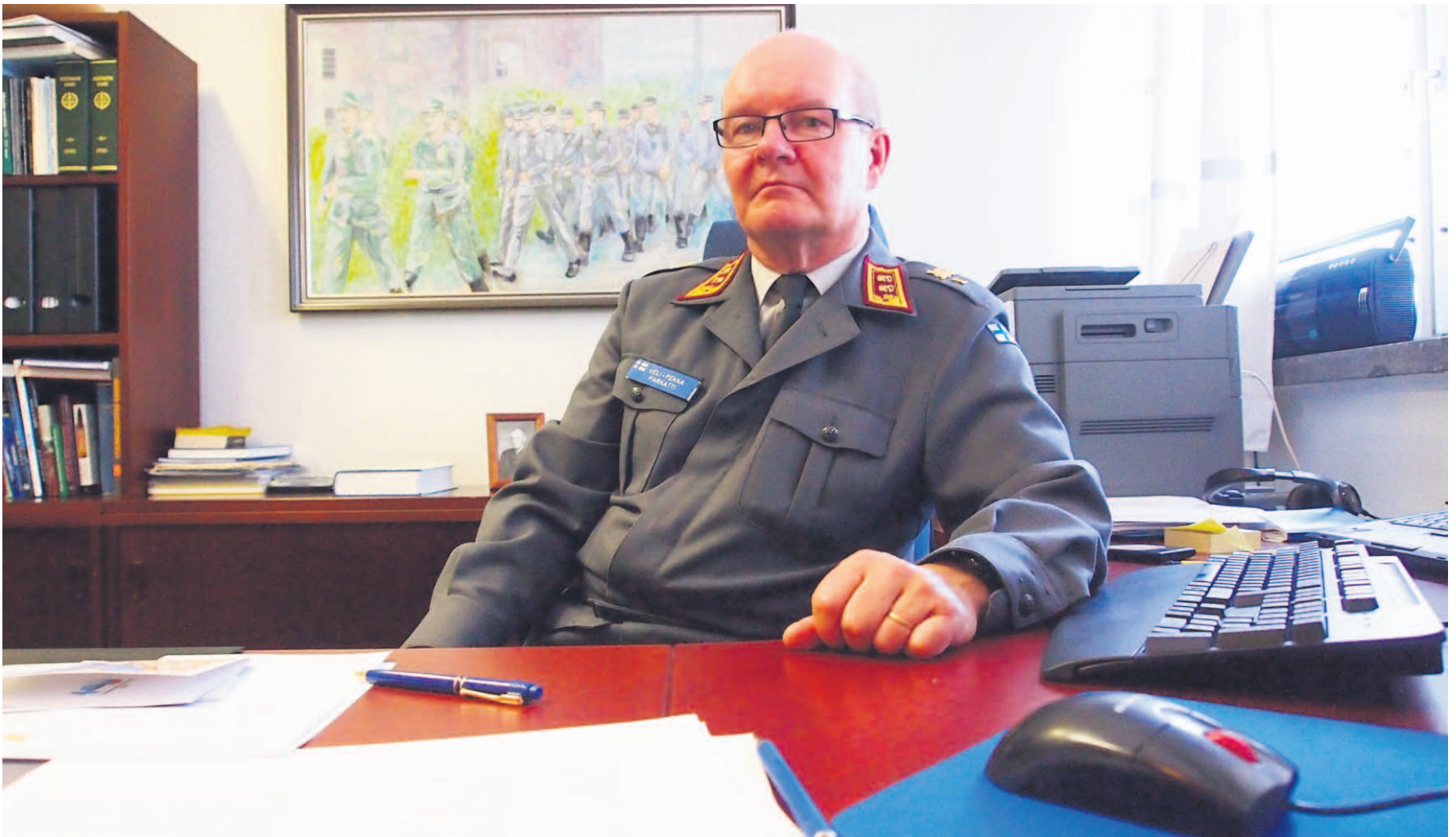
Kenraalimajuri Veli-Pekka Parkatti.