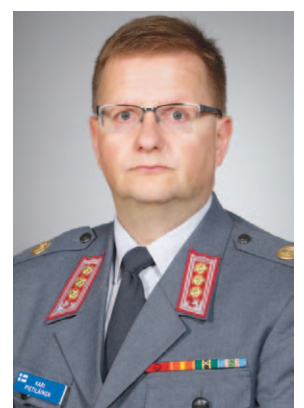
Esikuntapäällikkö, eversti Kari Pietiläinen