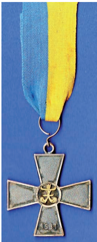
Nauhallista Rakuunaristityyppiä jaettiin vielä 1960-luvun puolivälissä. Rakuunaristi on joukko-osastoristeistä vanhin. Se perustettiin 1925. Joukko-osaston tunnuksena on Ruotsin kuninkaan Fredrik I:n monogrammi.