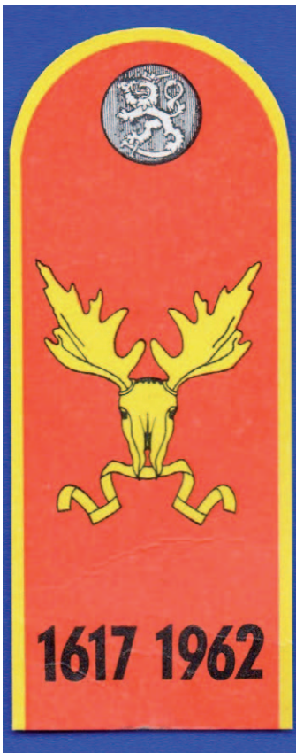
1617 -1962 Ratsumieskilta ry. Jäsenkortin kuvapuoli.