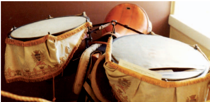
Rummunlyöjän satula Lappeenrannan Ransuiväen museossa.