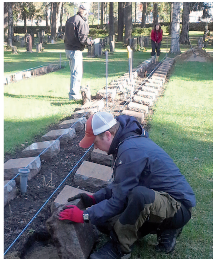
Toukokuun 17. päivänä hautakiviä oikaistiin ja pestiin Liperin ja Viinijärven sankarihautausmailla.