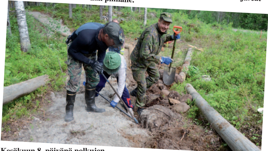
Kesäkuun 8. päivänä polkujen varsilta poistettiin kiviä reunapylväiden tieltä. Ilmasta tulevan vaaran takia olivat hyttysuojat tarpeen.