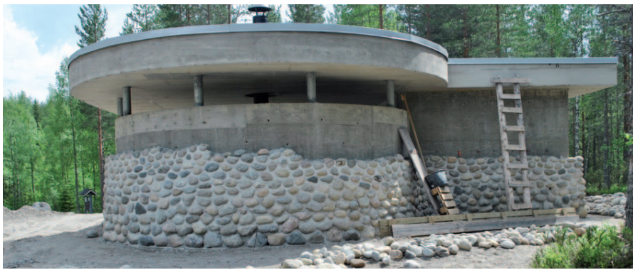
Öykköstenvaaran sotahistoriallisen info- ja yleisötilan ulkoseinä kivien muuraus etenee aikataulussaan.