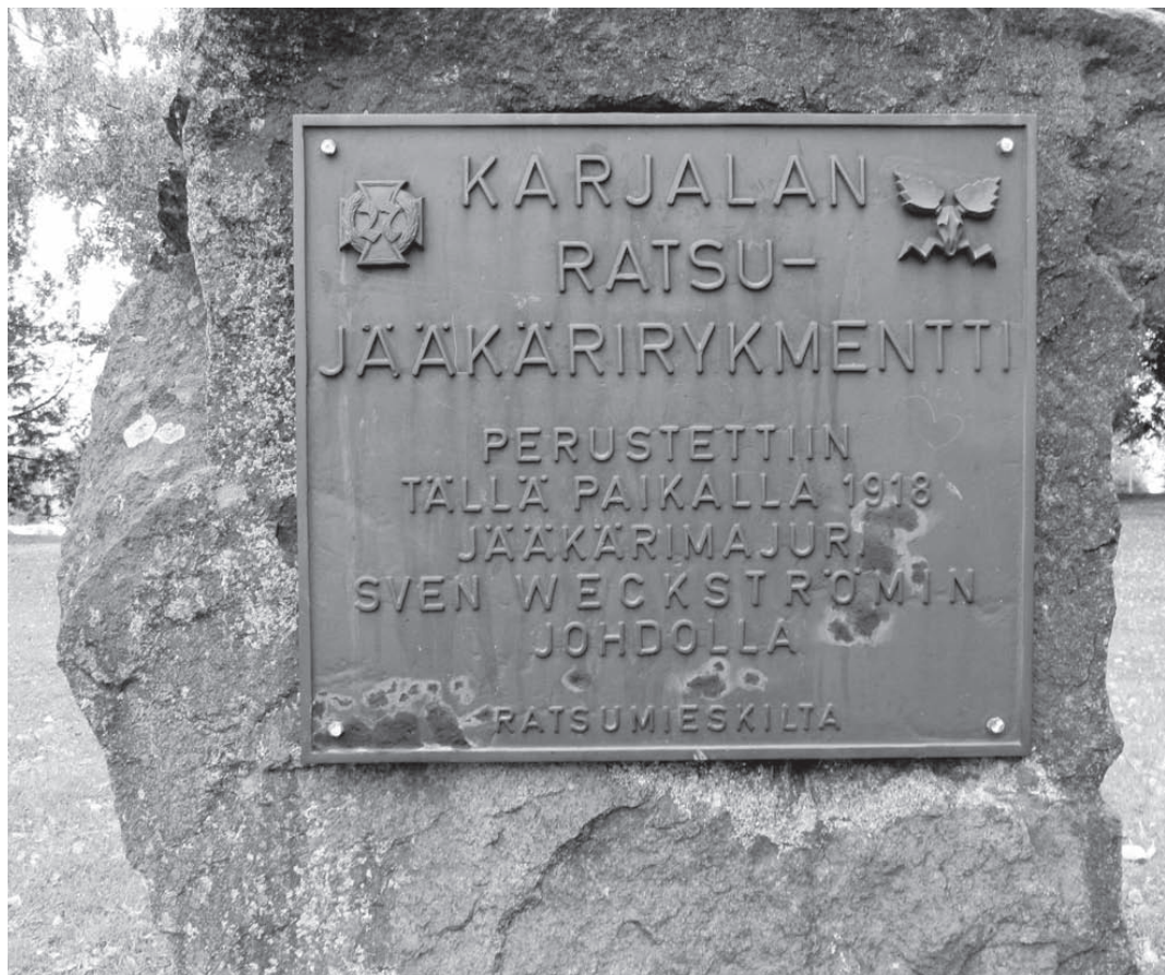
Karjalan Ratsujääkäri Rykmentin perustamisen muistolaatta Joensuussa.