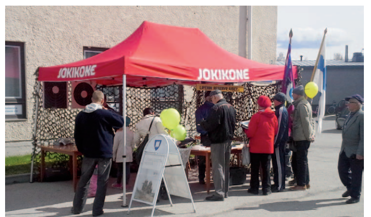
Liperin vapputapahtumassa malliyhdistyksen infopisteelle suorastaan jonotettiin.