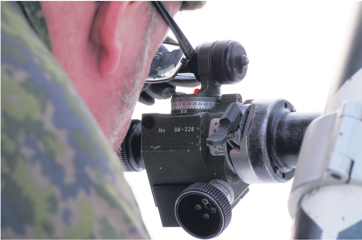
Tavoitteena on koulutustapahtuma, jossa Pv:n henkilökunta valvoo ja MPK kouluttaa. Umpihanki 2014 –harjoituksen KRH- ja TJ-kurssi sujui erinomaisella tavalla.