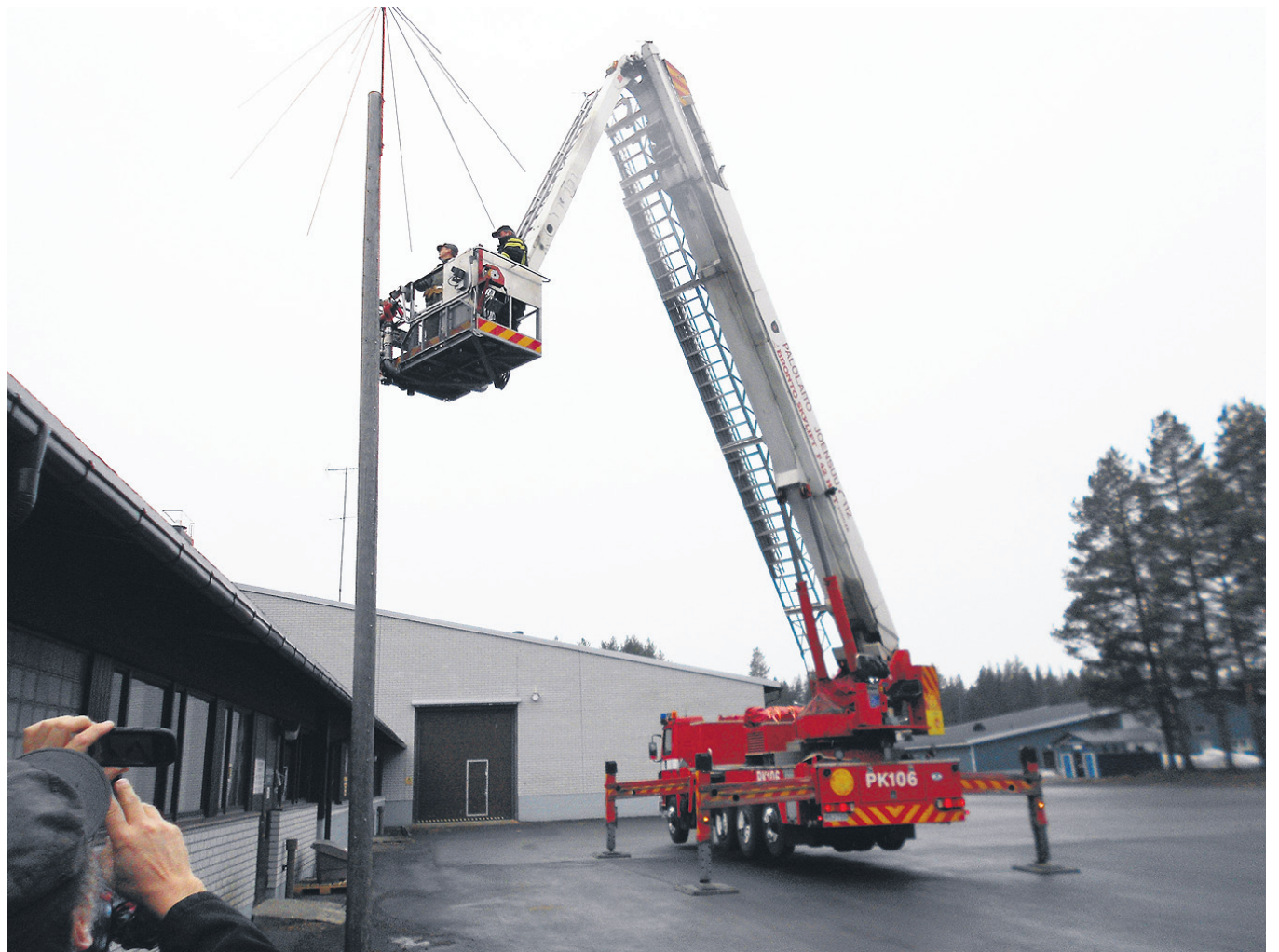
Viestiliikenneharjoituksissa radioamatöörit tekevät työtä yhdessä eri viranomaisten kanssa.

Keväällä toteutuu vielä Reserviläisten ampumapäivä. Tämän lisäksi MPK huolehtii ISSLKOM:n ampumakilpailun toteutuksesta yhdessä Pohjois-Karjalan