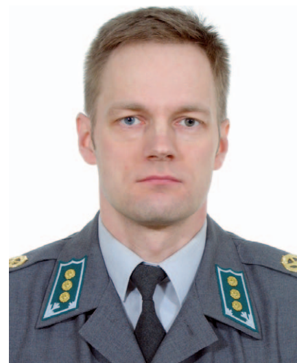
Kirjoittaja on työskennellyt Pohjois-Karjalan prikaatissa liikuntakasvatuspseerina yli 7 vuoden ajan. Nykyinen työpaikka on Pohjois-Karjalan aluetoimistossa osastoupseerina.