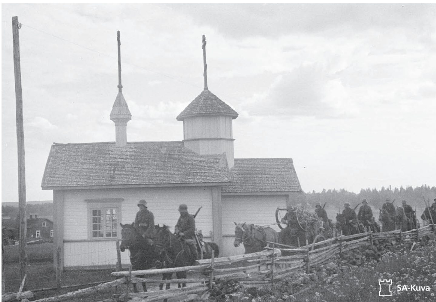
Eskadroona sivuuttaa Hattuvaaran kreikkalaiskatolisen rukoushuoneen.

Ratsuväkiprikaatissa perustettiin pian toimintansa aloittamisen jälkeen Voimistelu – ja urheiluklubi. Toiminta suunniteltiin. Rykmentti määräisivät sen toteuttamiseksi urheiluasioista vastaavat upseerinsa. Päiväkäskyissä mainittiin mm. yleisurheilu, palloilulajit (pesä -, jalka – ja jääpallo), uinti, hiihto, johon kuuluivat murtomaa -, viesti -, tiedustelu – ja ampumahiihto sekä hiihtoratsastus. Orienteeraushiihto alkoi prikaatin ensimmäisellä vuosikymmenellä. Siitä muokattiin 1930-luvulla hiihtosuunnistus ja edelleen partiohiihto. Nykyaikainen 5-ottelu sai jalansijaa erityisesti upseerien keskuudessa 1920-luvulla.