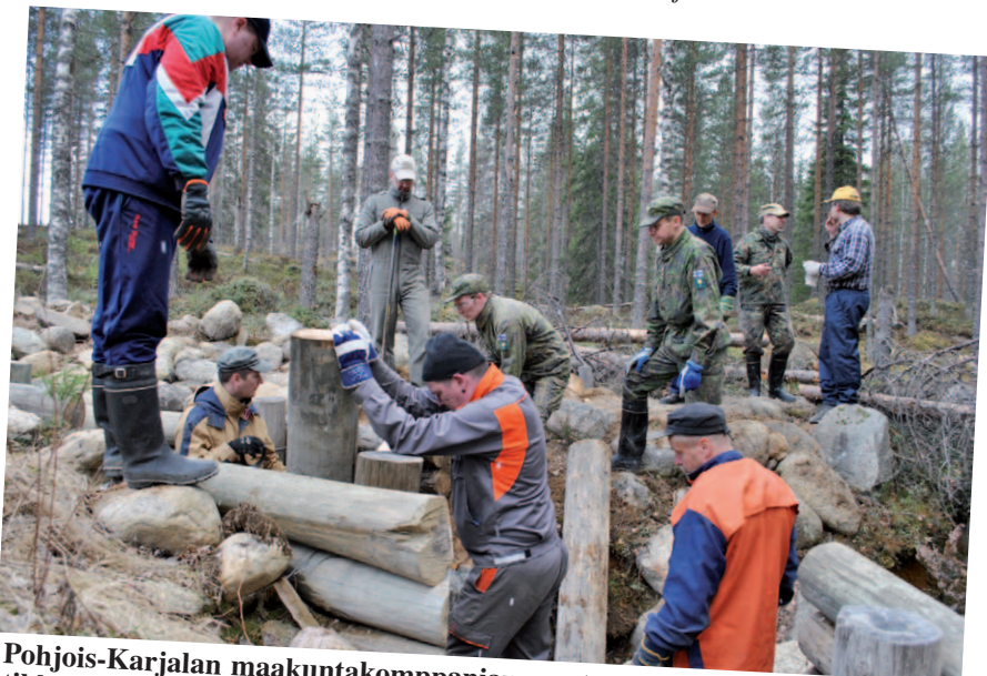
Pohjois-Karjalan maakuntakomppanian osasto rakensi toukokuussa järeät tikkaat juoksuhaudasta maan pinnalle.