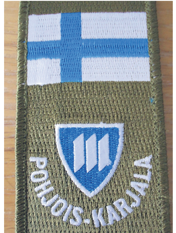
Jokaisella Koulutus- ja Tukiyksiköllä on oma hihamerkkinsä. Tässä Pohjois-Karjalan kotu-yksikön merkki.