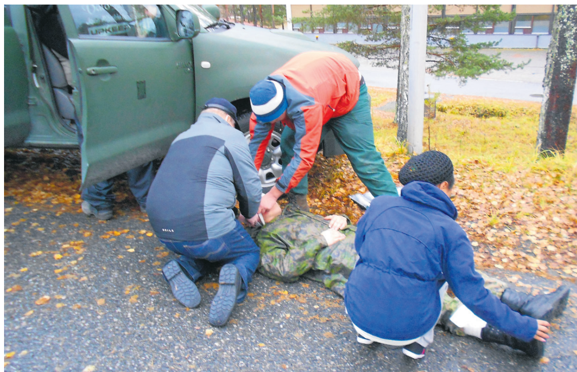
Turvakursseilla harjoitellaan mm. hätäensiapua ja itsesuojelua. Tietoa saadaan mm. maanpuolustuksesta, vapaaehtoisesta maanpuolustuksesta, varautumisesta ja tietoturvasta.