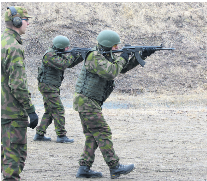
Ampumaohjelmisto on uusiutunut keväällä 2013. Uudistettuja perusamuntonjohtajia ja harjoittelemassa.

Lisäksi on säädetty, että Maanpuolustuskoulutusyhdistys ja sen jäsenjärjestöt