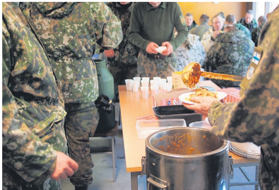
Joukkomuonituskurssi vastaa harjoitusten muonituksesta. Armeija marssii edelleen vatsallaan...