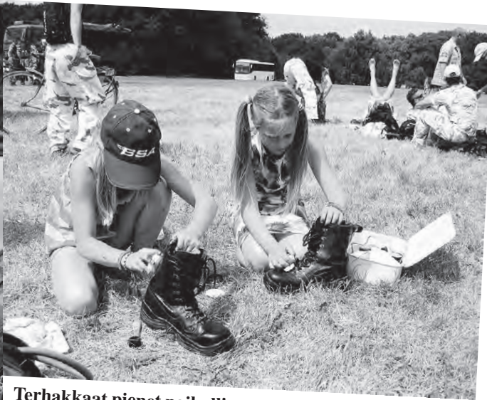
Terhakkaat pienet paikalliset tytöt tienasivat taskurahoja lankaamalla marssijoiden kenkiä maalialueella.