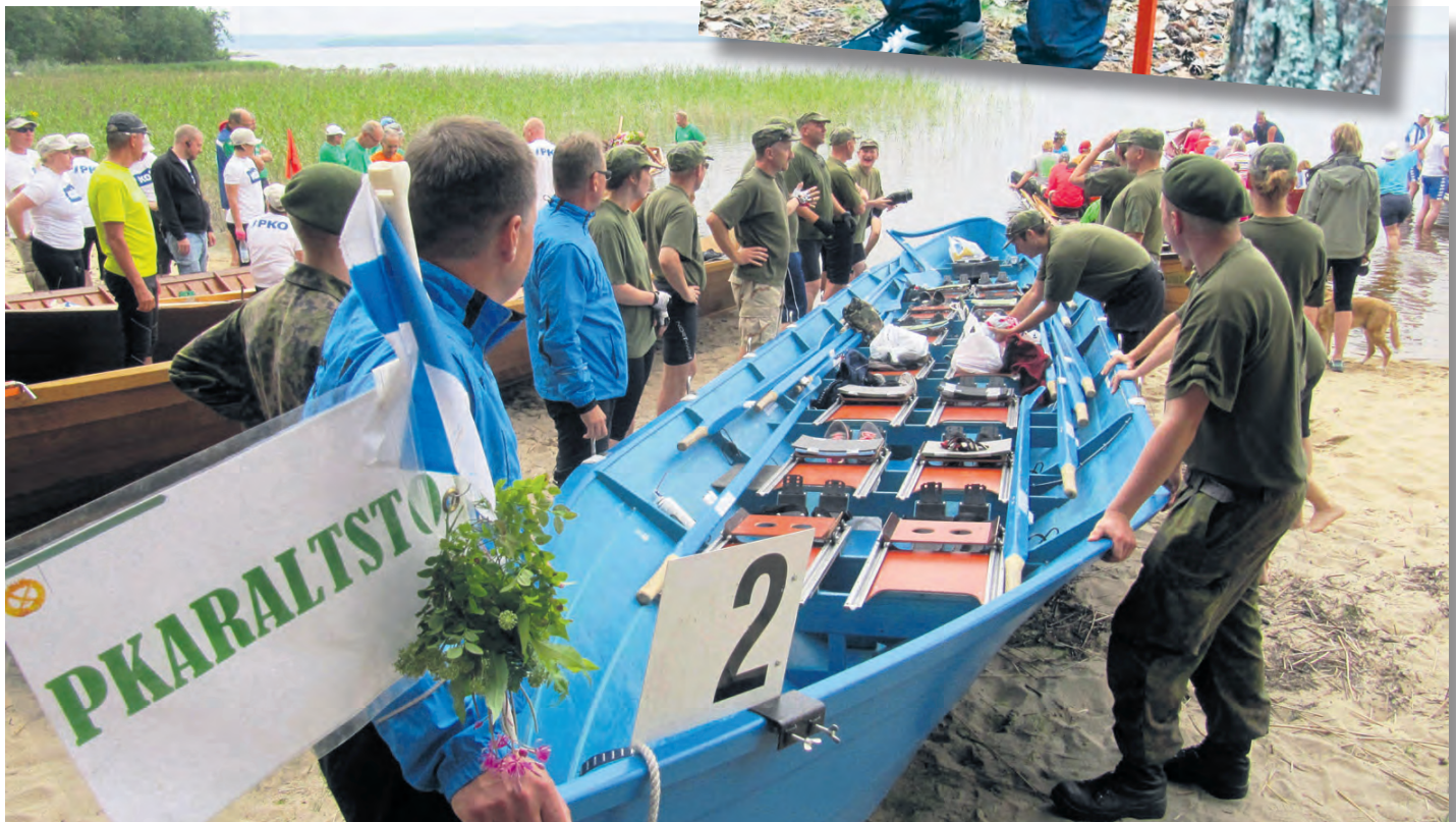
Pohjois-Karjalan aluetoimiston lipun alla hulppeassa veneessä souteli Karelia-soudussa myös reserviläisiä. Järjestyksessään 30. Karelia-Soutu järjestetään 27.7. - 1.8.2014.

kuntoa kehitetään suorittamalla vähintään puolen tunnin kuntosuoritus. Puolen tunnin suoritus antaa yhden pisteen, puolentoista tunnin suoritus kaksi pistettä ja yli kolmen tunnin liikuntasuoritus päiväkohtaisen maksimipistemäärän kolme pistettä. Sopivia liikuntalajeja on lähes rajattomasti, esimerkiksi hiihto, kävely, juoksu, suunnistus, kuntosaliharjoittelu, luistelu, soutu, eri palloilulajit ja ammunta.