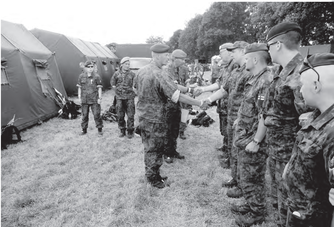
Marssi suoritettu ja on palkitsemisen aika.