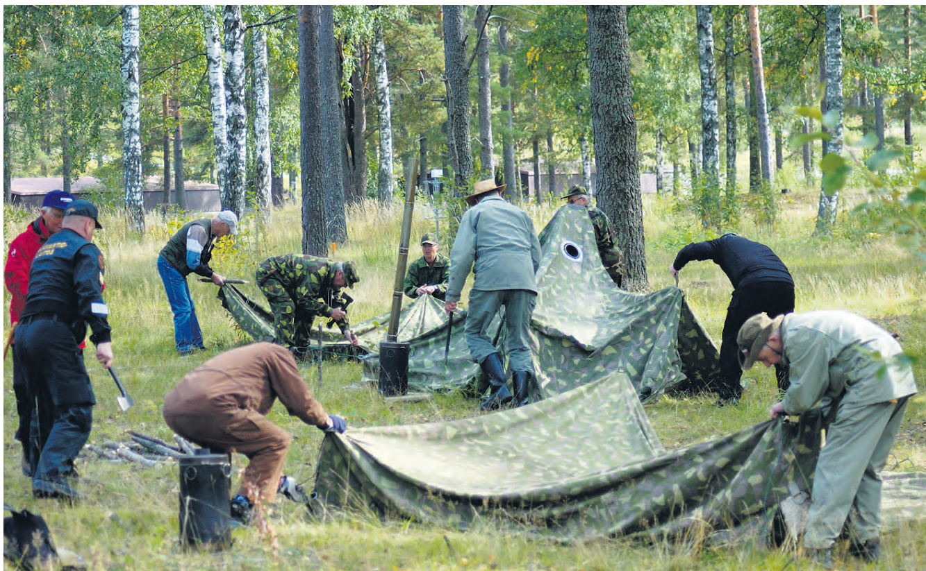
Toiminnallinen rasti oli sissiteltan pystytys ja kaminasta savun tuprautus.