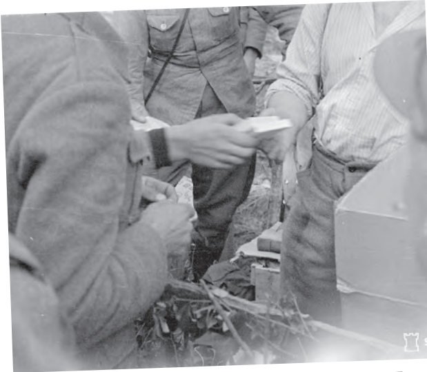
Kauan kaivattua tupakkaa on saatu Korpiselän Luu- talahteen 7.8.1941.