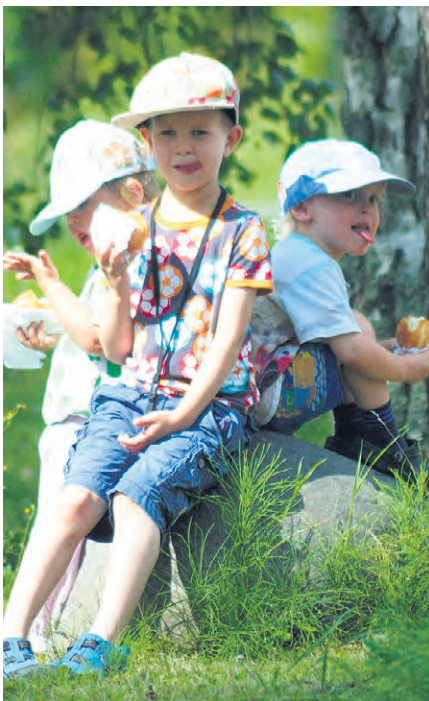
Niin hyvää, ettei sanotuksi saa.