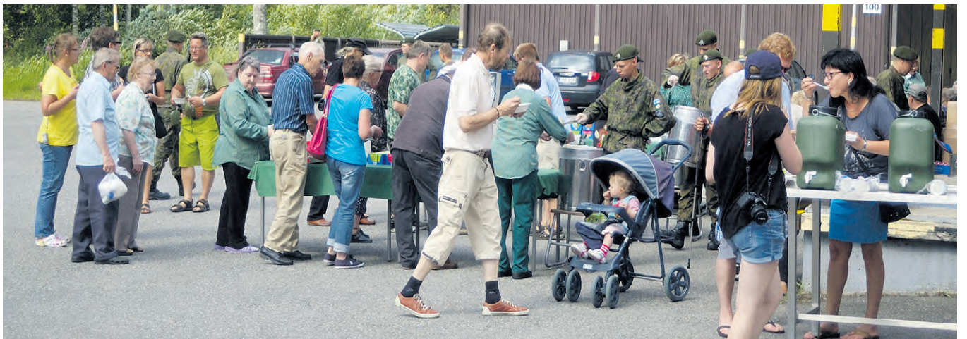
Hernekeitto maistui ja sitä oli riittävästi.