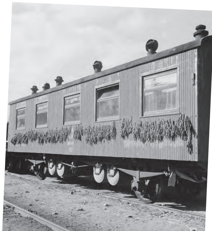
Tupakoita kuivumassa evakkojunan kyljessä Jaakkimassa elokuussa 1944.