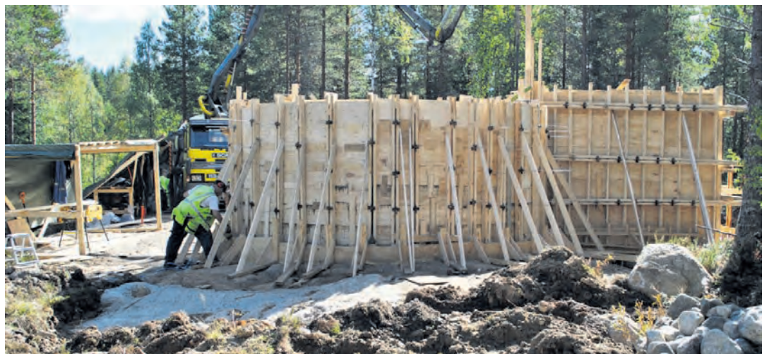
Kaatiolammen sotahistoriallisen yleisötalon seinä valettiin syyskuun alussa. Kuvan oikeassa laidassa olevat kivet muurataan seiiniin ensi keväänä.

- Katoksi tulee kalteva betoniholvi. Sen päälle laitetaan huopakate ja turve. Työt valmistuvat kuukauden kuluessa, Ratilainen