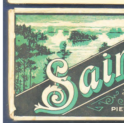
Saimaa ja Klubi kuuluivat suosituimpiin kamerkkeihin.

North State kuului sodan ajan tu tupakkamerkkeihin. Suomen my jääneestä viimeisessä vihreässä ” ilmoitus tupakoinnin vaaroista.