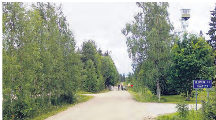
Raatteen tie Suomen puolella päättyy.