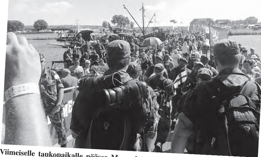
Viimeiselle taukopaikalle pääsee Maas -joen yli Nato joukkojen rakentamaa ponttoonisiltaa pitkin.

Se toi selvästi enemmän haastavuutta marssiin. Pitemmät marssiosuudet ilman taukoa yhdistettynä hyvin lämpimiin päiviin aiheutti usealle joukkueemme jäsenelle melkoisia jalkavaivoja. Mietittytti tietenkin, että mikä oli mennyt hiukan pieleen, sillä huolellinen valmistautu-