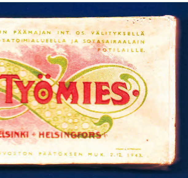
kasairaalan potilaille ja sotatoimialueella.