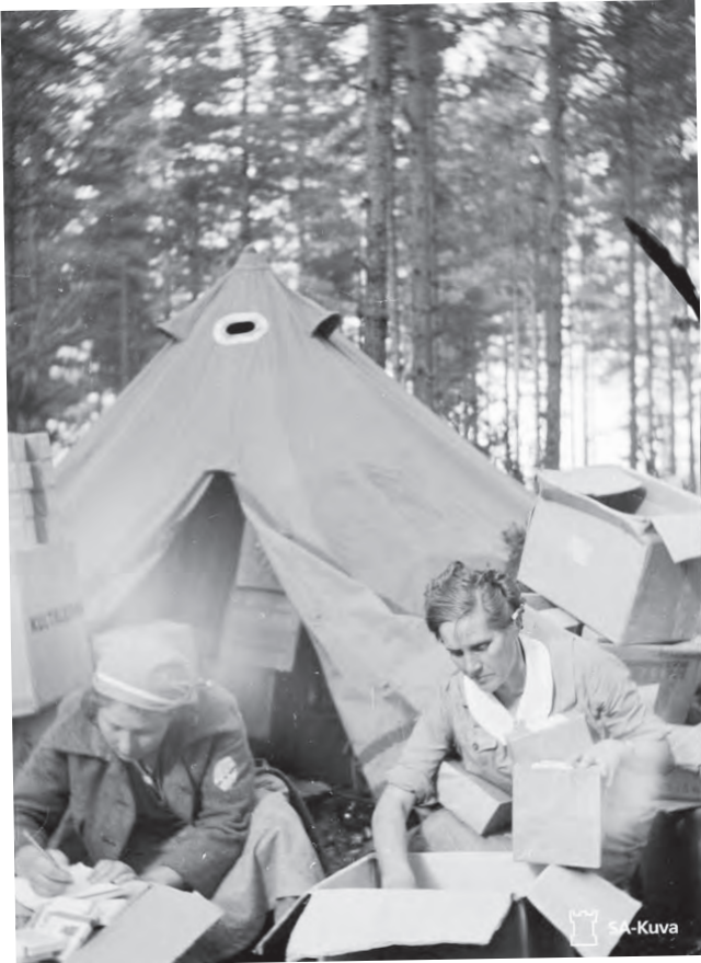
Tupakkaa pakataan valtavat määrät eri yksiköille.