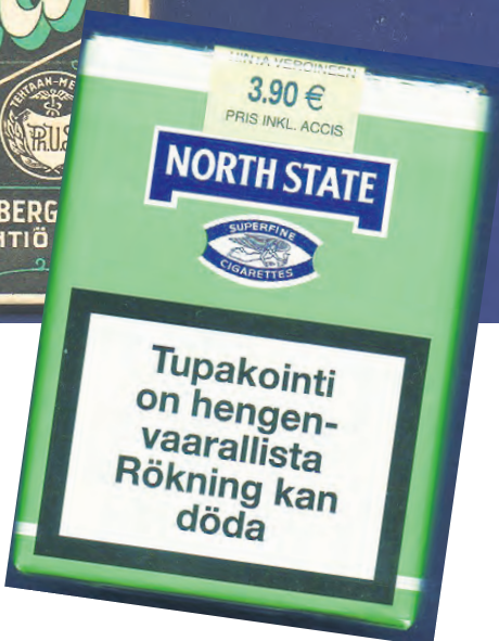
nnetuimpiin ynnistä pois Nortissa" oli