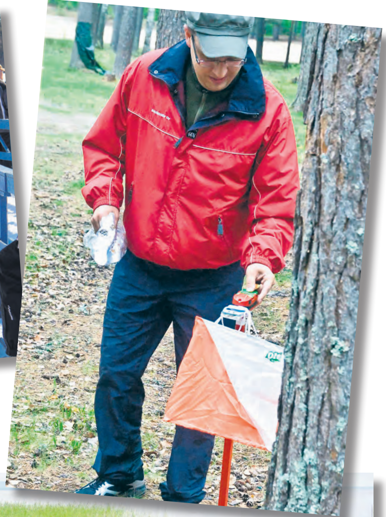
Myös suunnistus kartuttaa kuntokortin pistetilää.