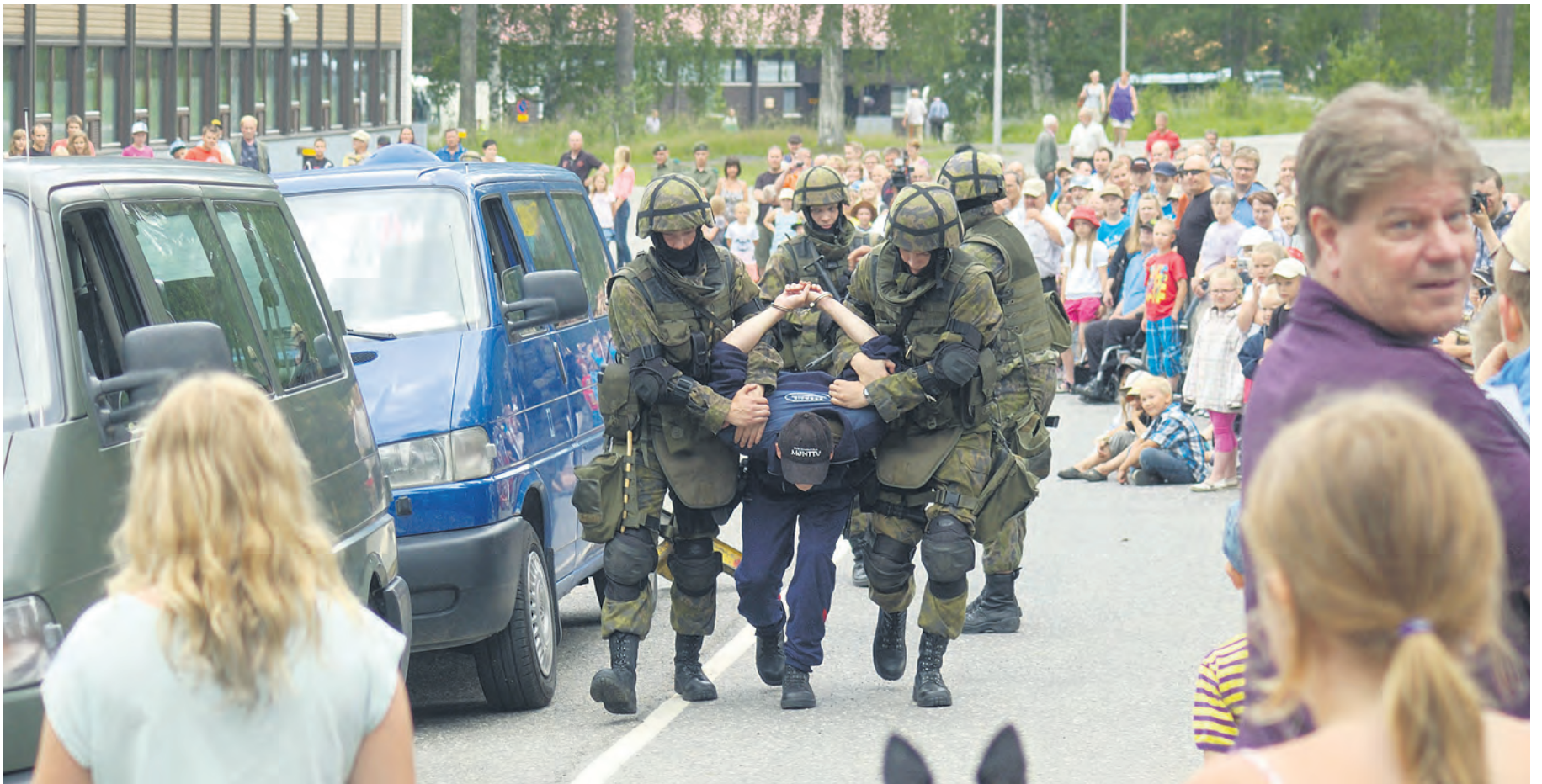
Toimintänäytöksessä oli toimintaa.