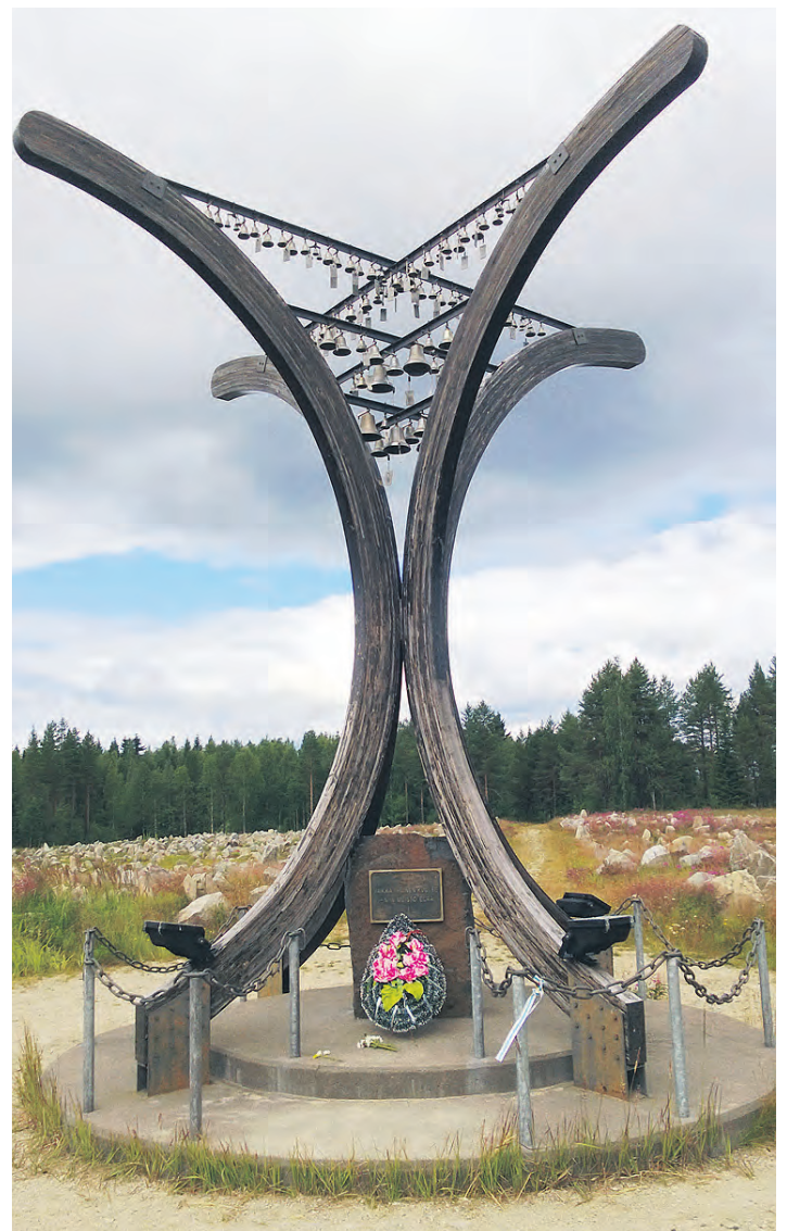
Talvisodan monumentti on vaikuttava ilmentys.