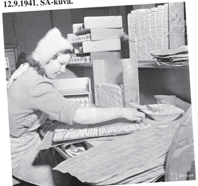
Suomen Tupakan tehtaalla. 26.1.1940.