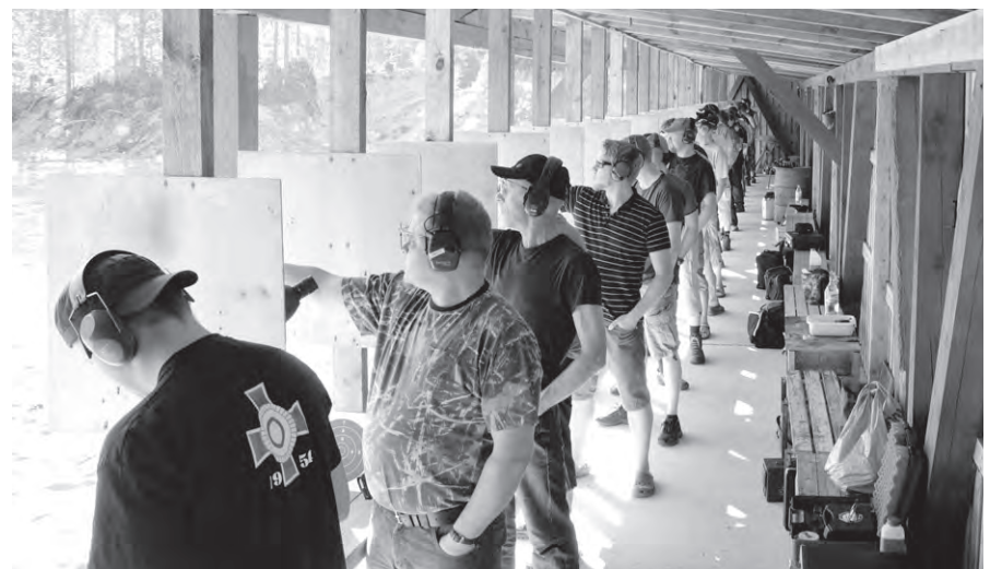
Piirin mestaruudet pistooliamunnassa ratkottiin Salmijärven ampumaradalla Outokummussa 2.-3. elokuuta.