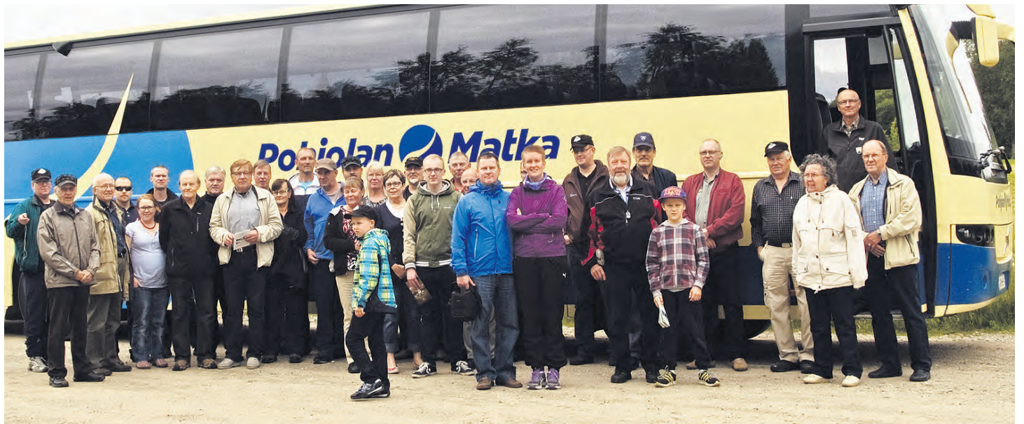
Raatteen tien retkeläiset "siellä jossakin".

Perillä Raatteen tien päässä tutustuimme Rajavartiomuseoon, joka on entisöity vuoden 1939