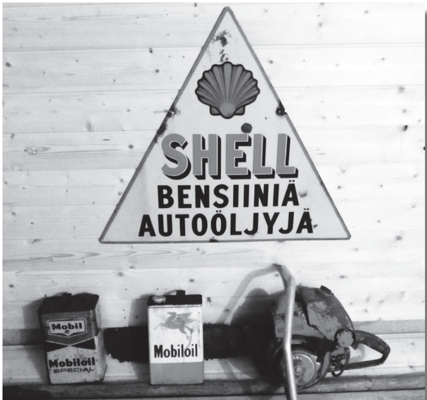
Polttoaineista ja öljyistä oli pulaa.