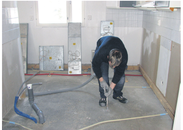
Vesivahingon sattuessa tarvitaan mittaus- ja kuivausalan ammattilaisten apua.

Hirvonen toimii MPK:n kurssilla pääsääntöisesti kouluttajana sekä taisteluvälinealiupserina.