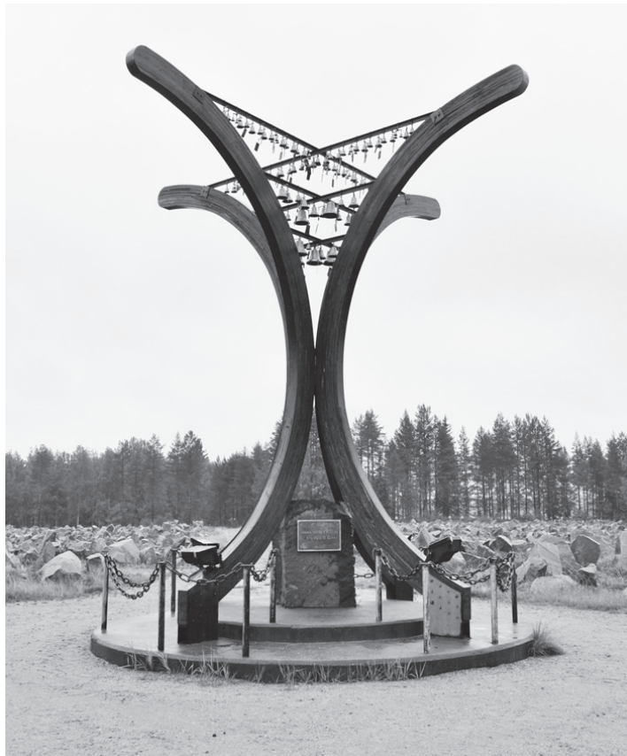
Raatteen tien ja Talvisodan monumenttiin on mahdollisuus tutustua heinäkuussa Kontiolahden Reserviläiset Ry:n järjestämällä matkalla.

Suomalaisten suureksi yllätykseksi neuvostojoukot hyök-