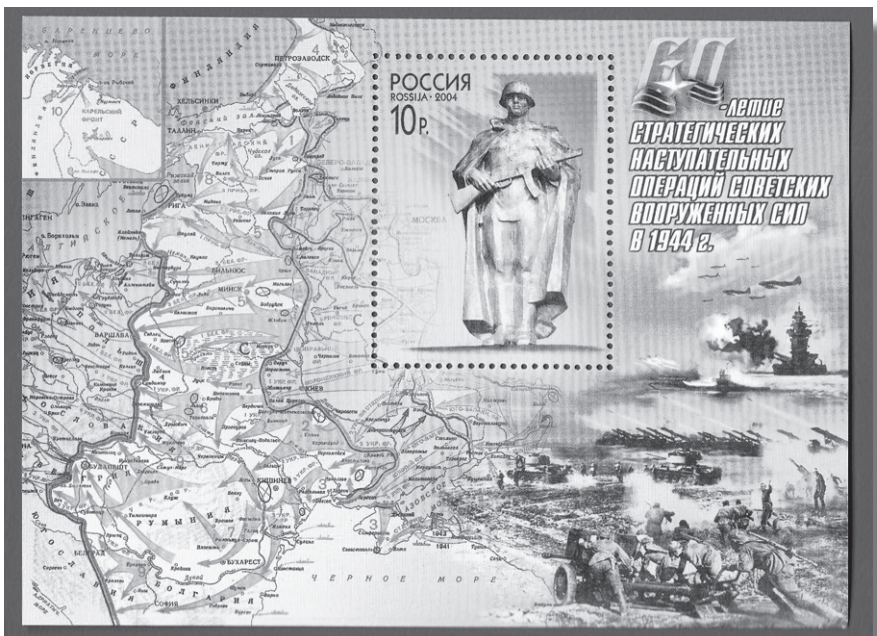
Neuvostoliiton sotavoimien eteneminen kohti länttä 1944. Venäjän juhlapostimerkki 2004. Ilomantsin kohdalla hyökkäysnuolen kärki pysähtyi kahden neuvostodivisioonan tappioon.