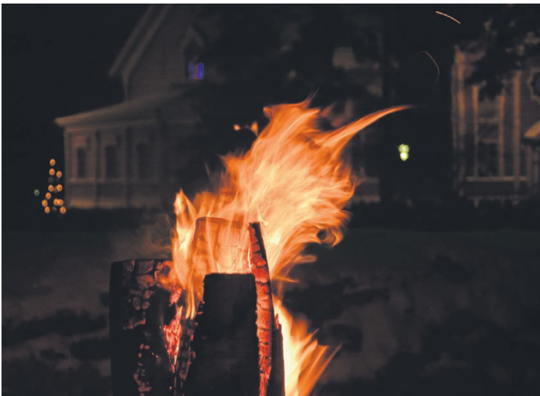
Joulutuli ja taustalla Kontiolahden kirkko.