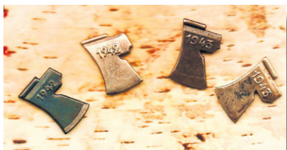
Rautaiset ja hopeoidut Mottikirveet 1942 ja 1943.

Vähimmäistavoitteena oli hakata vähintään yksi motti jokaista työikäistä kohti. Tavoite oli 1 miljoona kuutiometriä. Talkoo-organisaatiot järjestettiin sekä kotirintamalla että rintamalla. Kotirintamalla hakattiin syyskaudella 1942 1047844 mottia ja rintamalla 194346 mottia. Talkoisiin osallistui kaikkiaan noin 718000 henkeä, joista kolmasosa oli naisia.