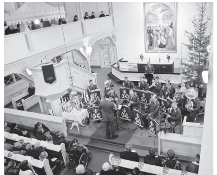
Kontiolahden kirkko ja "Kauneimmat joululaulut" -tilaisuus 12.12.2012. Musiikkia tarjosi Karjalan Sotilassoittokunta.