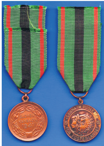
Vapaudenristin 2. luokan ansiomitali (vihreänauhainen).

oli Mestarikirves, jonka saamiseksi piti hakata 100 mottia halkoja. Mestarikirveen malli oli Suurkirves, jonka kirveenterän taustalla oli kuusen profiili. Mestarikirveen hakkasi kesään mennessä yli 160 henkeä. Heistä 10 oli naisia. Vanhin