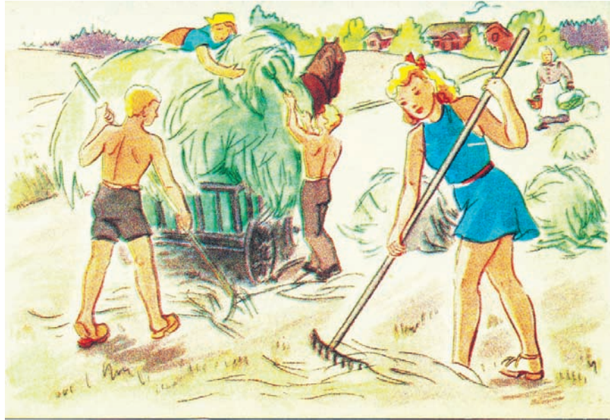
Postikorttejakin käytettiin työn markkinointiin nuorille. KKOy. K 16/10.

Vuonna 1944 korotettiin merkin arvoa. Korkeimman kirvesluokan ansiomerkki