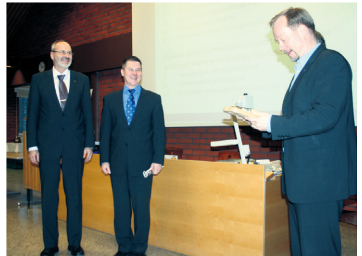
Vuoden Maanpuolustusteko -palkinnon luovutus käynnissä.

Yöpyminen tapahtui kasarmimajoituksessa. Lauantaina kävimme sitten yhdessä läpi ryhmien tuotokset. Suurimpina haasteina liiton toiminnassa nähtiin jäsenhuolto ja jäsenten ikärakenteen vinoutuminen. Pitkästä listasta haasteita kan-