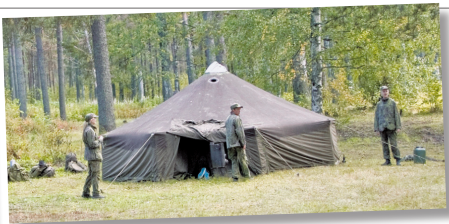
Ja hyvähän siitä tuli!