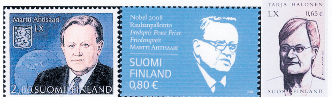
Martti Oiva Kalevi Ahtisaari postimerkeissä 1997 (60 vuotta) ja Nobel-palkinnon saajana 2008 (Erikoisuus: tukan jakaus väärällä puolella eli kuva on nurin päin - Ahtisaaren hyväksymänä). Tarja Kaarina Halonen sai merkin 60 vuotta täyttäessään 2003. Hän on viimeinen postimerkeihin kuvattu presidentti, koska Sauli Niinistön valinnasta on kulunut vasta lyhyt aika.