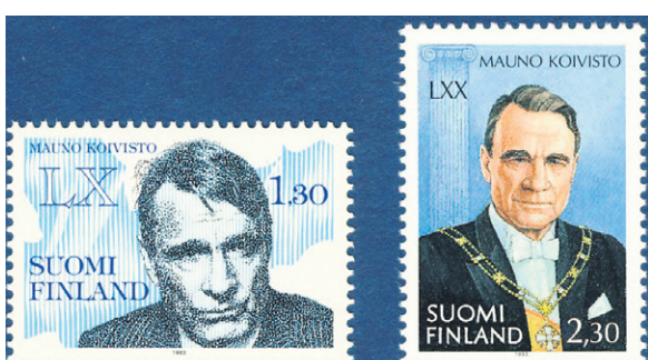
Mauno Henrik Koiviston postimerkit 1983 ja 1993.