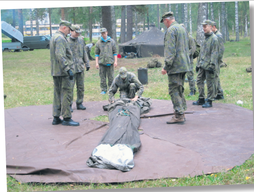
Teltan pystytys alkuvaiheessaan.