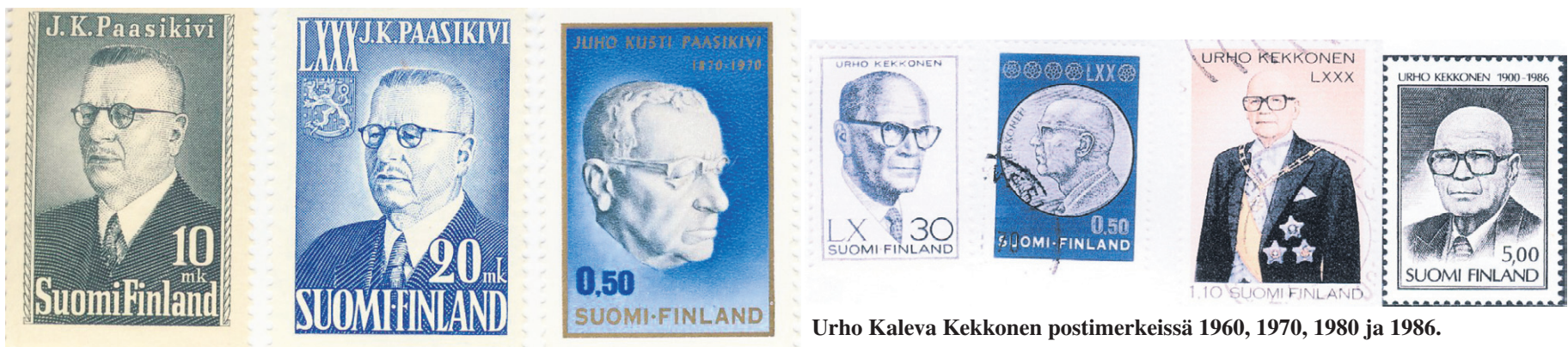
Juho Kusti Paasikiven postimerkki vuosilta 1947, 1950 ja 1970.