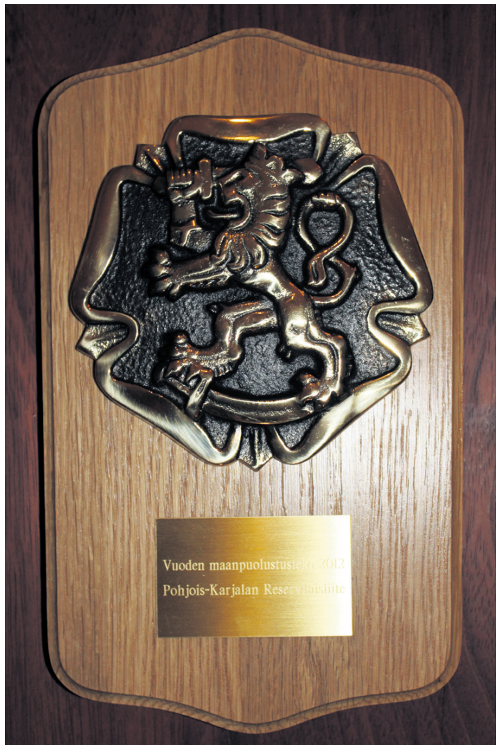
”Poika” on tullut kotiin.