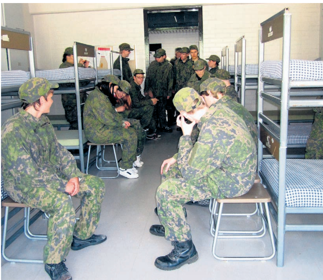
Varusmiesten majoitustupa tutustumisen kohteena. Ahtaalta, mutta siistiltä näyttää.

Teksti: Pekka Laakkonen