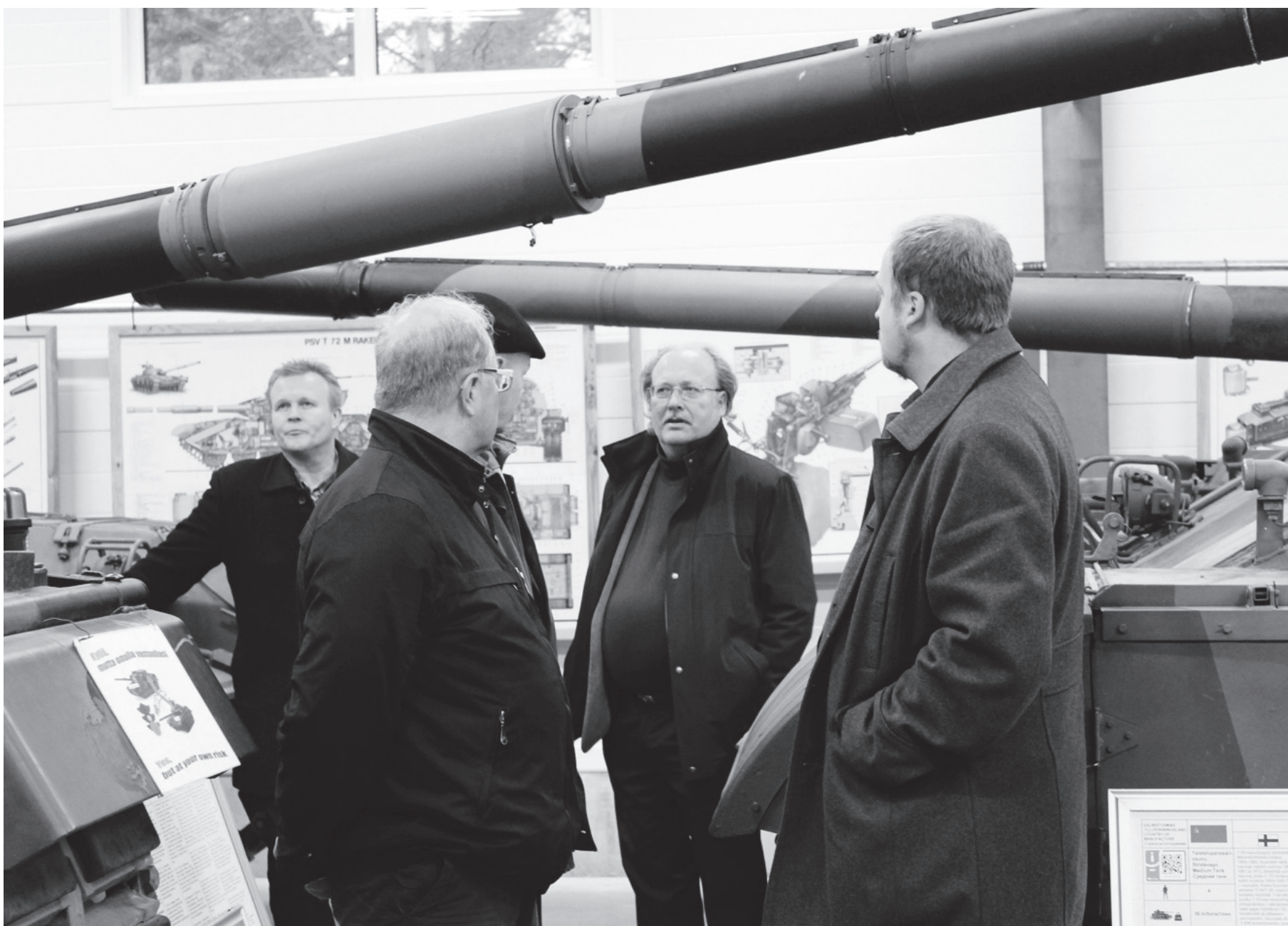
Kokousten lomassa tutustuimme panssarimuseoon.

nattaa mainita myös sisäisen viestinnän tehostaminen ja ampumaharrastusmahdollisuuksien jatkuminen maanlaajuisesti. Vastaavasti liiton vahvuuksina koettiin vankka järjestö rakenne, kunnossa oleva talous ja yhteinen aatteellinen pohja.