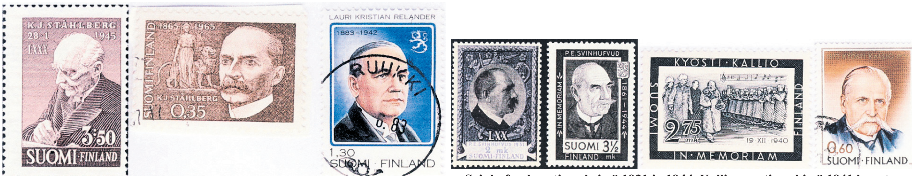
Ståhlberg 1945 ja 1965. Relander: syntymästä 100 v. Juhlapostimerkki vuodelta 1983.

Kallion asema vahvistui sittemmin ja 1937 hänet valittiin tasavallan presidentiksi Maalaisliiton ja SDP:n tuella. Ulkopoliittisesti Suomi kannatti puolueettomuutta ja pohjoismaista suuntausta,