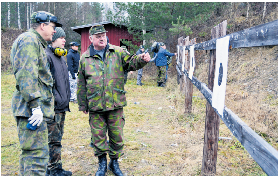
...ja sitten laskettiin osumat.

Suoritusvuoroaan odottavat saivat herkutella makkaran nimellä kulkevalla vihanneksella ja juotavana oli järjestäjien, Rääkkylän reserviläiset ry:n tarjoamat limonadit. Yhdistys huolehti myös taulupalvelusta