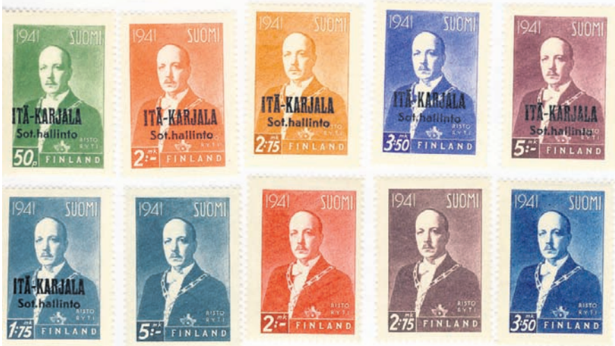
1941 Risto Ryti kuvattiin postimerkkisarjassa, joista kuusi oli normaalimerkkejä ja kuusi Itä-Karjalan lisäpainatuksella.