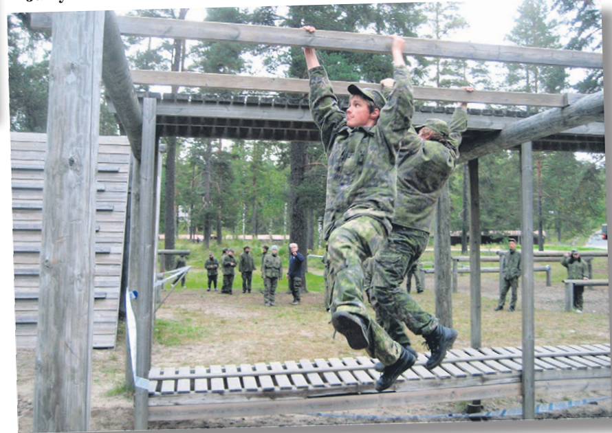
Vauhdikas tyylinäyte esteradalta.