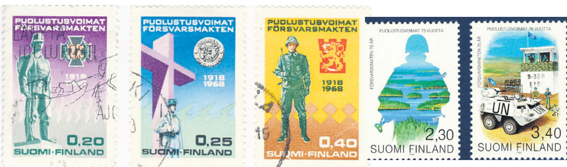
Puolustusvoimat 50 vuotta 1968 ja 75 vuotta 1993, jossa näkyy myös kansainvälinen toiminta YK.