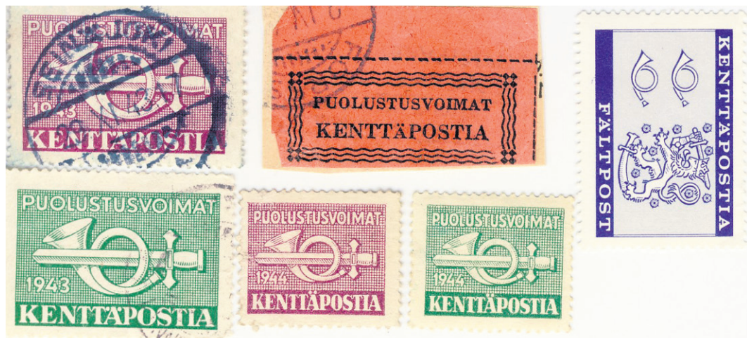
Sota-ajan kenttäpostimerkkejä 1943 ja 1944 sekä uudempi vuodelta 1963, jolloin sain omat merkit asevelvollisuusaikana. 1983 on painettu samanlainen merkki, mutta lisätynä vuosiluvulla.