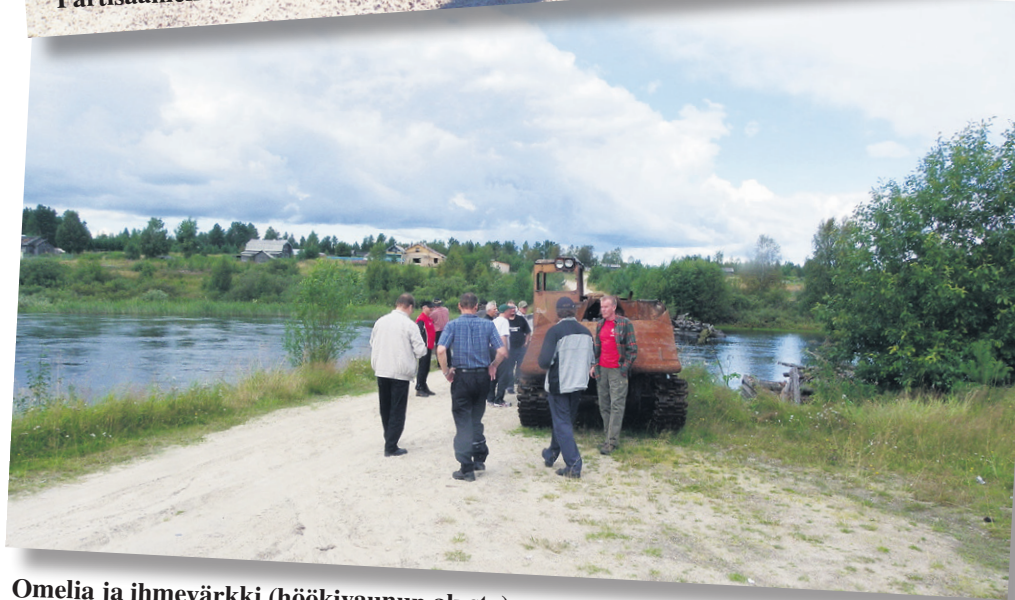
Omelia ja ihmevärkki (höökivaunun alusta).

jotain pysyvääkin – Vennään rajamuodollisuudet. Se olikin jo sitten melkein puolipäivä kun pysähdyttiin "Väiskin Parkissa" – perinteinen ulkoruokinta eli puistolounas datsa-alueen vieressä. Poikettiin siinä tietysti Kostamuksessakin. Sitten olikin se reissun ikävin osuus – 100 kilometriä munuaisten irrottelua Lietmajärvelle, mistä alkaa parempi asfaltti. Siinä patkalla huomattiin, että jos oli Pielinen lähtiessä kohtalaisen täysi, niin ei Vienassakaan kuivuudesta kärsitty. Joka järvi, lampi, joki, puro ja suotkin laitoja myöten holotna vodaa täysi.