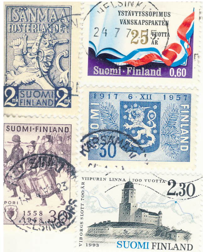
Isänmaa -postimerkki talvisodan 78. päivänä 15.2.1040. Suomi itsenäisenä 40 vuotta 1957, Ystävyyssopimus 25 vuotta 1973, Pori 400 vuotta 1958 (Porin kaupungin merkki, mutta porilaisten marssi on niin tunnettu, että merkki ansaitsee kuvansa artikkelin muiden merkkien mukana). Viime sotienkin myllerryksissä mukana ollut Viipurin linna täytti 700 vuotta 1993.