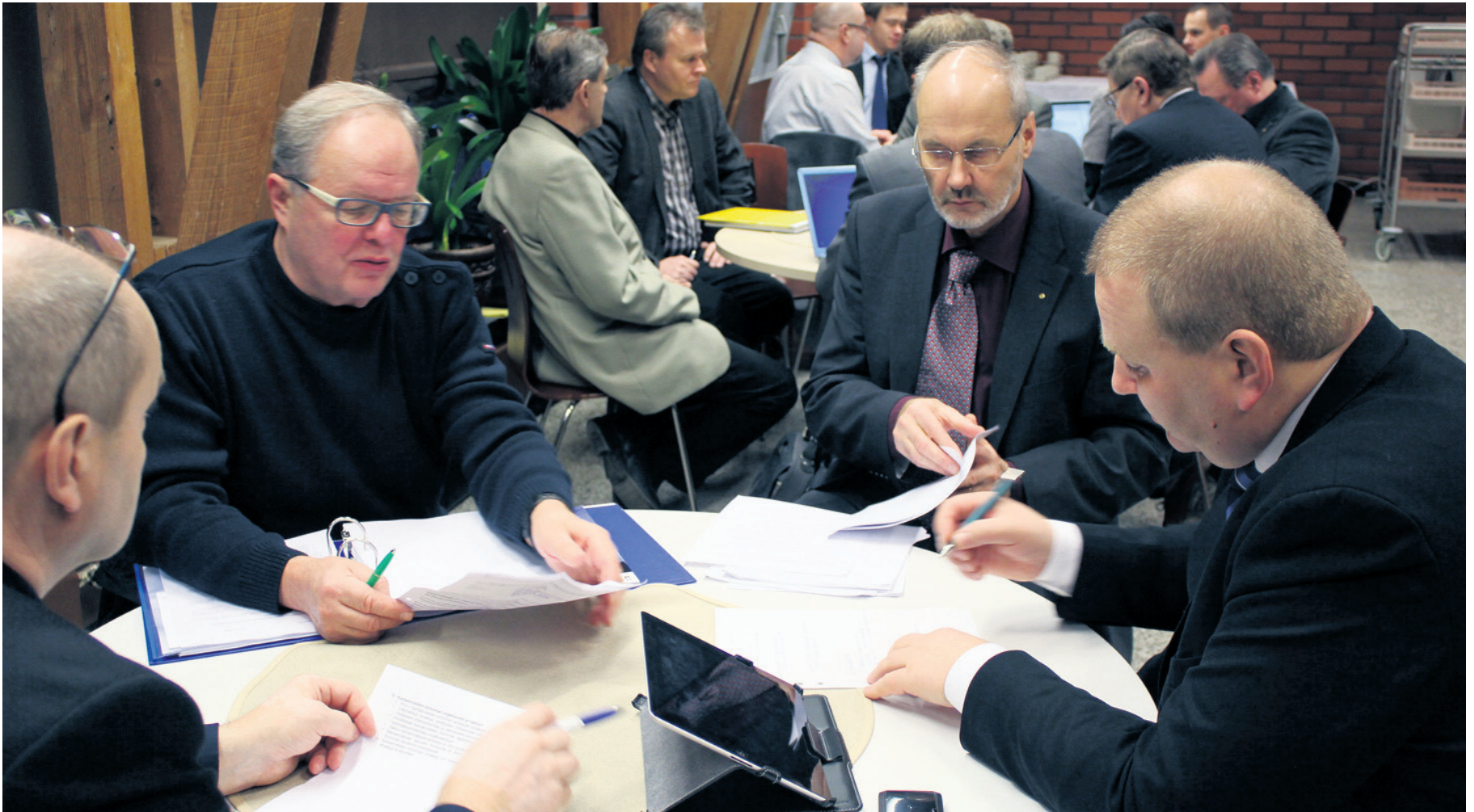
Liiton hallitus ja valtuusto ahersivat iltamyöhään.