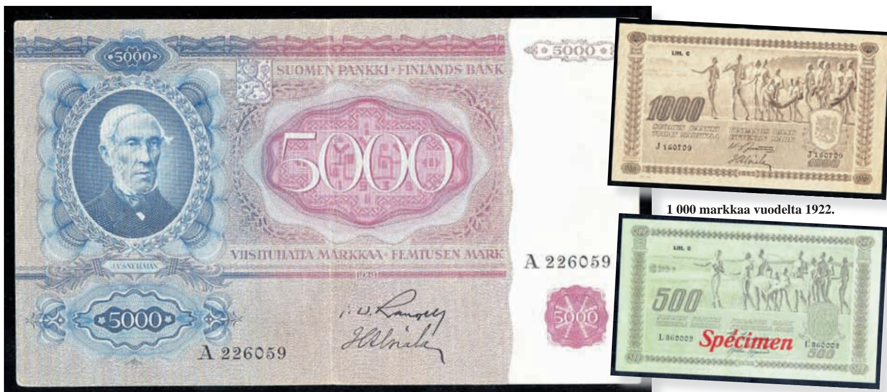
5 000 markkaa vuodelta 1939. "Snellman" otettiin käyttöön Talvisodan päätyttyä.