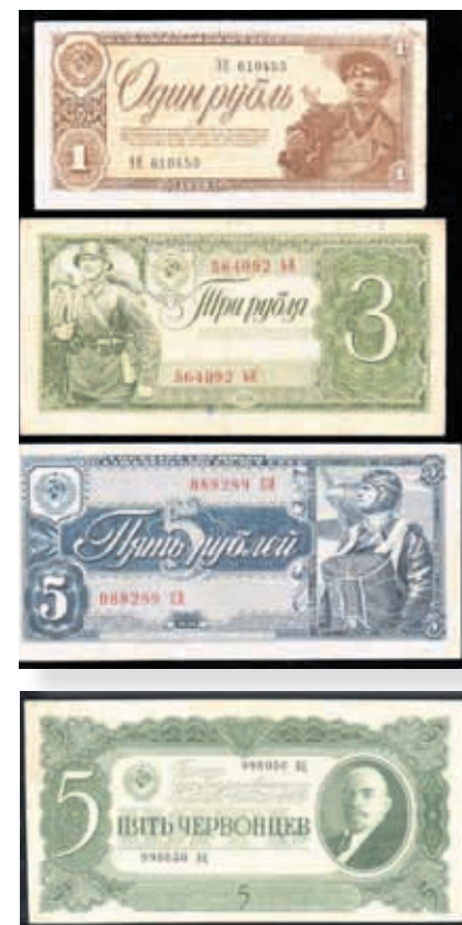
Neuvostoseteleitä: 1,3 ja 5 ruplaa vuodelta 1938 "Sotilaat" ja 5 chervonetsia vuodelta 1937 "Lenin".