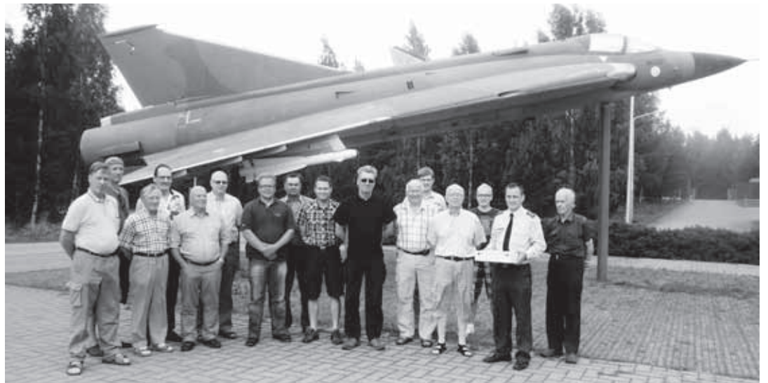
Osasto Pohjois-Karjalan reserviläisiä vieraili heinäkuussa Satakunnan lennostossa ja hyvien kokemusten myötä uusia retkiä jo suunnitellaan.