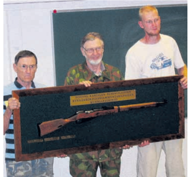
Joukkuekilpailun ykkönen oli Joensuun Reserviläiset tuloksella 850 pistettä.