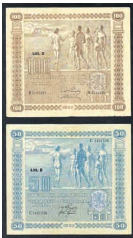
50 markkaa ja 100 markkaa vuodelta 1939.

Kuhmon Talvisotamuseoon tutustumisen yhteydessä tuli esiin Talvisodan ajan Suomen paperirahojen puuttuminen museon näyttelykokoelmista. Toin esille mahdollisuuden koota setelikokoelma harrastelijavoimin. Pohjois-Karjalan Numismaatikot ry. otti setelien hankinnan hoitaakseen. Monet alan yritykset ja yhdistyksen kannattajajäsenet tulivat hankkeeseen mukaan. Saimme kootuksi kolme vitriiniä käsittävän näyttelykokoelman.