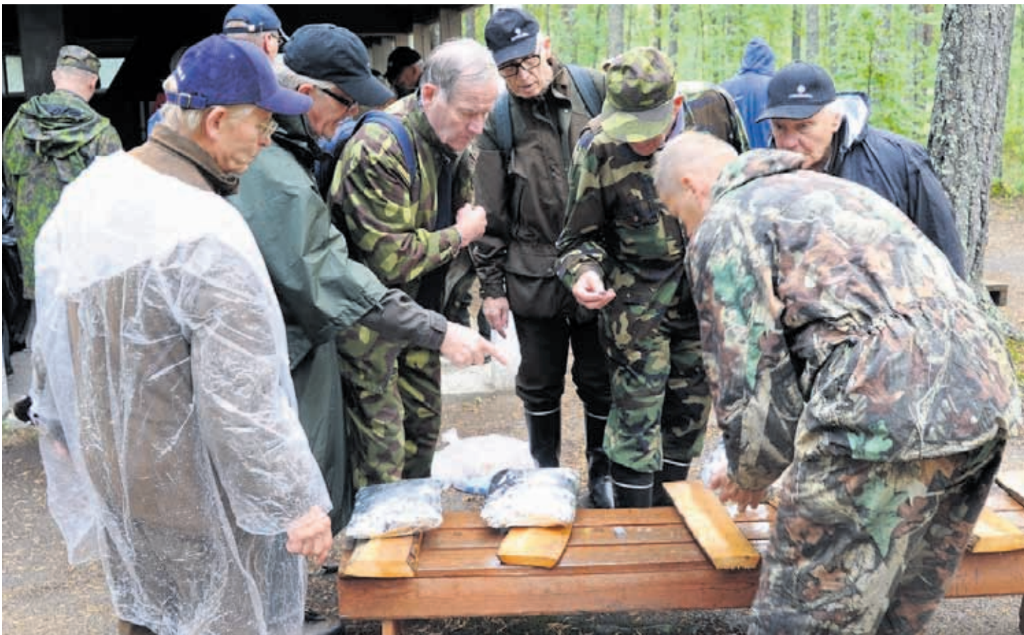
Rosvopaistit paketoitiin huolella.