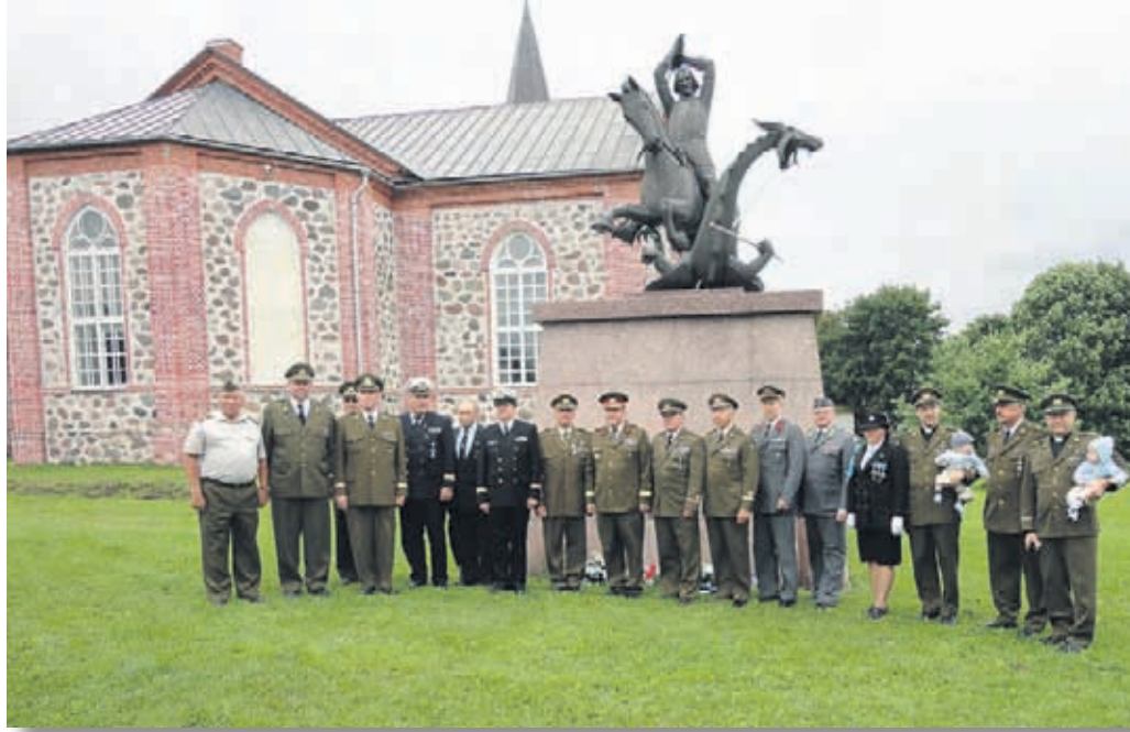
Viron uudelleenitsenäistymisen 20-vuotisjuhlassa laskettiin seppeleet Pyhän Yrjön patsaalle Torin kirkon pihalla Lounais-Virossa. Sotilaspappien sylissä nuorempaa virolaista polvea.