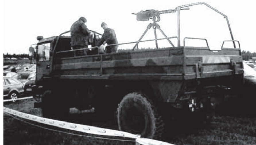
Lähtäjän ase. Puolustusvoimien komentaja, kenraali Ari Puheloinen ampui lähtölaukaukset ilmantorjuntakonekiväärillä.