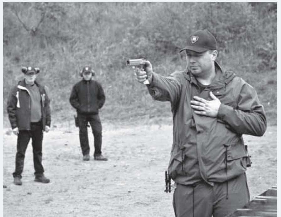
Kesäkuun lopulla Kontiorannassa järjestettiin ensimmäinen sovelletun reserviläisammunnan (SRA) kurssi.