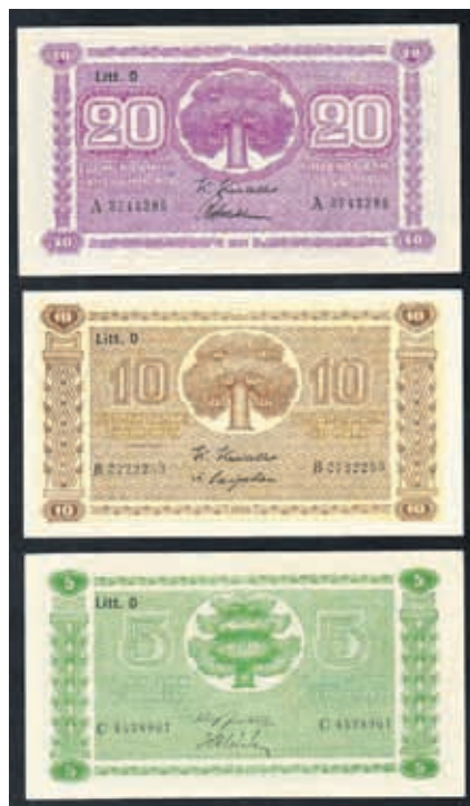
5, 10 ja 20 markkaa vuodelta 1939.