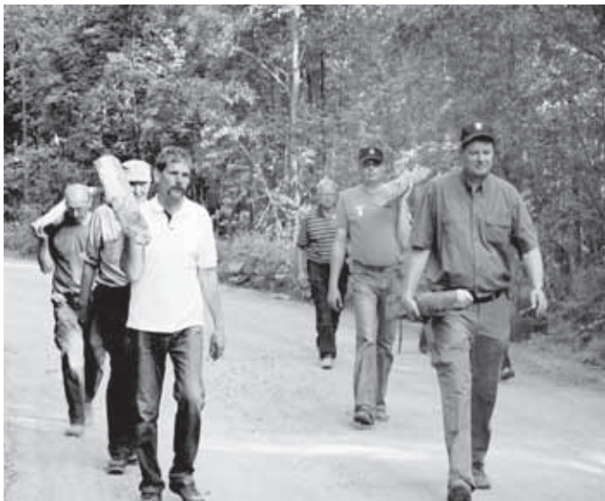
Osasto kantaa parruja tasaisella osuudella.

Matti Turunen, Jukka Partanen: Viipurin Rykmentti - Karjalan puolustaja 1626 - 1940. Hämeenlinna 2000. Erkki Rahkola, Carl - Fredrik Geust: Väitetty Elisenvaaran pommitus. Jyväskylä 2008. Simo Kärävä, Olli Tenkanen: Käkisalmenmemme. Saarijärvi 2001. Sotatieteen Laitoksen Sotahistorian toimisto: Talvisodan historia 2. Porvoo 1984.