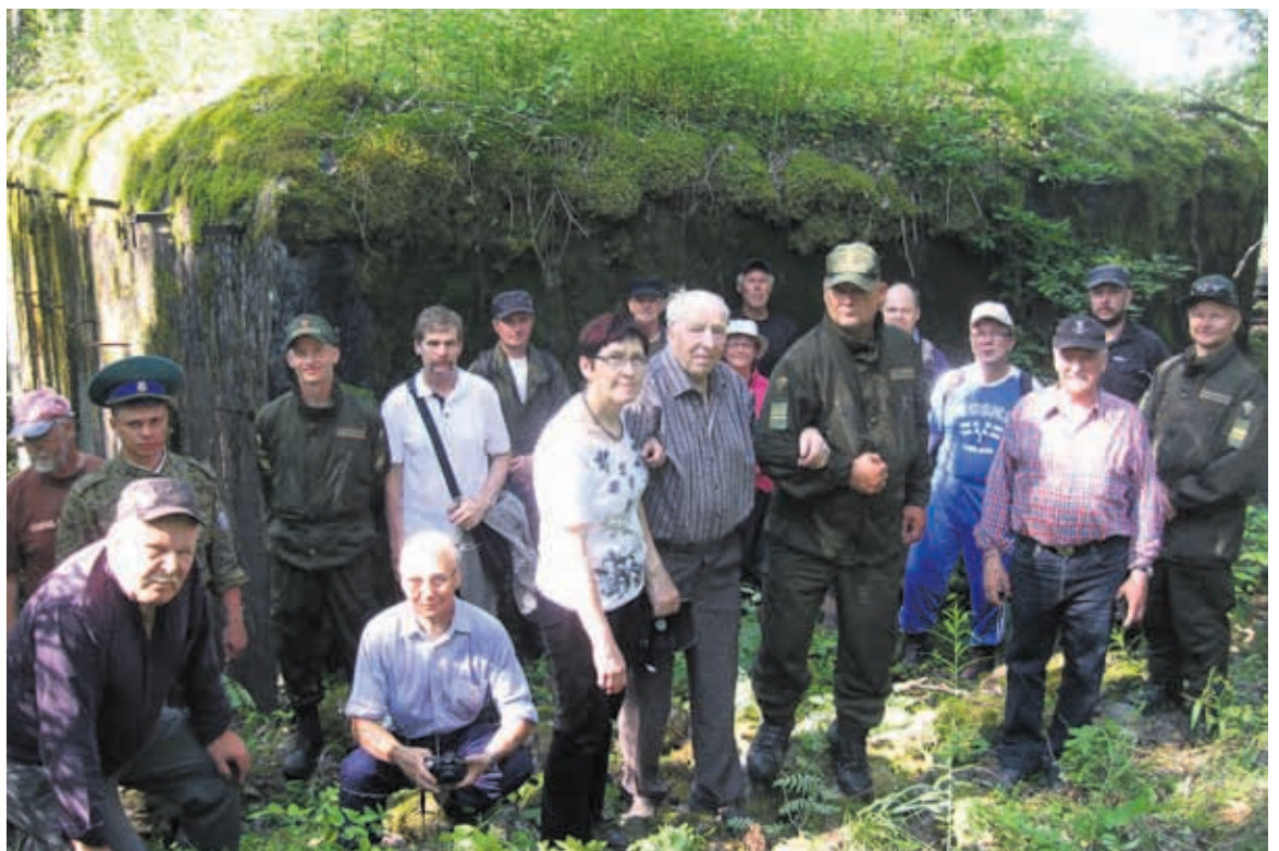
Kuivalaisen kukkulan bunkkerin edessä yhteiskuva.

Reserviläiset tekivät paikan päällä runsaasti lapiotyötä ja alueen raivausta. Juhlapäivänä he opastivat ja ohjasivat liikennettä.