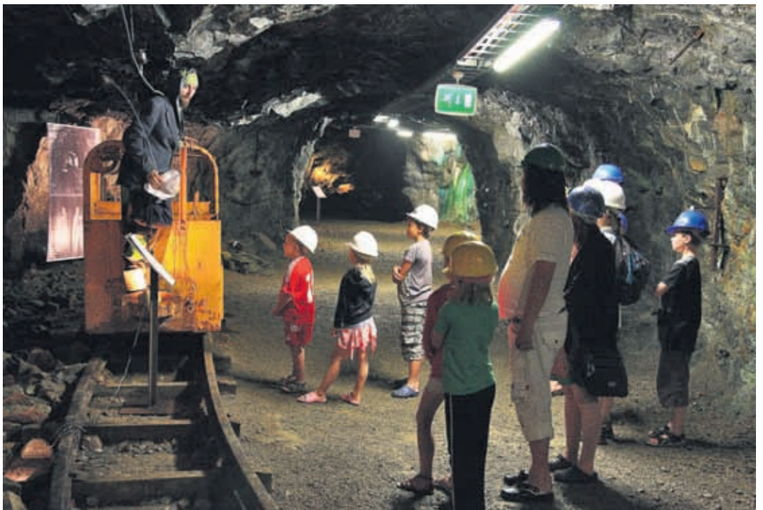
Outokummun museotunnelissa käynti on jännittävä kokemus.

Kesäisin matkailija pääsee tutustumaan teatteri Kiisun esityksiin ja tuliaiset kotiin saa kätevästi matkamuiistomyymälästä. Outokummussa on määrätietoisesti lähdetty kehittämään kaivoksen aluetta, joka on ainutlaatuinen koko Euroopan mittakaavassa.