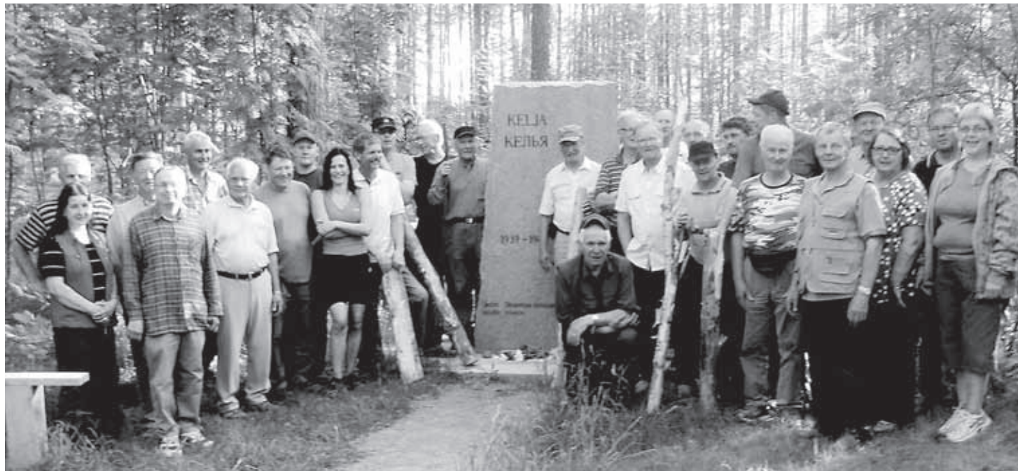
Ryhmäkuva Keljan muistomerkillä.

Ilmahälytystä ei saatu Elisenvaaraan ennen ensimmäistä pommitusaaltoa päivällä klo 12.32. Toinen aalto pommikoneita tuli klo 12.38 ja kolmas aalto 12.44. Kolmannen aallon mukana olleet saattohävittäjät jahtasivat vielä konekivääreillä ja mahdollisesti 20 mm. tykeillä pakenevia naisia ja lapsia. Hävittäjät eivät ehtineet torjumaan näitä Elisenvaaran pommituksia ja omaa kiinteää ilmatorjuntaa ei tuolla hetkellä paikalla ollut, hävittäjillä oli kiireitä rintamalinjoilla. Uhrluku jäi epäselväksi, nimeltä