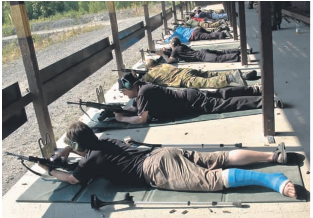
Vaikka kilpailussa oltiin vähän kipsissä, niin sihti oli kohdallaan.