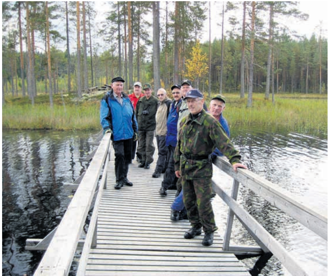
Rajajotoksen osallistujat päivittivät sotahistoriatietouttaan Matkalammen upeissa maisemisissa.

Telitie 1, 80100 Joensuu, puh. (013) 233 800