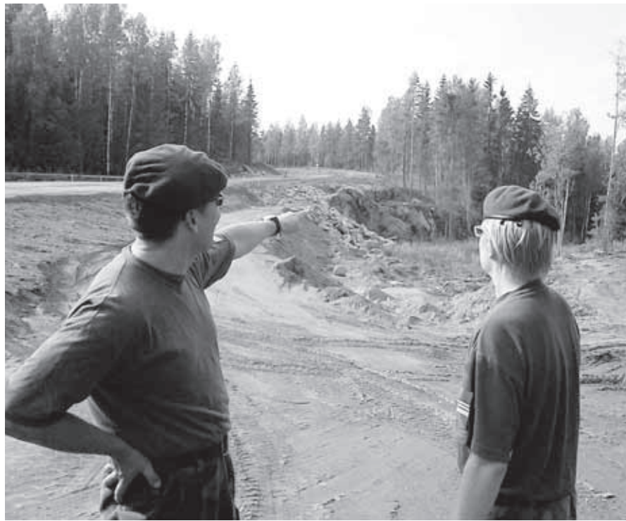
Santahaminasta palatessa suoritettiin maastontiedustelu käytetyissä taistelu- maastoissa.

omia joukkueitaan varsinaisessa taistelussa. Neljään eri kertaan vedetyissä erissä korostuivat erityisesti hyvin tehdyt suunnitelmat. Vuoronperään sinisellä (puolustava) komppaniolla ja punaisella (hyökkäävä) mekanisoidulla pataljoonalla ”pelatessaan”, saivat reserviläiset hyvän kuvan sekä puolustajan, että hyökkääjän vahvuuksista ja heikkouksista. Hyökkääjän vahvuus on nopeus ja tulivoima, puolustajan puolestaan maastonkäyttö. Vaikka sama asia on tullut jo usein aiemmissakin kertauksissa esille, on suomalaisen