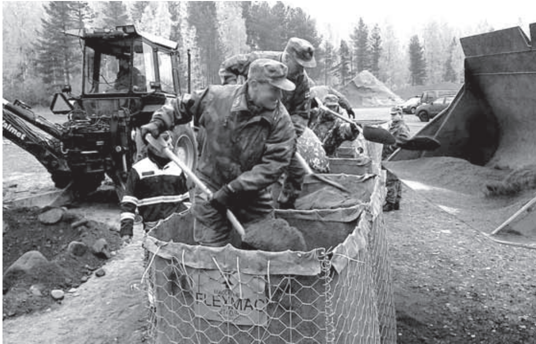
Rastien aiheina olivat kadonneen etsintä, vesivahingontorjunta, myrskytuhon raivaus, alueeristys ja yhteistoiminta helikopterin kanssa.

Susirajan, eli Pohjois-Karjalan maakuntakomppanian virka-apuosasto osallistui 8.-10. lokakuuta 2010 Karjalan Lennostossa Rissalassa pidettyyn yhteisharjoitukseen. Itä-Suomen sotilasläänin järjestämään harjoitukseen osallistui maakuntajoukkoja paitsi Pohjois-Karjalasta, myös Pohjois- ja Etelä-Savosta. Koska kyseessä oli virka-apuharjoitus, oli paikalla myös poliisin ja pelastuslaitoksen vahva edustus. Samanaikaisesti reserviläisille suunnatun kertausharjoituksen kanssa järjestettiin myös viranomaisille yhteisharjoitus, joka koordinoi hätäkeskuksen tiloista harjoituksen aikana toteutettuja virka-apurasteja. Virallisesti ohjelma alkoi perjantaina kello 9 Kuopiossa Pohjois-Savon aluetoimistossa järjestetyllä moniviranomaiskokouksella, jossa case-tyyillisesti pohdittiin erilaisia virka-aputapauksia. Paikalla oli erittäin kattavasti viranomaisia: poliisin, pelastuslaitoksen, hätäkeskuslaitoksen, puolustusvoimat, ELY:n, keskussairaalan, sosiaali- ja terveysviranomaiset ja Finavian mainitakseni. Takarivistä tilaisuutta sai seurata myös ryhmä maakuntajoukkojen upseerista. Reserviläisille tilaisuudessa mukana olo oli varsin hyvä tilaisuus nähdä kuinka monitahoisia suuremmat onnettomuustilanteet ovat, ja kuinka useata eri tahoja ne koskettavat. Tämän yhteistapaamisen jälkeen olikin