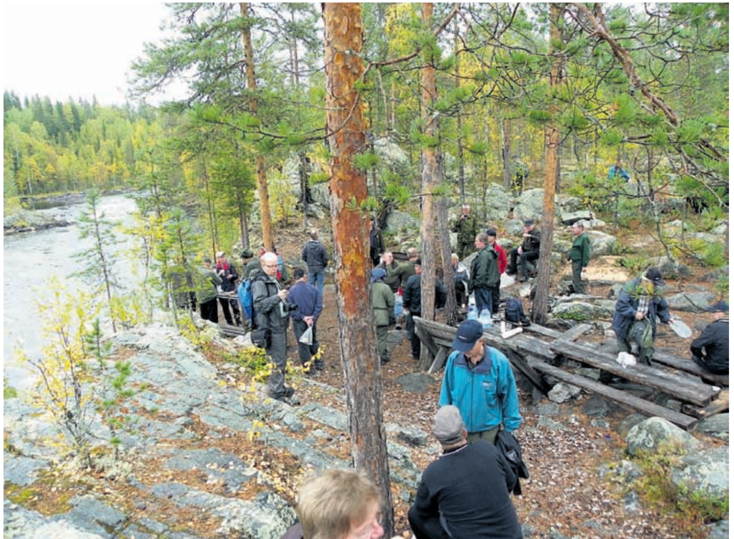
Tsirikka-Kemijoella retkeläiset tutustuivat Tahkokosken taistelualueisiin ja tukikohtiin.

Sunnuntaina painettiin niin itään kuin Raappanan joukotkin, eli vähän ohi Ontajoen. Hyökkäyssuuntaan liikuttaessa kuultiin luento Ontrosenvaaran ja Rukavaaran taisteluista. Äärimmäisissä asemassa tutkimiskohteena oli PALLO-tukikohta. Siellä on jäljellä muun muassa tukikohdan