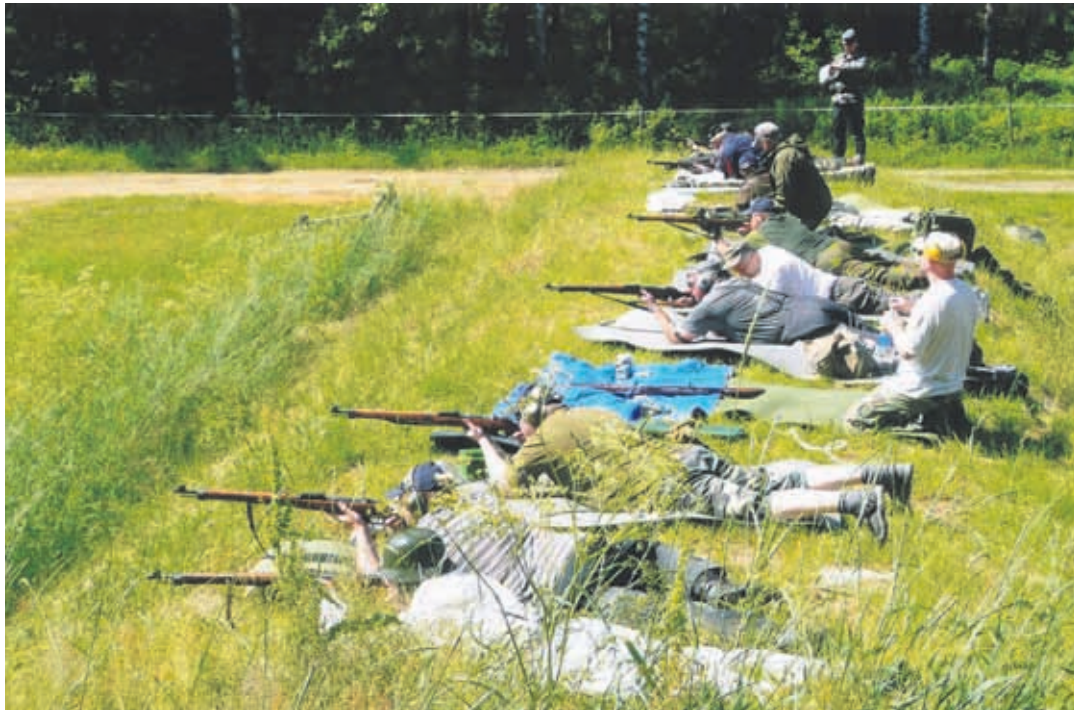
Liperin vihreillä niityillä oli Suomen kuumin kisapaikka. Ampujilla varustus erittäin vapaa – mutta pakollinen.