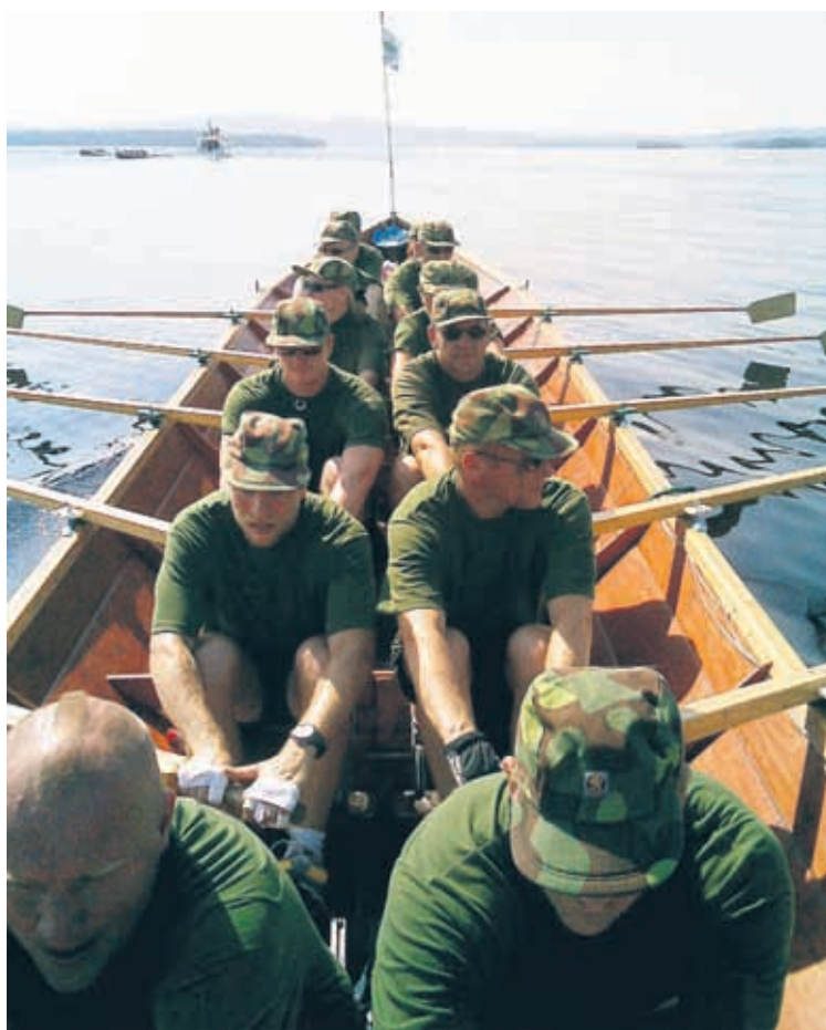
Pohjois-Karjalan maakuntajoukot Karelia-soudussa 2010.