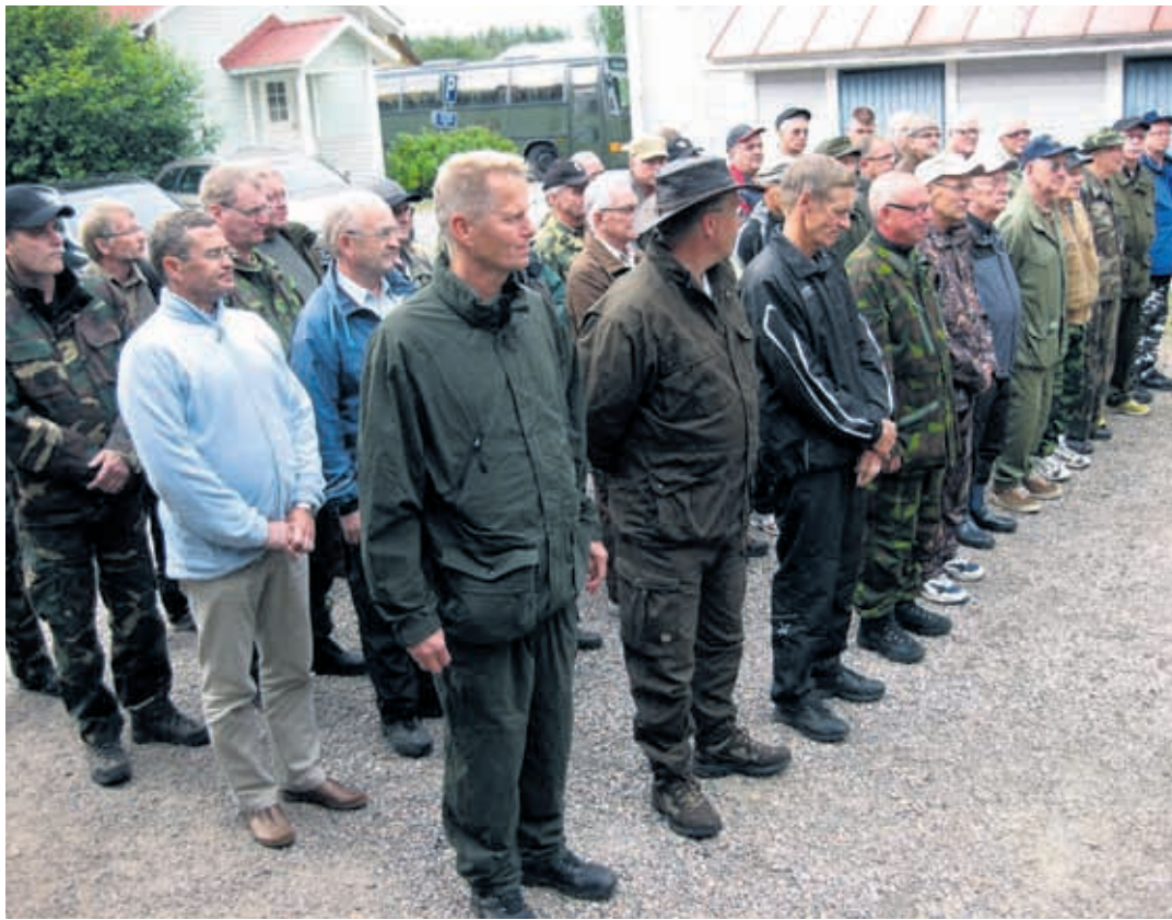
Jotoksen osanottajat avajaistilaisuudessa.

Iltapäivällä Jotoslaiset kipsivat bussiin, joka suuntasi Polvelaan Juuan ev. lut. seurakunnan leirikeskukseen. Majoitusjärjestelyjen jälkeen