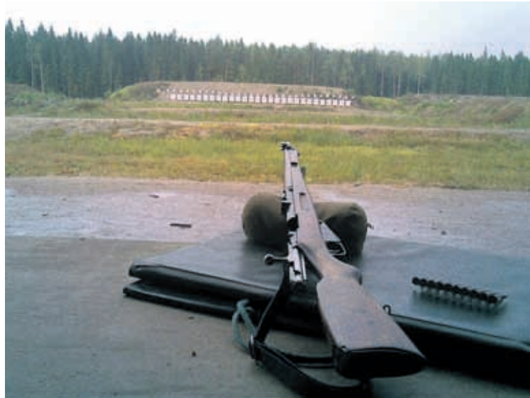
Reserviläisurheiluliiton perinneasekilpailut järjestettiin Lahdessa 14. 8.2010.