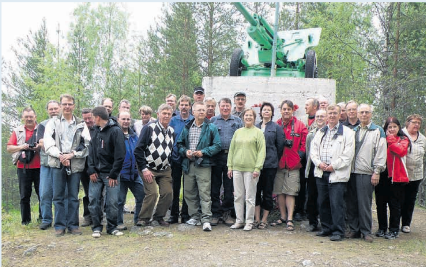
Retkeläiset kokoontuivat yhteiseen kuvaan niin sanotulla Munakukkulalla.

Raja ylitettiin ajallaan ja päästiin tutustumaan Kostamuksen kaupunkiin kiertoajelulla, kaupungissa on n. 30 eri kansallisuutta ja n. 30000 asu-