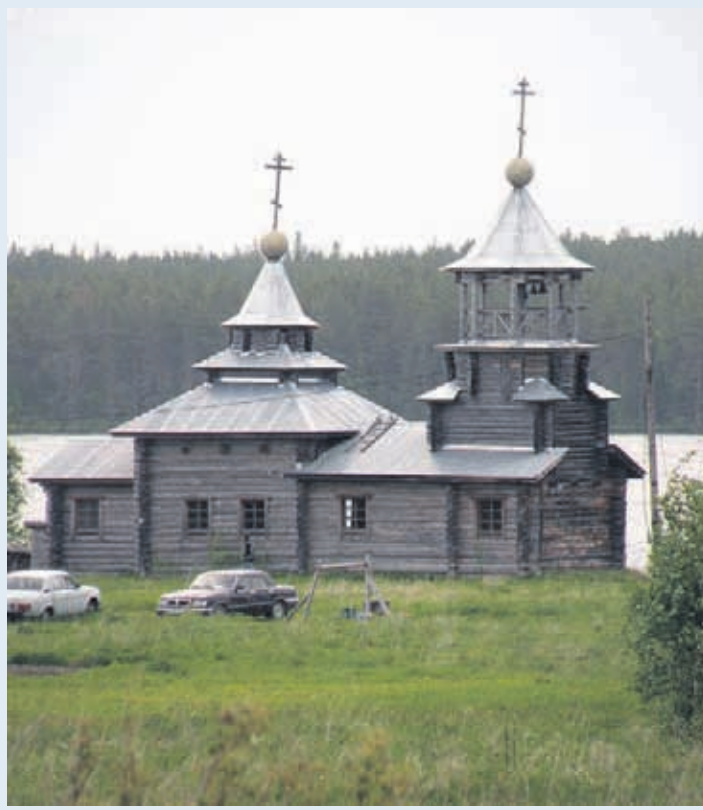
Vuokkiniemen 1997 valmistunut kirkko kuvattuna läheiseltä Kalmismäeltä.