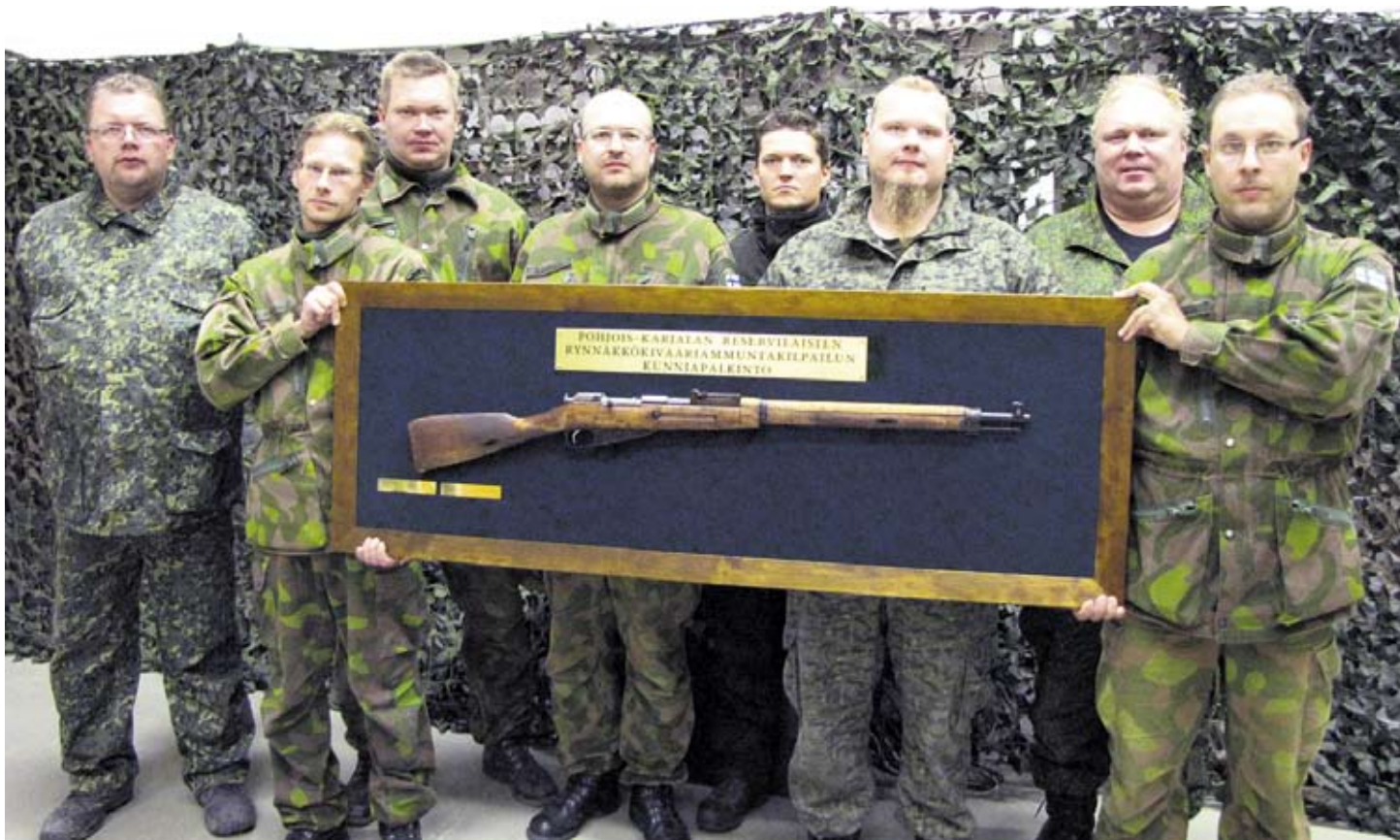
Pyhäselän reserviläisiä hymyilyttää - kolmas kisa ja kolmas kiinnitys palkintokivääriin.