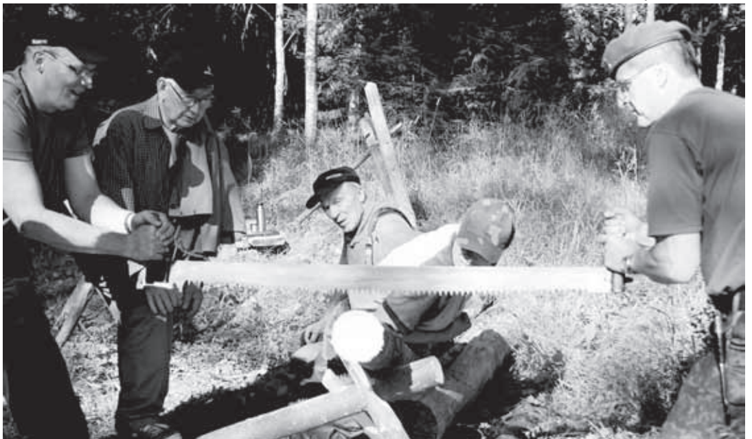
Partio suorittamassa rastitehtävää vuoden 2009 Jotoksella.