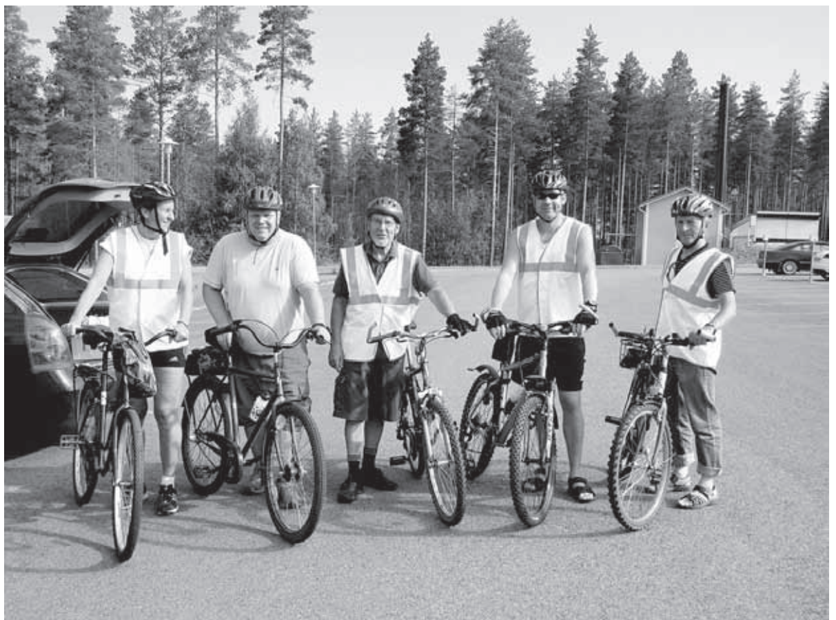
Aurinko paistaa ja hymy on herkässä lähdön hetkellä.