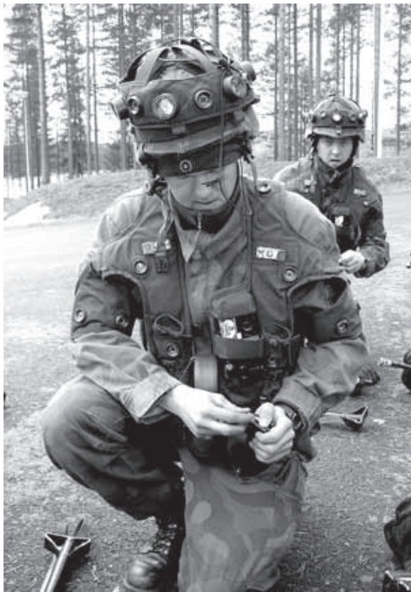
Maaliosastoon kuuluva Onttolan rajajääkäri puki ylleen taistelusimulaattoria vuoden 2009 kertausharjoituksessa Hiinvaarassa.

Asevelvolliselle voidaan myöntää vapautus kertausharjoituksesta asevelvollisuuslain (1438/2007) 34 § 1 momentin perusteella neljässä (4) tapauksessa. 1) Ammatin ja elinkeinon harjoittaminen vapautusperusteena koskee jatkossa pääsääntöisesti vain yksityisyrittäjiä ja yksityisiä elinkeinonharjoittajia, joiden yritys- tai elinkeinotoiminta on pienimuotoista. Tyypillisimpiä esimerkkejä ovat pienet perheyrittäjät tai 1-3 ammattihenkilön muodostamat rakennus- ja palvelualojen yritykset. Mahdollisen vapautuksen perusteena on tällöin henkilön merkitys ammatin tai elinkeinon harjoittamiselle ja sen jatkuvuudelle kokonaisuudessaan. Maatalousyrittäjien ammatin- tai elinkeinon harjoittamiseen liittyvien vapautushakemusten käsittelyssä otetaan huomioon tilan koko ja tilalla käytettävissä oleva työvoima sekä saatavissa oleva lomitus. Erityisenä syynä voidaan pitää harjoituksen ajoittumista kylvä- tai sadonkorjuuajakaan. Todettakoon, että poikkeusolojen maataloustuotannon ylläpitämisen perusteella on mahdollista hakea keskeisille maatalousyrittäjille asevelvollisuuslain 89 §:n mukainen henkilövaraamisen päätös (ELY-keskus hakee), jolloin tällaista asevelvollista ei käsketä