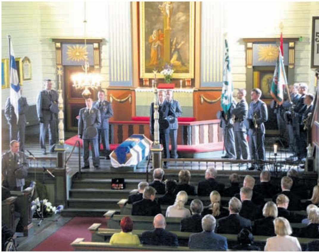
Arvostettu sissiritari saatettiin suurella joukolla viimeiselle partiomatkalleen.

Harvinaista on sotilaana tehty työ. Harvinaista on maanviljelijän saamat tehtävät yhteisten asioiden hoitajana ja