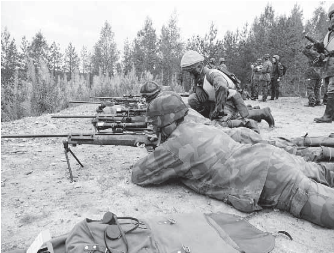
Tarkka-ampujakurssilla suoritetaan vaihtelevia ja vaativia tilanteen mukaisia ammuontoja.

varsin vaativia tilanteenmukaisia ammuontoja. Tänä vuona aseiden peruskohdistus tehtiin perjantaina illalla Kontiorannassa. Kalustona oli tarkka-ampujakivääri TAK-85. Kohdistuksen jälkeen kurssilaiset suuntasivat linja-autolla kohti Sotinpuroa. Kouluttajista koottu valmisteluryhmä asensi ja ohjelmoi perjantapäivän kuluessa maalilaitteet ja valmisteli ampumapaikat - kovassa myrökässä ja vesisaatteessa. Maastontiedustelu oli suoritettu jo edellisenä viikonvaihteena. Illalla pidettiin vielä