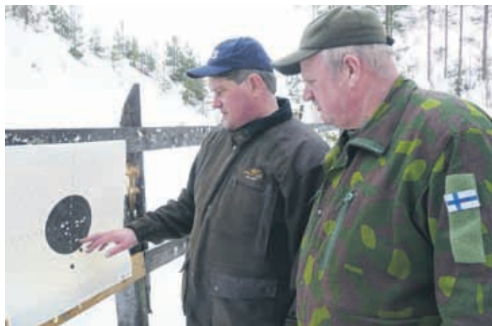
Tuli ja liike on myös Rääkkylän reserviläisten mottona.

luu niille ennakkoluulottomille ”tekijämiehille”, jotka aikanaan saivat tuon radan valmiiksi.