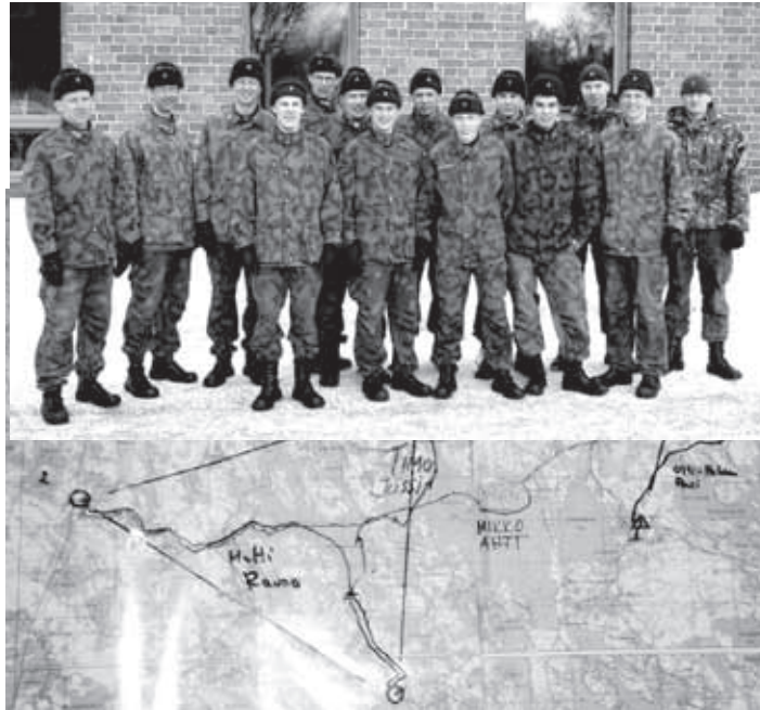
Voittoisalla viestijoukkueella oli jo ennen lähtöä suunnitelmat hyvällä mallilla.

Matkana oli siis 30 kilometriä perinteisellä