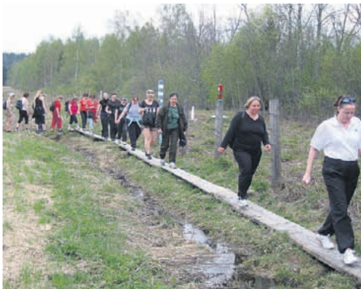
Reserviläisliiton naiset patikkaretkellä rajalinjan vieressä.

- Asemalla on 23 rajakoira, osalla erikoiskoulutus esimer-