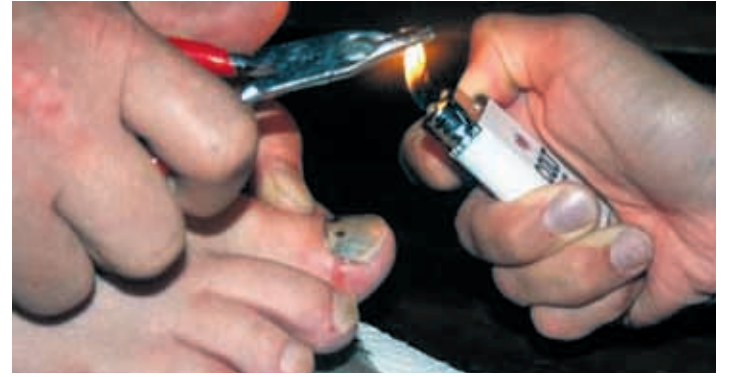
Kynnet mustuvat liian pienissä kengissä marssiessa.

Marssiin valmistautuminen alkaa jalkojen pesulla. Sen jälkeen puhtaisiin jalkoihin voidellaan hankausarkoihin kohtiin Compeed anti-blister stickiä tai vaihtoehtoisesti Skin-Lube voidetta. Nämä aineet vähentävät kitkaa ja näin estävät hiertymien syntymisen. Hyväksi keinoksi olen havainnut vielä viimeiseksi tupsutella jalat talkilla. Sen jälkeen sukat vedetään huolellisesti jalkaan varoen jättämästä rypyn rypyyä. Jos jaloissa havaitsee marssin aikana hankautuneita alueita, kannattaa marssitauoilla kyseisiä kohti sipaista Compeed