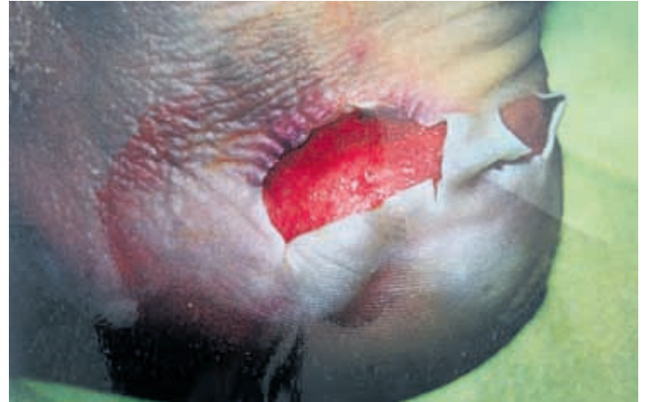
Huono valmistautuminen palkitaan helposti muhkeilla rakoilla.

stickillä. Hyvin istuvia kenkiä ei tarvitse kiristellä jalkaan kovinkaan napakasti. Näin jalalla on tilaa hiukan turvotakin. Ja sitten vain mars matkaan.