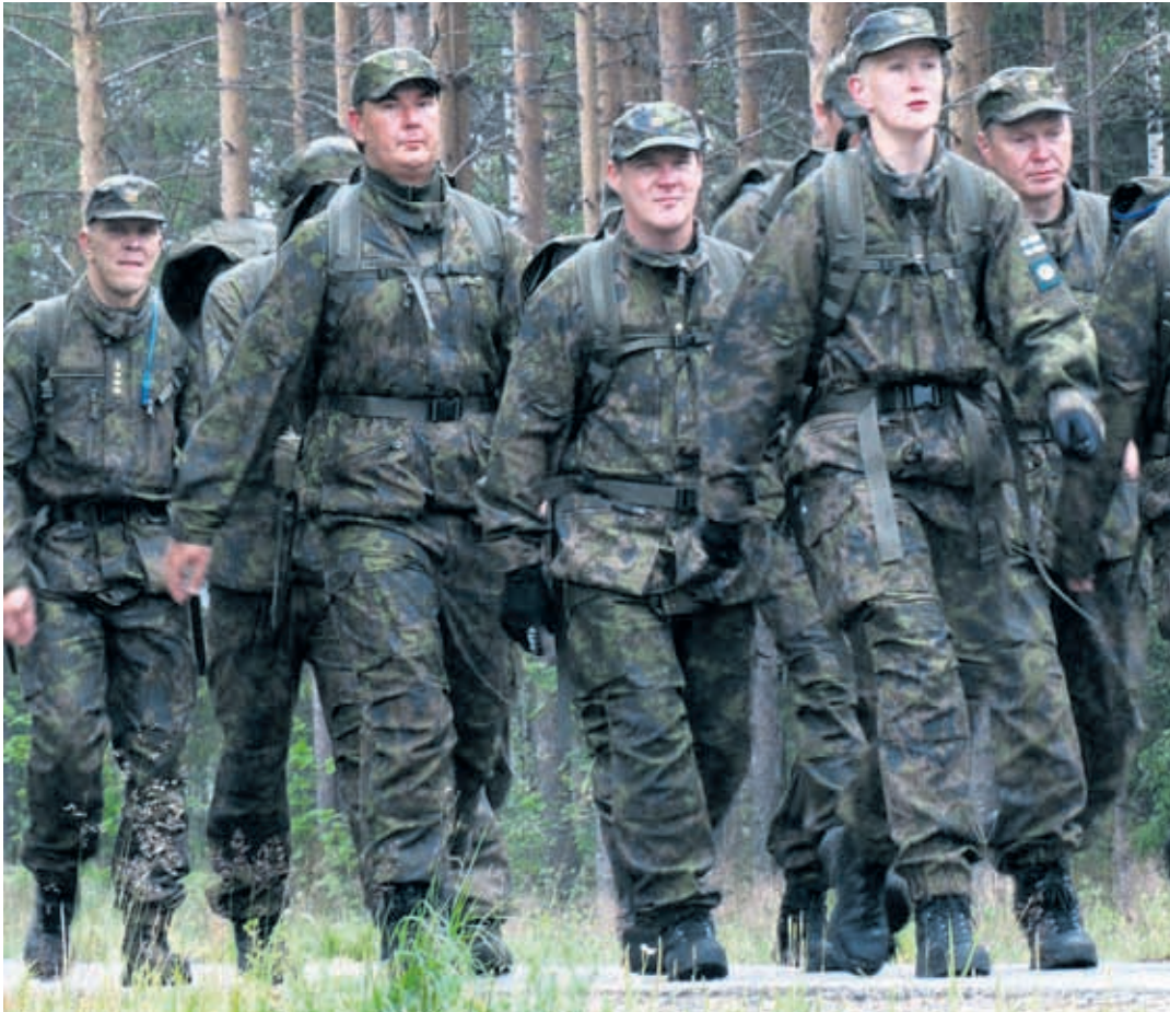
Marssikunto tulee vain marssimalla.