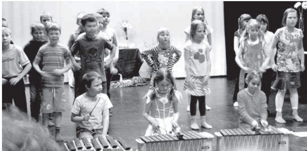
Veteraanijuhlan esiintyjät olivat Rääkkylän nuorisoa.

Talvisodan alkaessa meillä ei ollut uskottavaa ennaltaehkäisykykyä, vaikka sotilaittemme ja koko kansamme taistelulla saavutimme torjuntavoitot, lähes tahdon voimalla. Valitettavasti tappiot olivat raskaat... Koko valtakunnan puolusta-