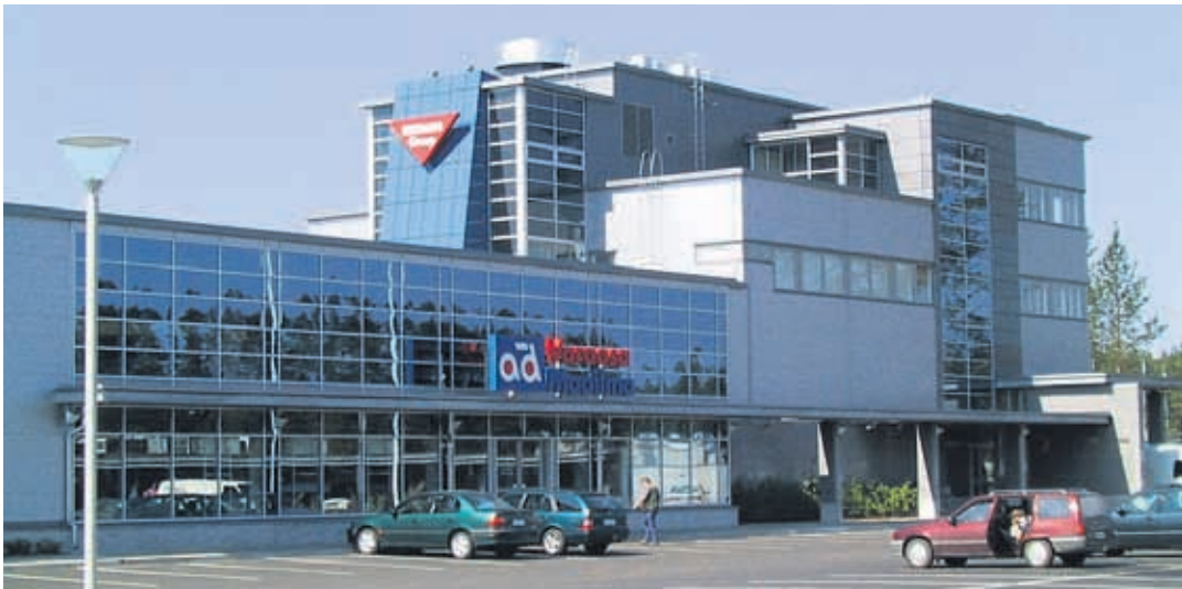
Broman Group Oy:llä on eri puolilla maata 18 Motonetin myymälää ja 13 AD Varaosamaailman myymälää. Joensuun yksikkö sijaitsee Tulliportinkadulla.