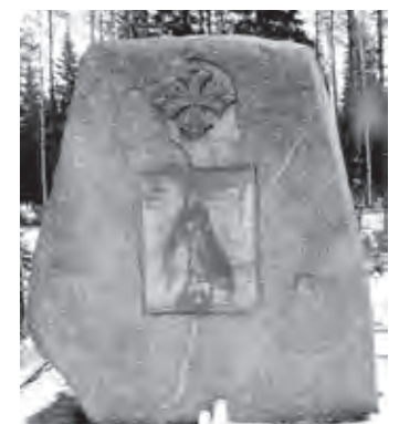
Kiteen Mustalammen tienrasteissa 1992 pystytetty 19. Divisioonan muistomerkki.

ILMARI TURJA: Kumuri, kahden everstin taistelu. Juva 1989