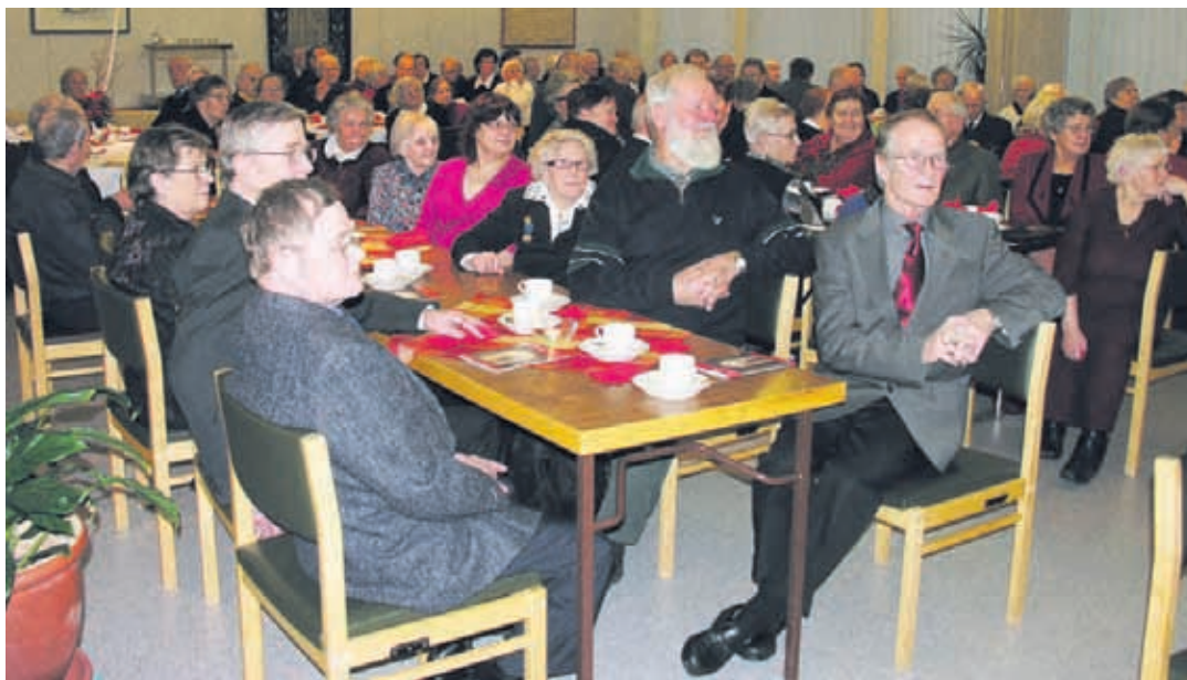
Ilomantsin Puurojuhlaan kokoontui lähes 150 veteraania, sotaorpoa ja heidän läheistään.

- Juhlan järjestäminen ei ole ollut turhaa, jos se tuo joulun varsinaisen ajatuksen mukanaan. Saamme yhdessä iloita joulun