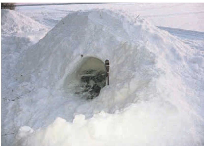
Ohjeet lumikammien tekoon annettiin kurssilaisille alkupuhuttelun yhteydessä, joten lumikammin kaivaminen onnistui nopeimmalta partiolta alle tunnissa.