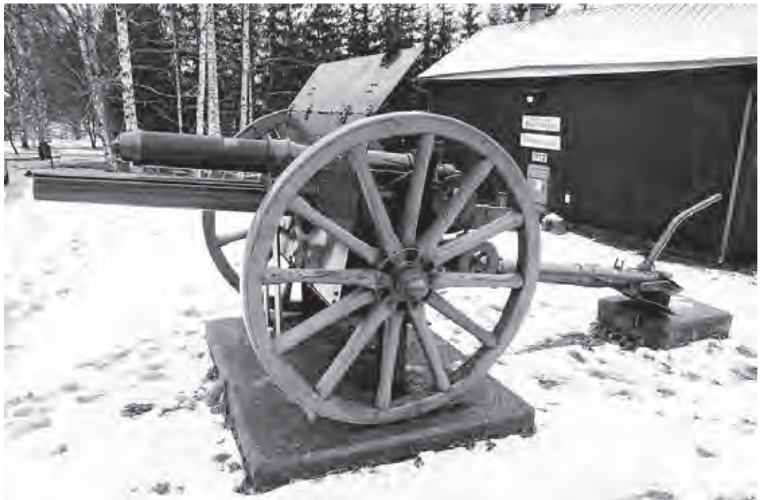
Kiteellä Kotiseutumuseon edustalla olevaa kanuunamallia K75/17 Kenttätykistörykmentti 10. käytti Kiteen taisteluiden aikana tulitoiminnassaan.