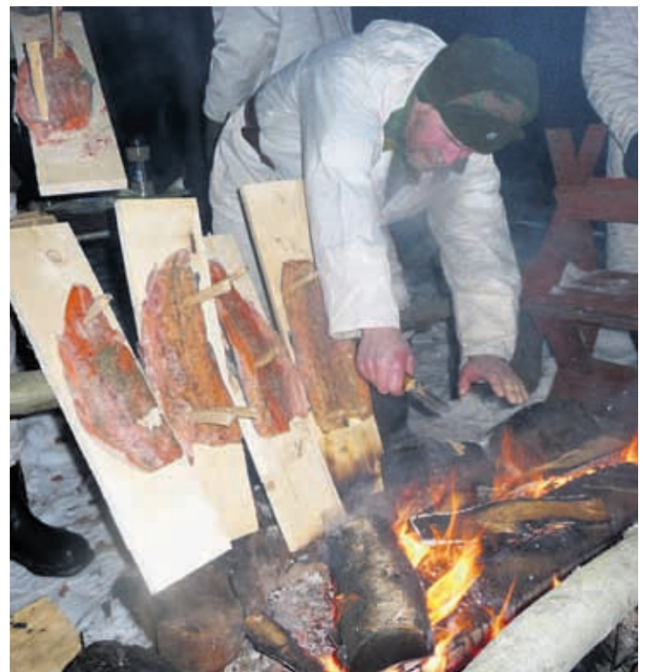
Reissun makoisin harjoitus. Metsä-Kaiskussa reserviläiset saivat valmistaa kalaa loimuttamalla.