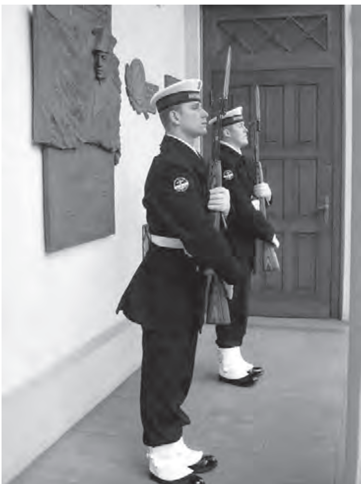
Puolalaiset merikadetit vartiassa Merivoimien esikunnan portilla.

roopan unionin mantereen itäsiemppään pisteeseen rajaamalla itäpisteen katselupaikka rajavyöhykkeen ulkopuolelle. Samalla ulkopuolelle rajattiin itäpisteen lähellä oleva Luppotupa ja sinne johtava retkeilyreitti. Muutokset vähentävät rajavyöhykelupahallintoon sitoutunutta aikaa. Rajavyöhykemerkinntä maastoon tehdään vuoden 2010 alkuun mennessä.