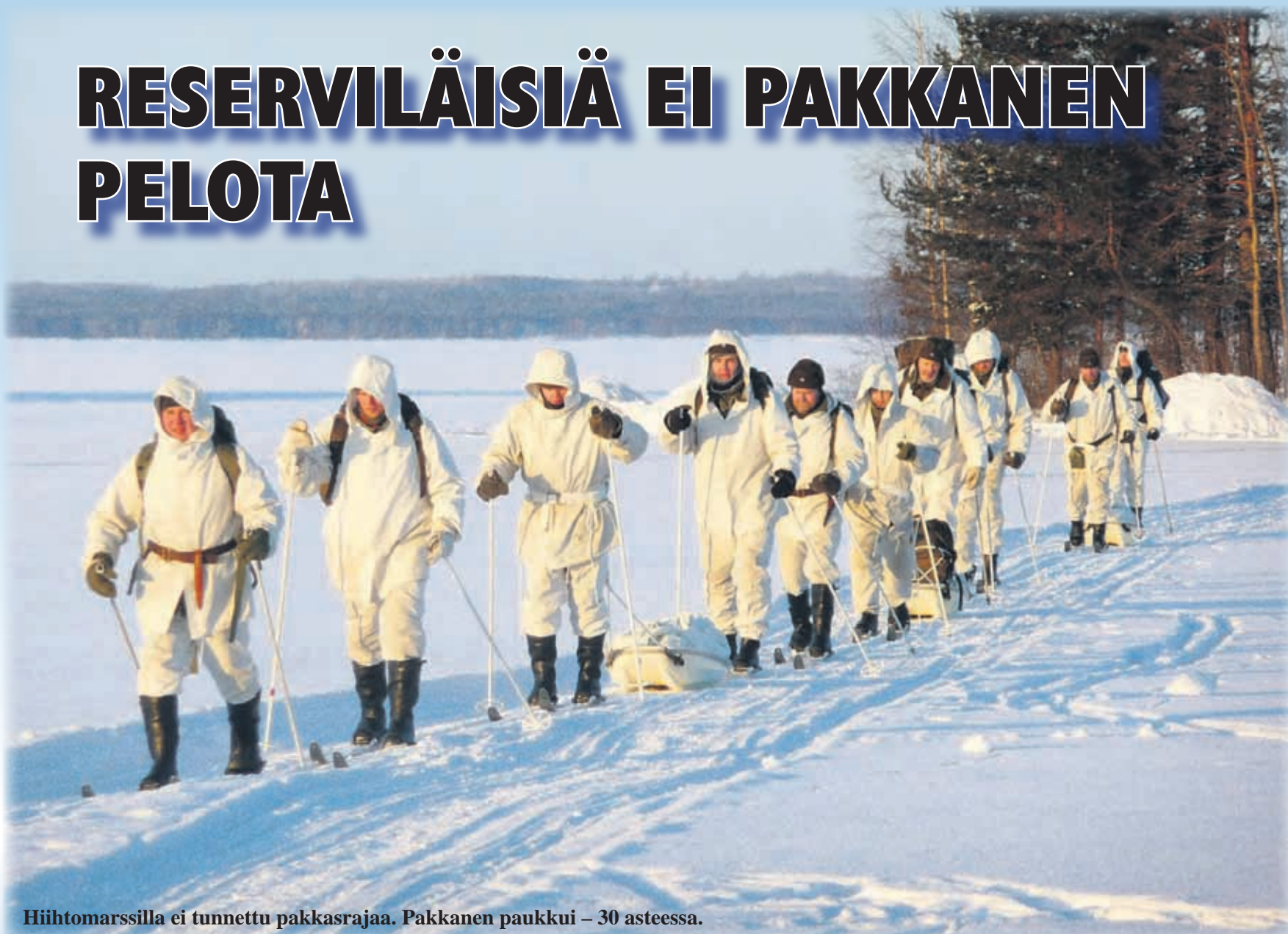
Hiihtomarssilla ei tunnettu pakkasrajaa. Pakkanen paukkui – 30 asteessa.