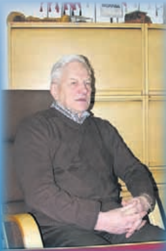
Yritysesittelysarjan avaa Lehtosen Liikenne Oy.