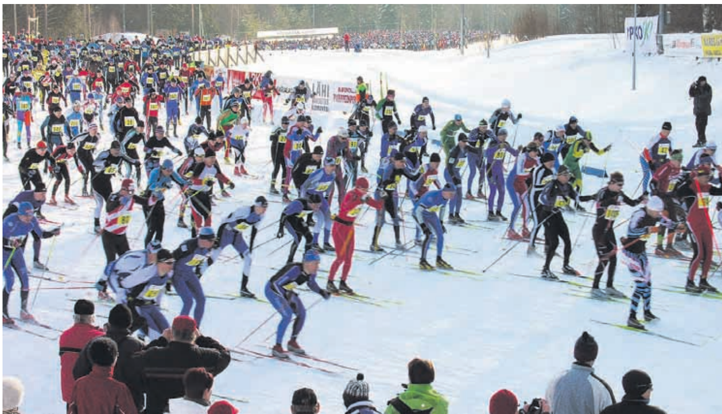
Pogostan Hiihdon tavaramerkkejä ovat hulpeat harjumaiset, hiihdeävät ja kestävät ladut, rutinoitunut organisaatio sekä iloinen ilmapiiri. Lauantain perinteiselle lenkille sääntää yleensä 1 300 – 1 500 hiihtäjää.