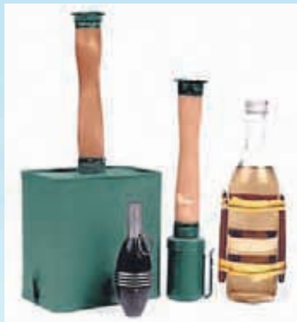
Talvisodan puolustuskalustoa: Kasapanos, käsikranaatit ja polttopullo olivat tärkeitä aseita vihollista vastaan.