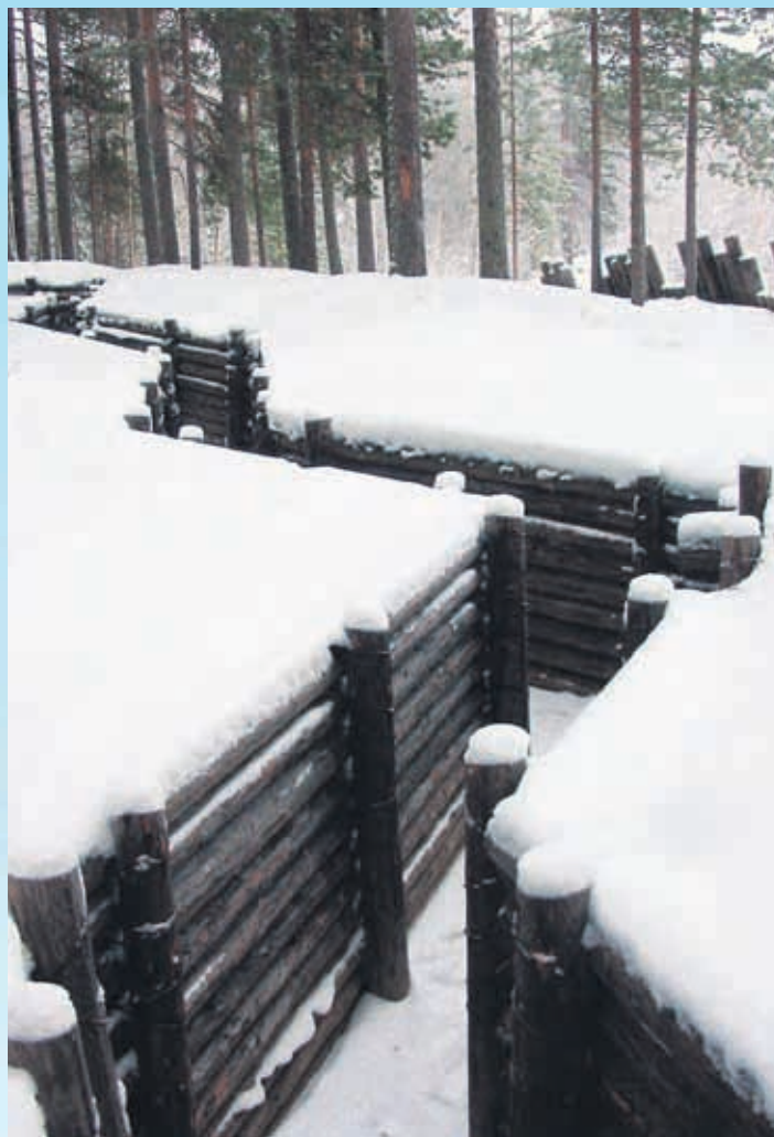
Viisikon puolustuslinja talvella 2009. Taustalla osa rinteeseen rakennettua puista panssariestettä.

Alla kivisiä panssariesteitä Lieksaan johtavan tien varressa.