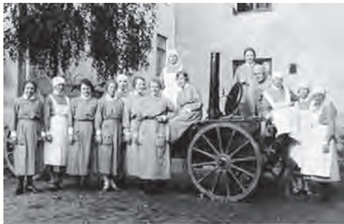
Lotat vapauttivat noin 100.000 miestä rintamalle.