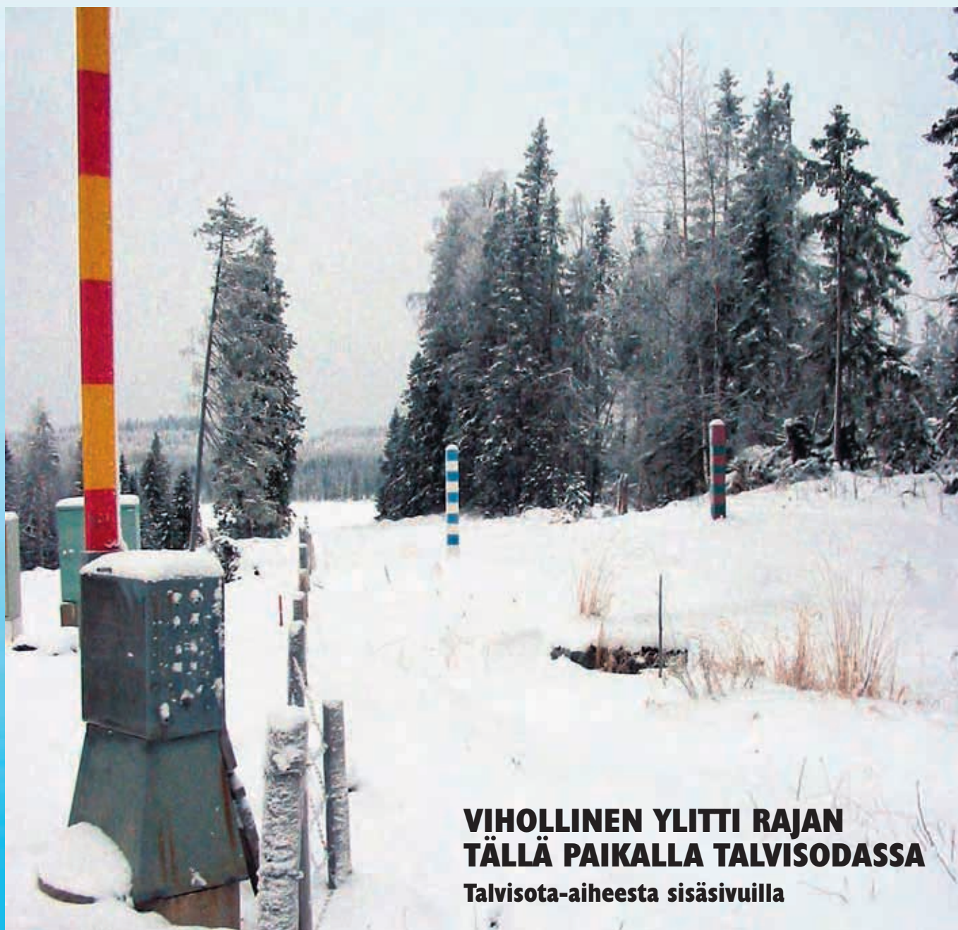
VIHOLLINEN YLITTI RAJAN TÄLLÄ PAIKALLA TALVISODASSA Talvisota-aiheesta sisäsivuilla

Hyökkääjän tavoitteena oli lyödä Suomen armeija ja saattaa Suomessa voimaan neuvostojärjestelmä. Talvisota päättyi 13.3.1940 katkeraan rauhaan, jonka seurauksena maamme menetti laajoja alueita ja sadattuhannet karjalaiset joutuivat jättämään kotinsa.