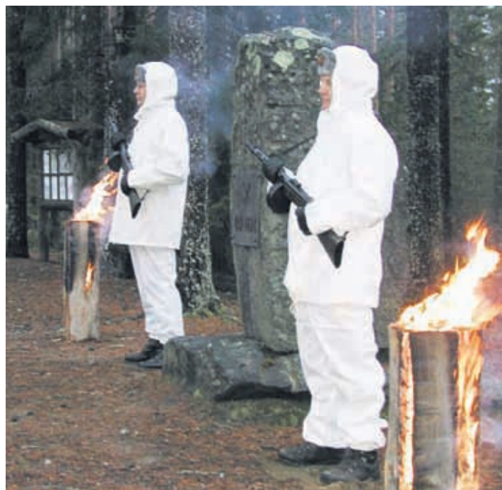
Muistotulet ja kunniavartio Viisikon muistomerkillä.