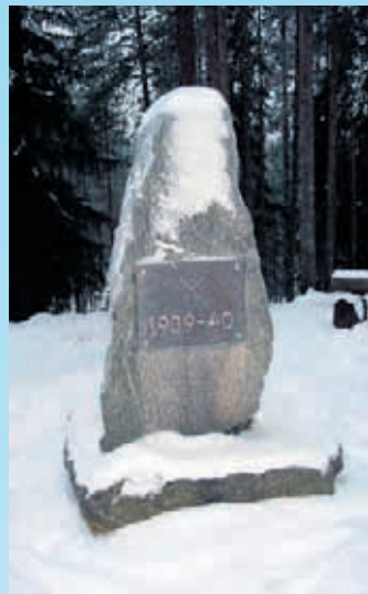
Talvisodan Viisikon linjan taistelujen muistomerkki Lieksan Hattuvaarassa. Vihollisen hyökkäys pysähtyi lopullisesti tähän linjaan.