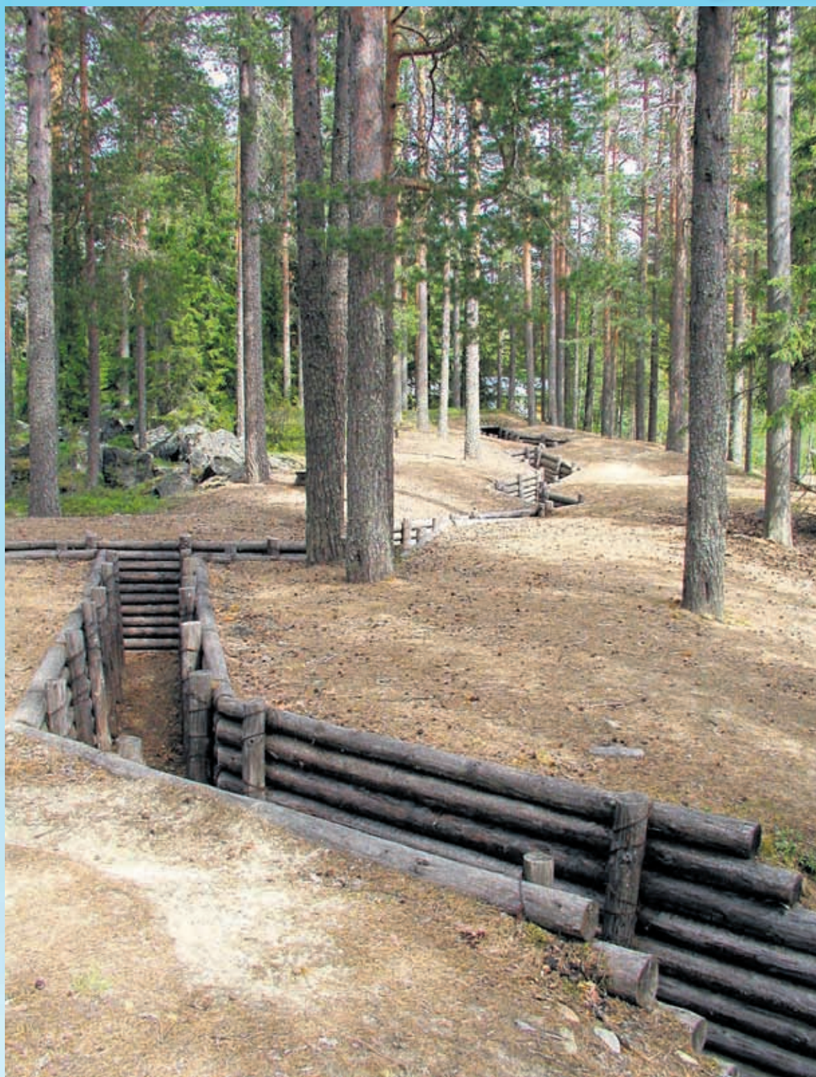
Vihollisen pääsy Lieksaan ja Nurmekseen pysäytettiin Viisikon puolustusasemiin tällä paikalla. Kohteen juoksuhautoja ja panssariesteitä on entisöity jälkipolvien nähtäväksi.