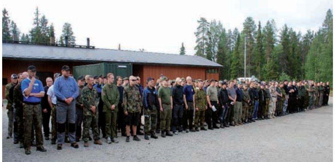
Kilpailijoiden komeaa rivistöä avajaisissa. Enimmillään alueella oli noin 250 henkeä.

Suunnittelutyö oli onnistunut ja niinpä kilpailun johtohenkilöstö totesi tyytyväisenä, että