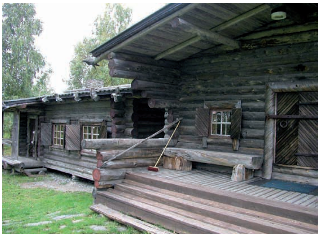
Raappanan maja Ilomantsin Parppeinvaaralla oli veteraaniviikonlopun tutustumiskohteita.

Hyökkääjälle maasto tarjosi mahdollisuuden panssarivaunujen massakäyttöön. Puna-armeijan tavoitteena oli päästä täällä Lappeenranta - Imatra tasalle suomalaisten joukkojen selkäpuolelle. Taisteluissa suomalaiset saivat kuitenkin yllätyksenä puna-armeijan takaisin Portinhoikasta, mutta voimat eivät riittäneet pussittamiseen. Rintamaa oli lopulta suoristettava. Talin 11 vuorokautta kestäneet taistelut olivat Pohjoismaiden suurimmat, päättyen 30.6.1944. Tali - Ihantalan taisteluissa kaatui tuhansia vihollisen sotilaita. Tykistön, ilmavoimien, panssaritorjunta-aseiden ja jalkaväen tehokas toiminta sai aikaan "Ihantalan ihmeen", johon vihollisen hyökkäys lopullisesti pysähtyi 12.7.1944.