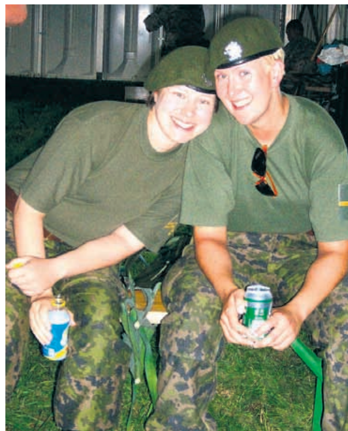
Väsynyt, mutta onnellinen.