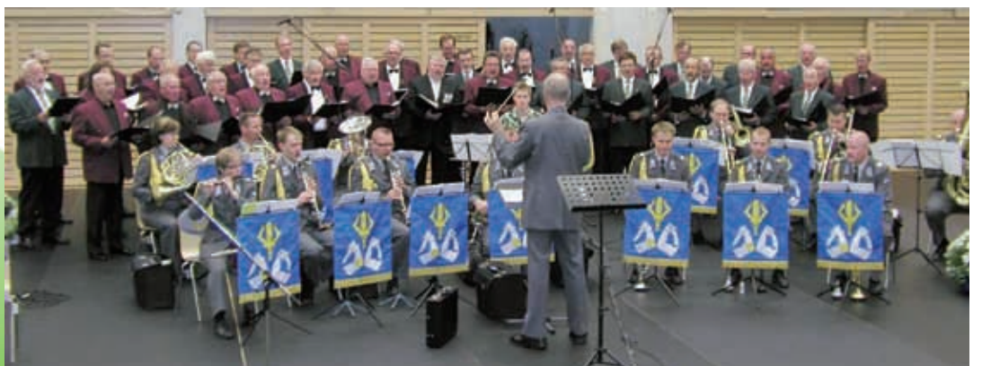
Suuri mieskuoro (Enon Mieslaulajat, Ilomantsin Mieslaulajat ja Mieskuoro Kontiaiset) esittivät Karjalan Sotilassoittokunnan säestyksellä tunnettuja marssilauluja.