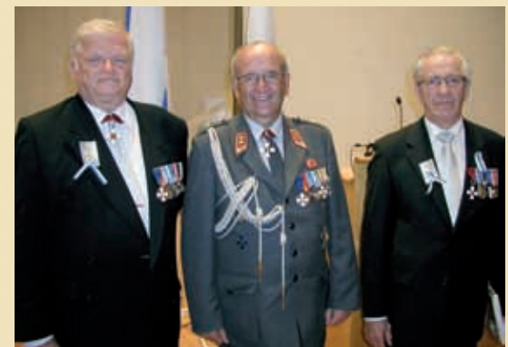
Vapaussodan Perinneliiton kesäpäivät Kontiorannassa ja Joensuussa 13-14.6.2009