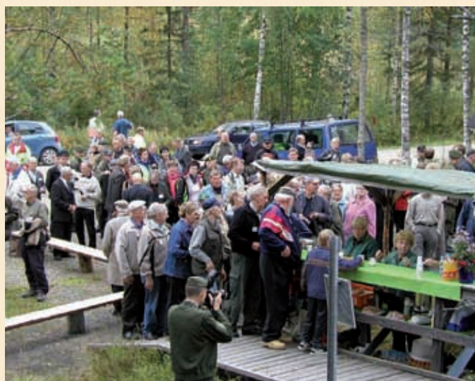
Öykkäsenvaaran taistelupaikalla oli tarjolla kahvia ja munkkeja.