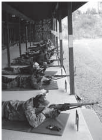
Kontiorannassa 4.6. pidetyn perinneasekilpailun osanottajat ryhmäkuvassa ja ampumassa.