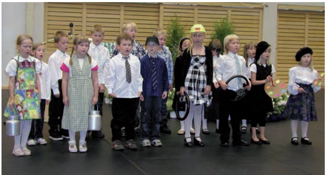
Lapset esittivät pääjuhlassa hauskan laululeikin "mitä minusta tulee isona".