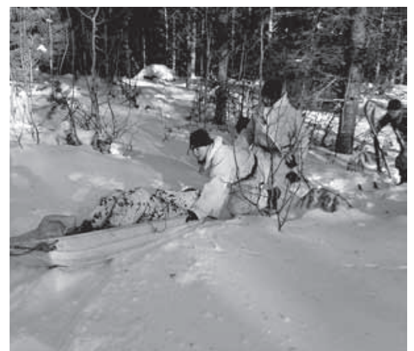
Haavoittunutta kuljetetaan ahkiassa. Tässä mukana myös naisreserviläisiä.

Seuraavaa, eli Umpihanki 2010 -jotosta varten suoritettiin Sotinpuron maisemissa kesän aikana valmistelevia maastotiedusteluja. Juha-Matti Junkkari