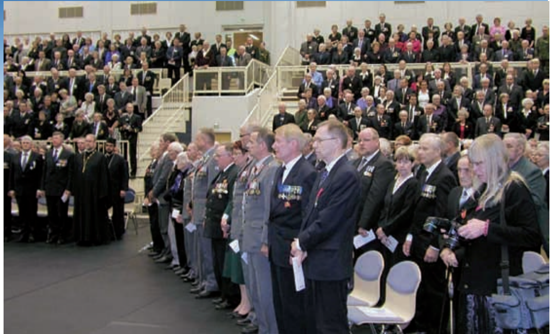
Liikuntasali oli käydä pieneksi, niin suosittu oli 14.D:n perinneyhdistyksen, Ilomantsin kunnan ja Karjalan Poikien Killan järjestämä pääjuhla.