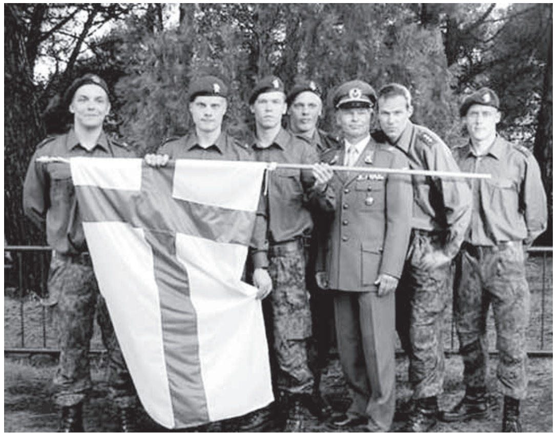
Suomen kisajoukkue Italian Viterbossa.