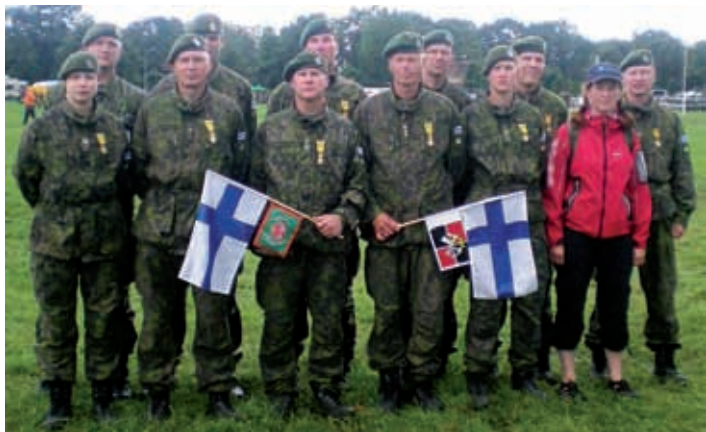
Team MPK North Karelia 2009 -joukkue

Ensimmäinen Vierdaagse marssittiin marssitaidon ja -kunnan osoituksena syyskuussa 1909. Tuolloin 296 sotilasta ja 10 siviiliä marssi neljän päivän aikana 140 km. Marssi on säilyttänyt suosionsa raskaudestaan huolimatta. Nykypäivän Vierdaagse on paisunut megaluokan tapahtumaksi, missä kävelijöitä on yhteensä 45 000 ja katselijoita puolitoina miljoonaa.