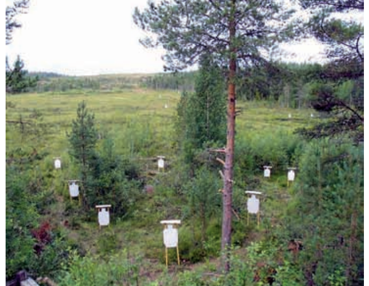
Sovelletun reserviläisammunnan rata Sotinpuron maisemissa.

aikataulut pitivät ja kilpailu eteni suunnitelmien mukaan.