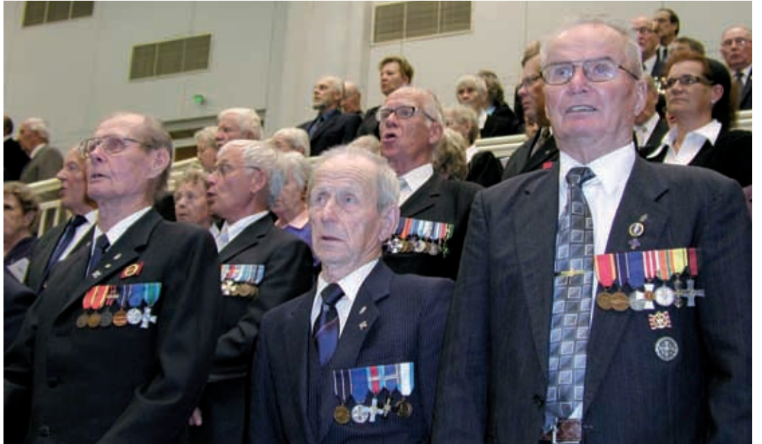
14. Divisioonan veteraanit jaksavat edelleen käydä perinnepäivillä.