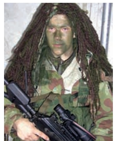
Tarkka-ampuja ja Rölli puku oli esillä Ilomantsin näyttelyssä.