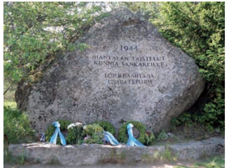
Muistomerkki Ihantalan taisteluista. Muistomerkin asettivat Ryhmä Vihman joukko-osastot JR12, JR35, KTR14, Er.P16 (3.7.1999)

Pietarissa kohteenamme oli asehistoriallinen museo, Arsenaaali. Esillä oli kaikenlaista