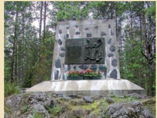
Oinassalmen taistelujen muistomerkki.