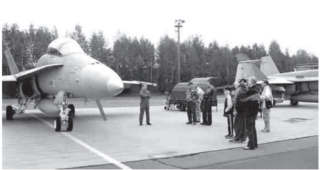
Viekin Reserviläisiä retkellä Karjalan Lennostoon Rissalaan. Menossa koneen esittely. Taustalla Hornet-rivistöä.