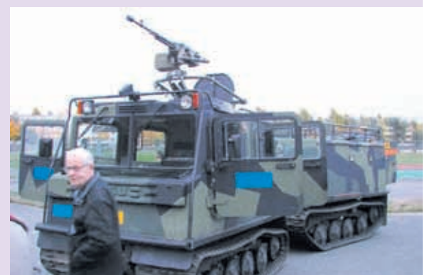
Puolustusvoimat 90 -vuotta toi Areenan edustalle myös näyttävän valikoiman armeijan kalustoa.