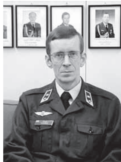
Prikaatikenraali Tuunanen aloittaa MPK:n toiminnanjohtajana 1.1.2009