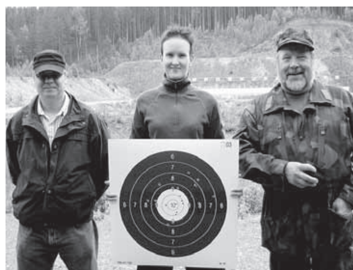
Joensuun Reserviupseerien joukkue.