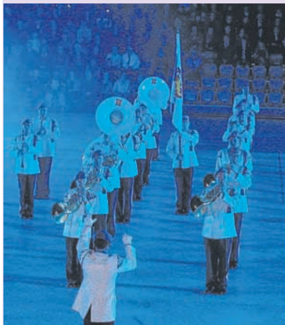
Kaartin Soittokunta on toiminut jo vuodesta 1819. Suomen vanhin ammattisoittokunta on myös säännöllisesti konsertoiva sinfoninen puhallinorkesteri.