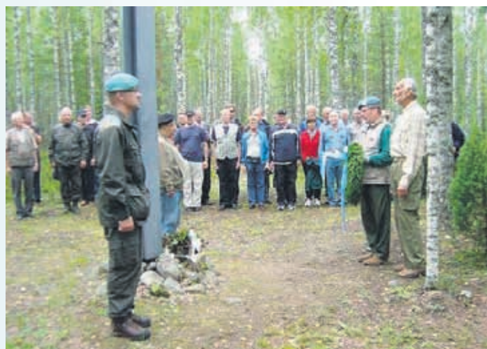
Kollaa, seppeleen lasku kenttähautausmaalla, punaisentalonmäellä.