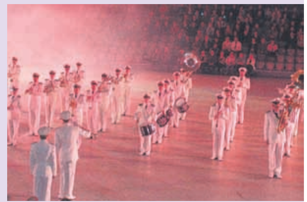
Laivaston Soittokunnan esitys sisälsi sekä laulua että kuviomarssia.