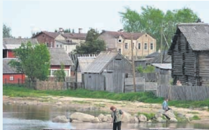
Säämäjärven ranta Jessoilassa.

Veteraanityö ja koulutus ensi vuoden teemat Liiton ensi vuoden tärkein teema on veteraanityö ja koulutus. ”Päivystävä puhelimen” toimintaa tullaan myös laajentamaan