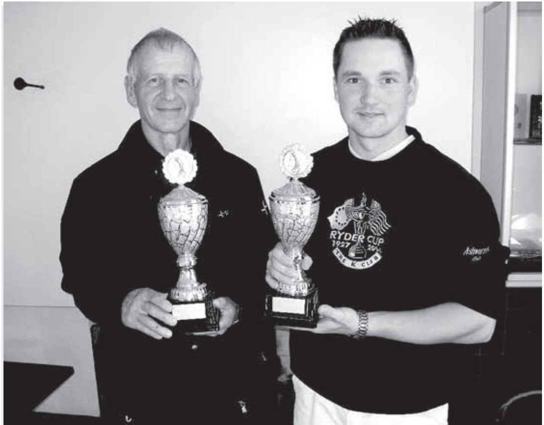
Sarjojensa mestarit Outokummun reserviläiskerhojen v. 2003 lahjoittamat kiertopalkinnot hyppysissään.

Teksti: Reijo Kohonen