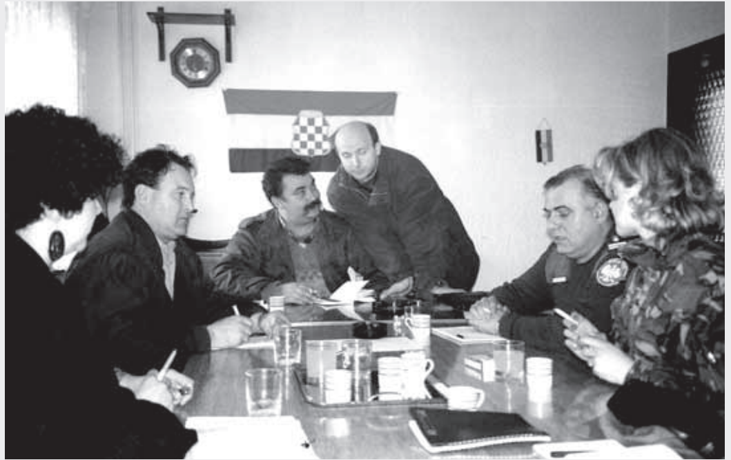
IFOR-operaatiossa Pohjoismais-puolalaisen prikaatin tiedotusupseerit tapasivat säännöllisesti paikallisten osapuolten toimittajia eri puolilla Bosnian aseepolinjaa. Tässä kokouksessa oli mukana myös prikaatin esikunnan siviili-sotilas-yhteistoimintaosaston päällikkö, puolalainen everstiluutnantti. Häntä avusti tiedotusupseerien maastopukuinen tulkki.

Yhteistyötahto ja luottamus – luottamus sekä organisaatioiden että henkilöiden tasolla – ovat ratkaisevan tärkeitä rauhanturvatyössä. Jonkinlainen erityisoivallus tästä tuli minulle varhain yhtenä aamuna Slovenian ja Itävallan rajalla, eräällä Itävallan-puoleisella