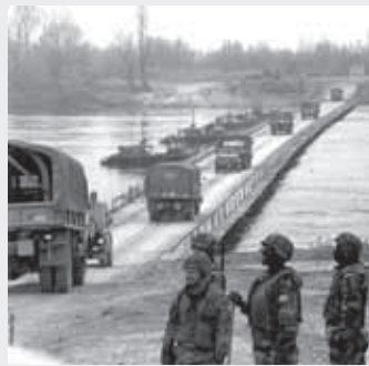
Näkymä voisi olla vaikka toisesta maailmansodasta? Se on kuitenkin alkuvuodesta 1996, entisestä Jugoslaviasta. Muuan Sava-joen yli johtanut silta oli sodassa tuhoutunut, ja yhdysvaltalaispioneerit rakensivat ponttonisillan tilalle, että monikansalliset NATO-joukot saivat kulkuyhteyden Kroatista Bosniaan.