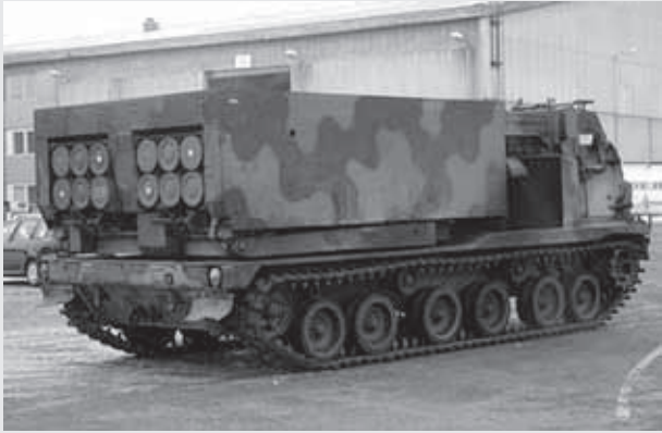
Hollannista tammikuussa 2006 käytettynä hankittuun amerikkalaiseen MLRS-järjestelmään kuuluu 22 tela-alustaista heitintä sekä erilaisia maasto-, kuorma- ja erikoisajoneuvoja noin sata kappaletta.