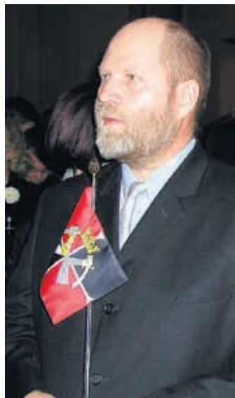
Ohjaaja Markku Pölönen.