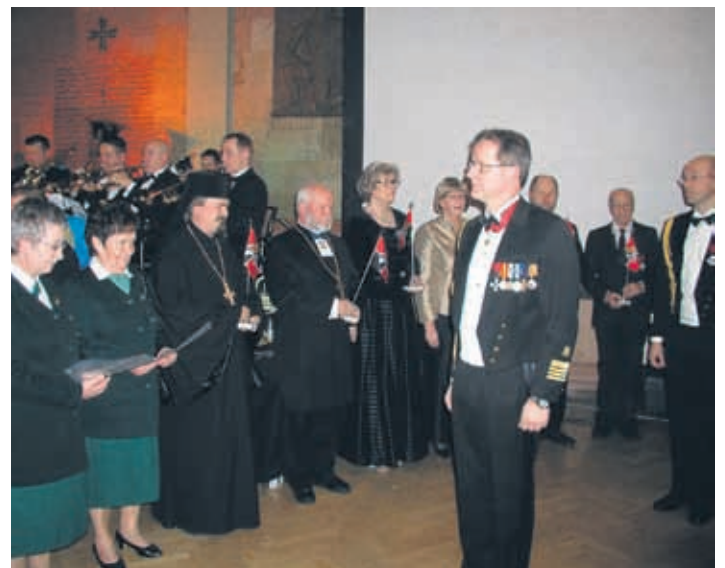
Palkitut ja palkintojen luovuttajat yhteisessä kuvassa.

- Oli mieluisaa saada tällainen tilaustyö naapurista. Samalla oli loistava tilaisuus tutustua asevelvollisten koulutukseen