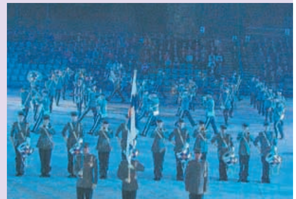
Puolustusvoimien Varusmiessoittokunta esiintyi aseryhmän kanssa ja sai voimakkaimmat suosionosoitukset taidokkuudellaan ja täsmällisyydellään. Soittokunnan kuviomarssiesitykset ovat saaneet tunnustusta myös kansainvälisiltä tahoilta.