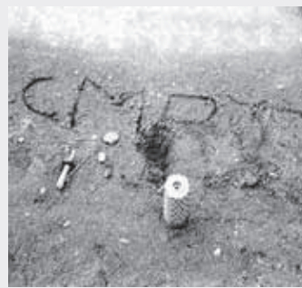
”Smrt” – ”kuolema”. Doboyn kaupungin laitamilla Bosniasa joku oli tuonut putkimiinan keskelle tietä – ehkä nimenomaisesti rauhanturvajoukkojen löydettäväksi. Tämä ei ollut ansa; tien pintaan oli huolehtivasti kirjoitettu varoituskin. Alun perin syytynä oli miinassa kiinni, mutta kuva on otettu vasta kun norjalainen miinanraivaaja oli ensin käynyt tutkimaan ja purkamassa laitteen.

raja-asemalla. Seisoimme siellä, muuan korkea-arvoinen poliisiupseeri Slovenian sisäministeriöstä ja minä.