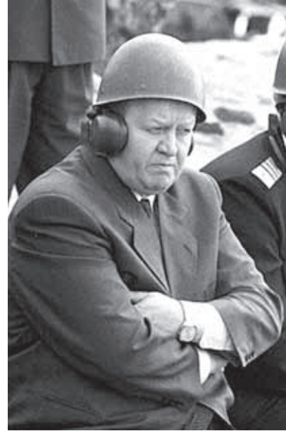
Presidentti Martti Ahtisaari , vuoden 2008 Nobelin rauhanpalkinnon saaja.

Suomi on ilmoittanut virallisesti jäävänsä rypäleaseet kieltävän sopimuksen ulkopuolelle. Päätöstä perustellaan sillä, että maamiinoista luopumisen jälkeen mainittu asejärjestelmä on maamme puolustuksen kannalta välttämätön.