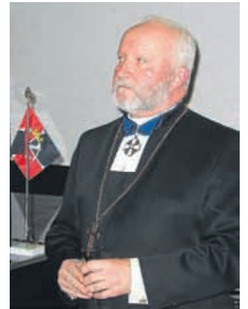
Piispa Wille Riekkinen.

- Toivotan prikaatin hengelliselle työlle menestystä jatkossakin. Toivotan myös kaikille teille täällä juhlassa oleville voimia ja viisautta elämäänne, piispa totesi prikaatin juhlassa.