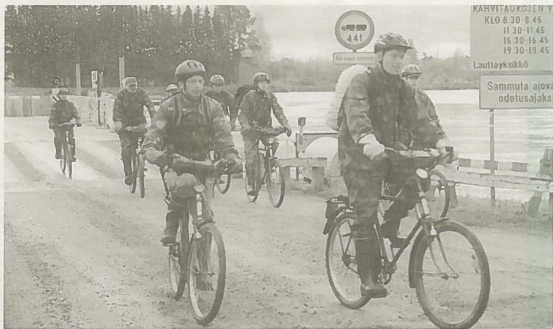
Osastot ylittivät vesistön lossilla sulassa sovussa muun liikenteen seassa.