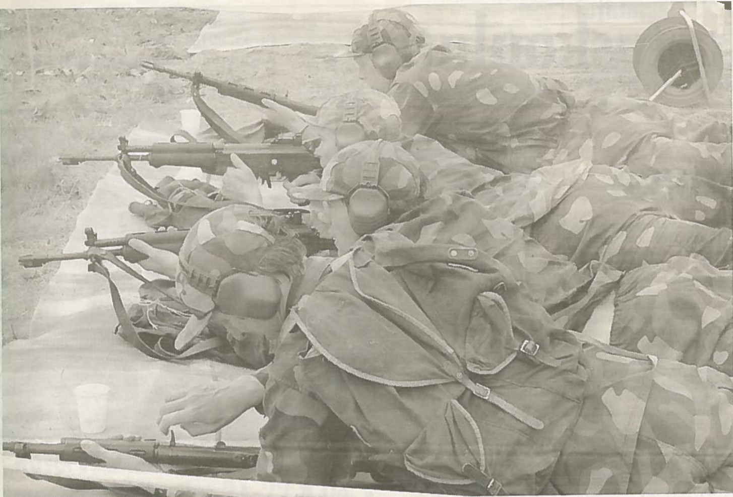
Partion päät painuivat amunnassa hyvin sujuneen kilpailun loppuksi.