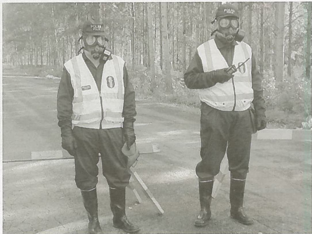
Täydennyspoliisit sulkevat tien Kaasilan kloorionnettomuuspaikalle