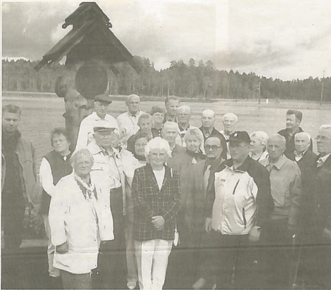
Retken osanottajan Euroopan Unionin itäisimmän pisteen luona.

Muutokset ovat sitä kokoluokkaa, että asioihin on syytä perehtyä ja ottaa kantaa myös piiri- ja yhdistystasolla. Osallistukaa kokouksiin reserviläiset!