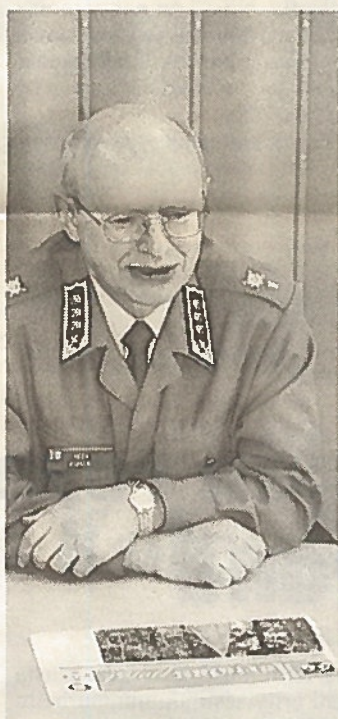
Kenraaliluutnantti Kämäri kehottaa reserviläisiä noudattamaan palvelukseenastumiskutsua.

Komentajan näkemyksen mukaan ei voi kuvitella koulutusta mielekkääksi ja harjoituksiin uhrattuja voimavaroja tuottaviksi, jos joukosta puuttuu esimerkiksi 40 prosenttia henkilöstöstä.