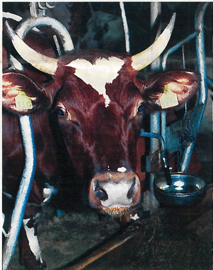
Miten minun käy, jos laskeumat yllättävät?