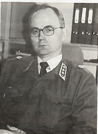
Eversti Asko Kohvakka.

- Reservi on keskeinen osa puolustusjärjestelmäämme. Olemme erittäin vakavalla mielellä, kun reserviläisten kanssa töitä teemme. Kutsun kuullessa toivotamme lämpimästi tervetulleeksi joukkoon. Toivottavasti myös mahdollisimman