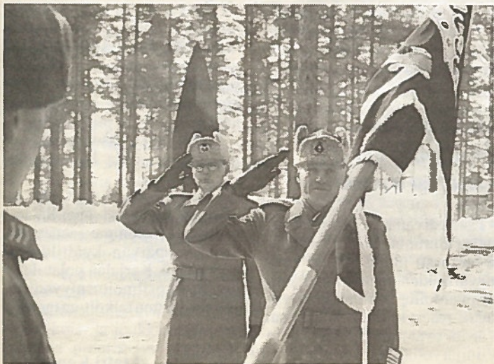
Komentajat tarkastivat joukkonsa.

Prikaatin tukijoukot saivat myös runsaat kiitokset päivittäin ja vuosien kuluessa tehdystä työstä.