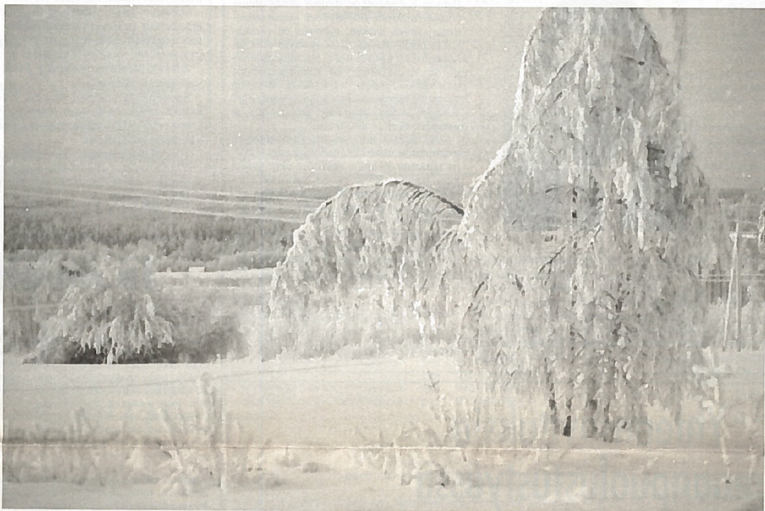
Kuningas Talvi on tänä talvena ollut parhaimmillaan. Neljä vuodenaikaa on meille rikkaus, jota on harvoilla kansakunnilla. Pitäköön sekin itsetuntoamme yllä.