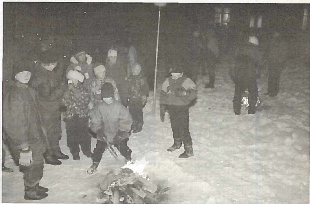
Reserviläisten joulutulilla Juuan Riihipuistossa oli mukana paljon nuoria. Partiolaisten joulupukki ja tontut jakoivat karkkeja.

Reserviläisurheiluliiton ilma-aseampujat