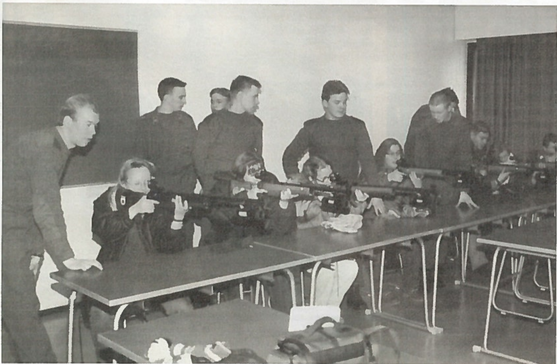
Abitytöt ampumassa innokkaiden ohjaajien opastaessa.