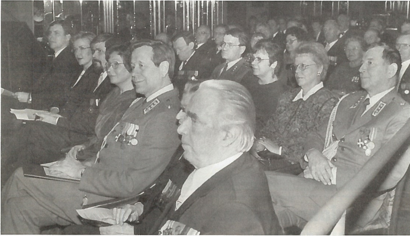
Juhlassa oli varsin arvovaltainen ja runsaslukuinen yleisö.

Piirin alkuaikojen toimintaa sävytti legendaarisen puheenjohtajan Arvi A. Lallukan persoonallinen ote ja vahva maanpuolustustahto. Hän oli erikoisen innostunut valistus- ja elokuvatoiminnasta. On laskettu, että 1960-luvun loppuun mennessä piirin alueella pidettiin lähes 25 000 tilaisuutta, joissa oli mukana yhteensä 1,5 miljoonaa henkilöä koululaiset