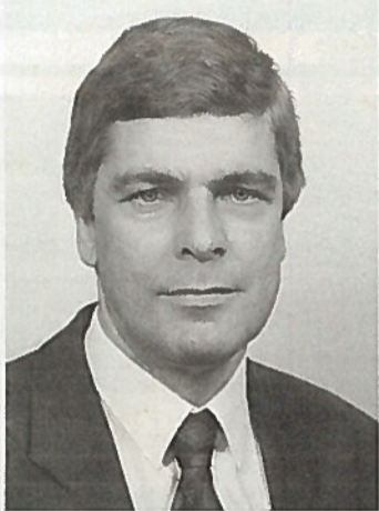
Muutamissa puheenvuoroissa korostettiin erityisesti MPK ry:n merkitystä järjestöjen yhteistoiminta-alueella.