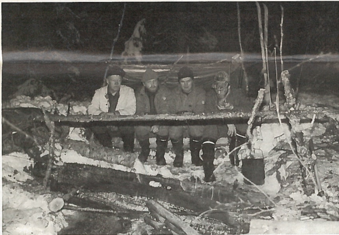
Rakotuli, majoite ja kiehumassa oleva römpä sekä nuotiojutut kuuluvat asiaan.

Nurmekselaiset järjestäjät ovat vuosien varrella keksineet kaikenlaisia mukavaa yllätystä muille osanottajille. Yleensä jokaisella miehellä on omat eväät mukana, mutta eräänkin kerran järjestäjät olivat luvanneet hoitaa muonituksen. Hämmästyks oli ollut miesten joukos-