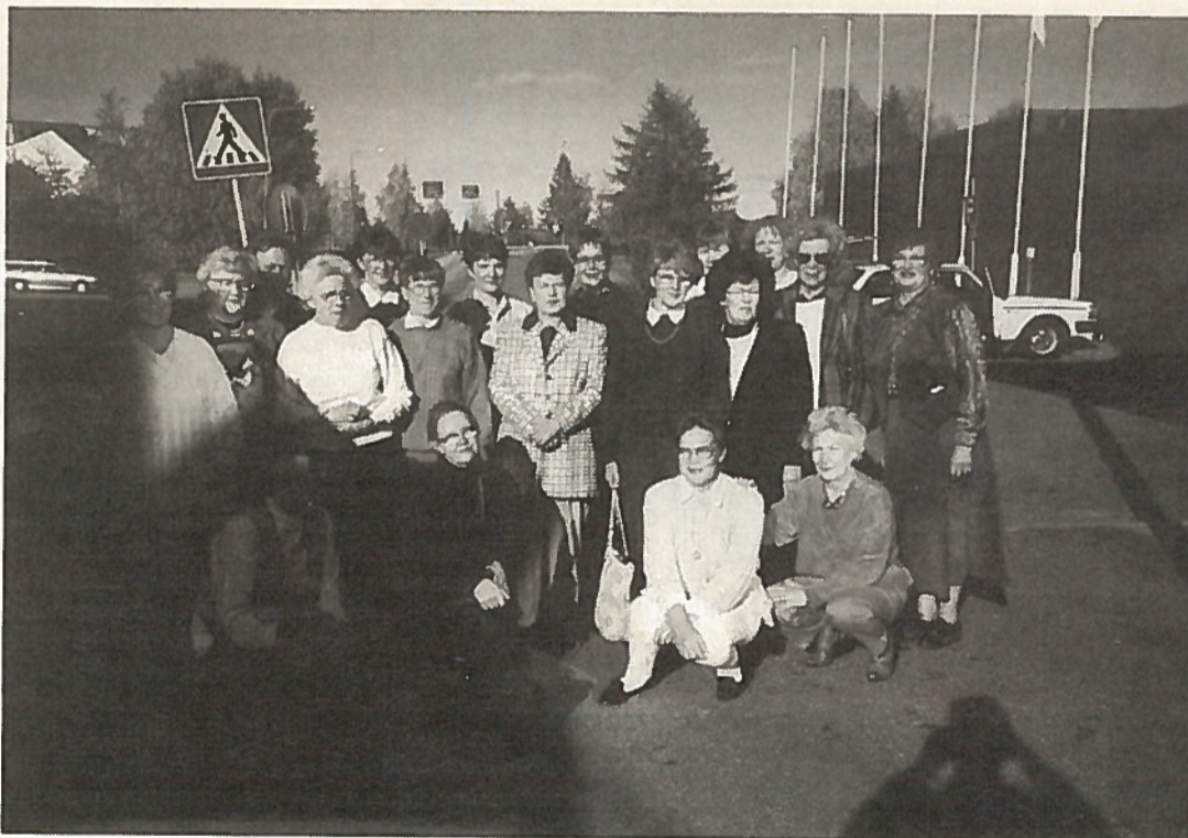
Pohjoiskarjalaisia osanottajia syksyn liittopäivillä.

Liiton ensi vuoden toimintateeman on "Maanpuolustustyötä yhdessä", mikä viittaa osaltaan toiminnan laajentamiseen. Lokakuussa kokoontuvat kolmen liiton - Suomen Reservin Aliupseerien Naisten liiton, Sotilaskotiyhdistyksen sekä Suomen Reservin Upseerien Naisten liiton - hallitukset