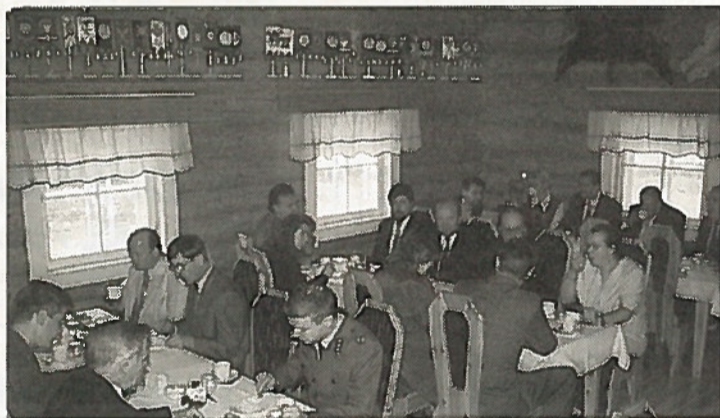
Yhdistyksen juhlan puitteet olivat mitä mahtavimmat.

Teksti: Lauri Holopainen