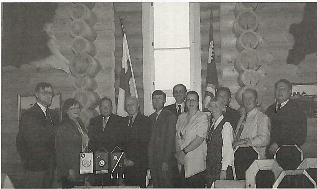
Tästä on hyvä jatkaa: entisiä ja uusia puheenjohtajia ja hallituksen jäseniä.

Toiminta on ollut vilkkainta 1960-luvulla. Esimerkiksi vuoden 1966 toimintakertomuksesta ilmenee, että yhdistys on järjestänyt peräti 130 filmi- ja valistustilaisuutta, joihin on osallistunut 6.535 henkeä. Piirin toimintakilpailuissa yhdistys on ollut kolmas. Puuttuvien asiakirjojen vuoksi selkeän kuvan muodostaminen koko toimintajalalta on mahdotonta; käytettävissä on vain satunnaisia pöytäkirjoja ja toimintakertomuksia. Viime vuosikymmenellä yhdistyksen toiminta on ajoittain ollut lähes pysähdyksissä.