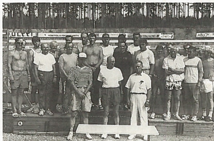
Puolet kilpailijoista pääsi palkinnoille. Edessä järjestäjien edustajia.