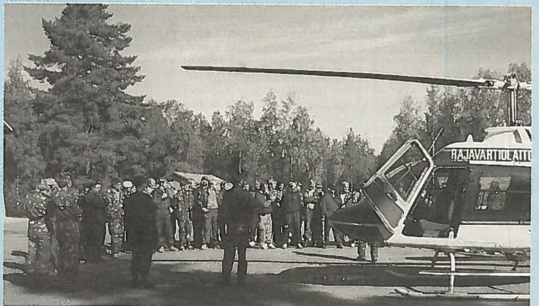
Tohmajärvellä päästiin tutustumaan rajavartiolaitoksen helikopteriin.