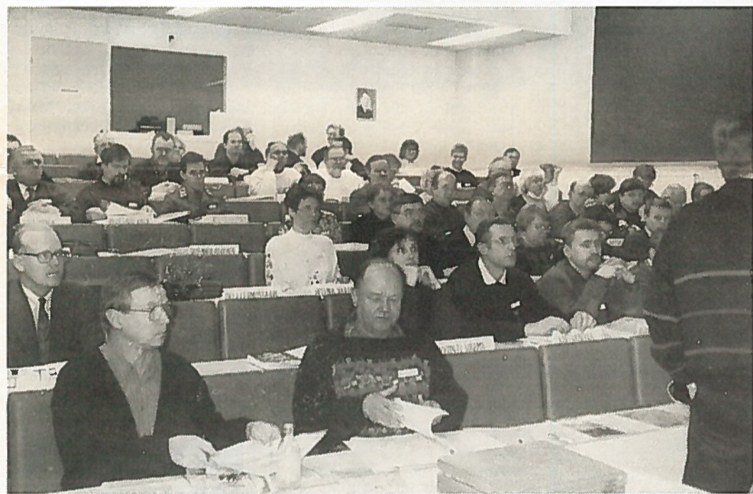
Kurssitoiminta on nykyisin reserviläisliitoissa varsin runsasta. Kuvassa on Onttolassa pidetyn erikoiskurssin osanottajia viime keväänä.

Reserviläisurheiluliitto on yhdistyksen jäsenelle melko kaukainen järjestö. Kilpailutoimintaan valtakunnan tasolla osallistuneet ovat nimen nähneet ja saaneet liiton palkintomitalin.