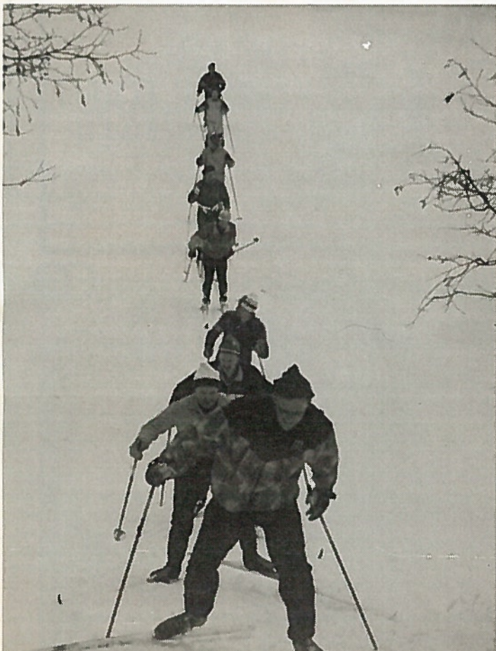
Jotokselaiset Jänisjoen ylityksessä.