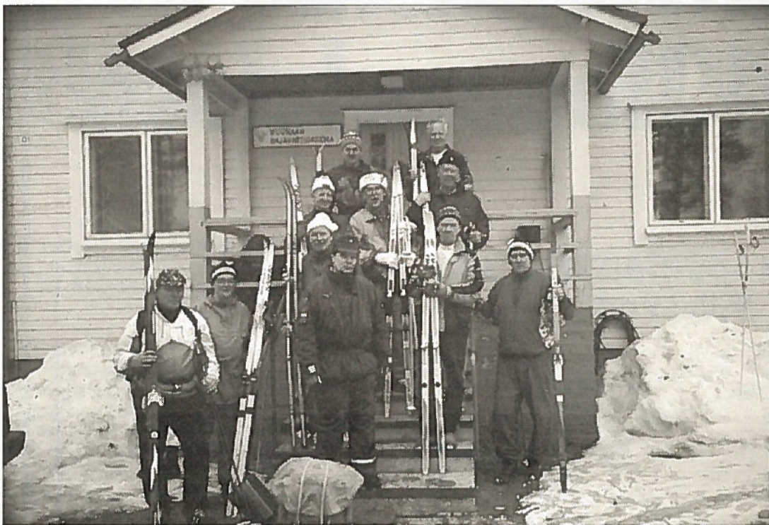
Vaelluksen loppuun suorittaneet nurmeslaiset, joensuulaiset ja valtimolaiset.

Pyörölammen kuvetta pitkin kii- pesimme leveää metsäautotietä Ki- vivaaralle 45 metriä kahden kilo- metrin matkalla. Viimeisessä las- kussa, tiukassa risteyksessä Repo- laan johtavalle tielle hiihtäjät kaa- tuilivat ja kelkka upposi sohjoon. Oli hiihdytty viitisen tuntia ja