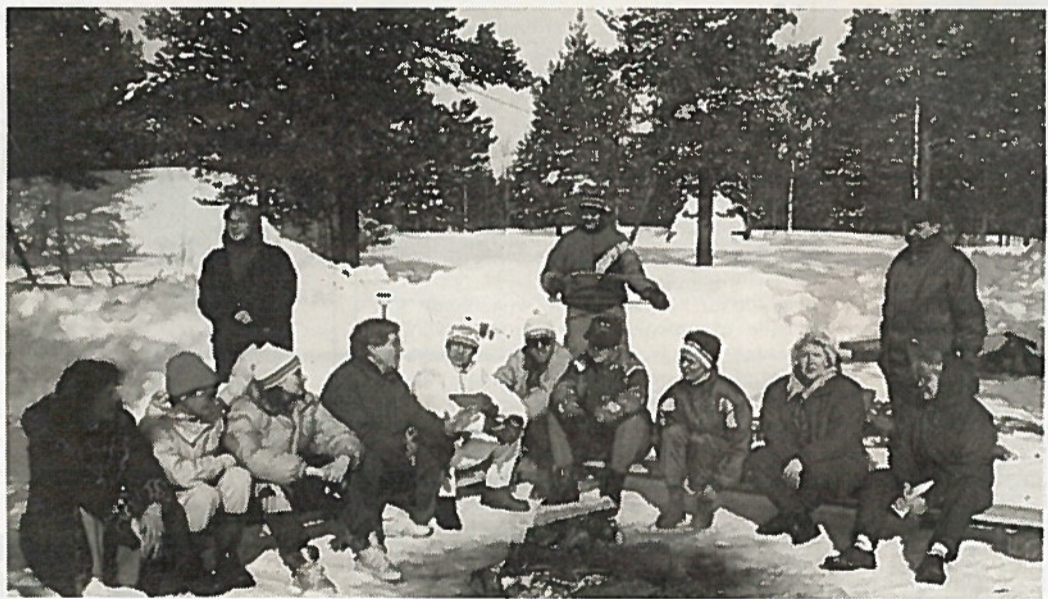
Luentojen vastapainoksi tehtiin lenkki ja juotiin nuotiokahvit metsän siimeksessä.