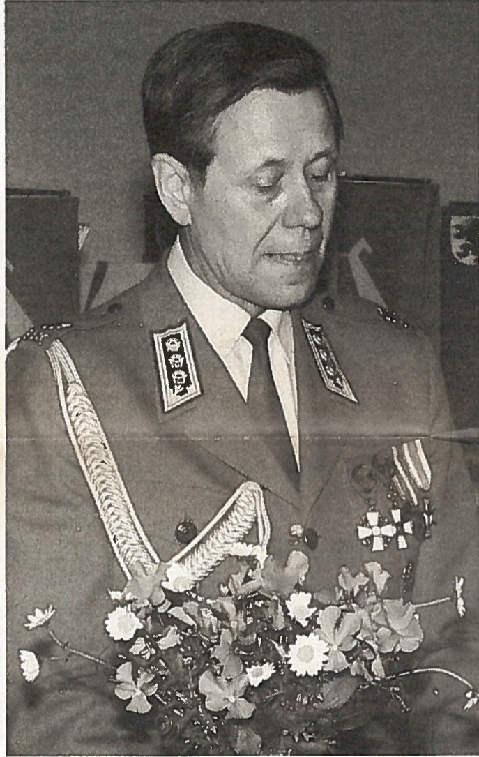
Eversti Jouko Hälvä arvioi, että lähiympäristömme on useita sotilaspoliittisesti vaikeasti ennakoitavia tekijöitä.

Venäjän kannalta suurvalta-aseman säilyttäminen on sekä ulko- että sisäpoliittisen uskottavuuden takia avainkysymys. Sotilaallisesti tähän pyritään 2.11.1993 hyväk-