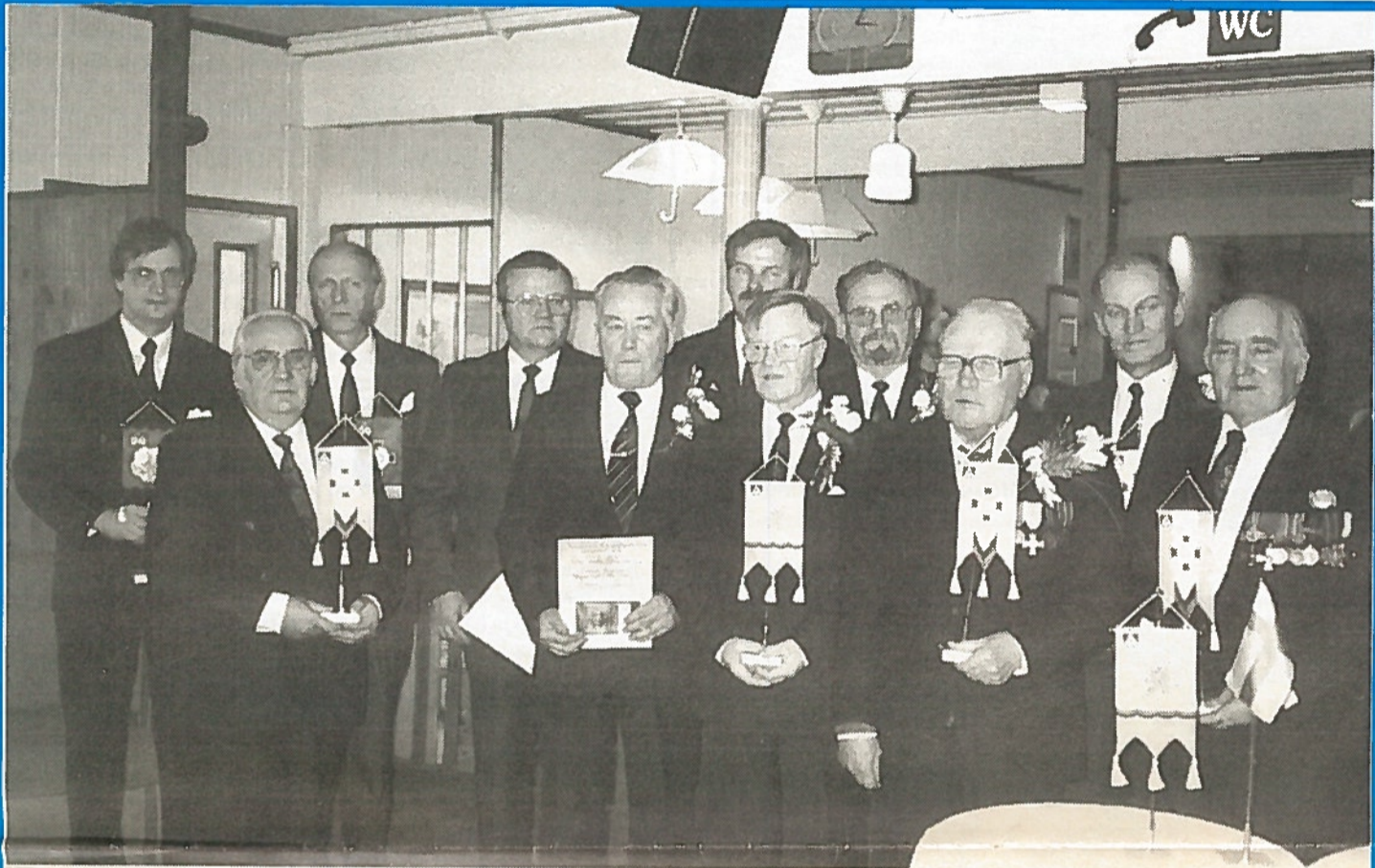
Perustajajäseniä ja ansiomerkin saajia yhteiskuvassa nykyisten puheenjohtajien kanssa.