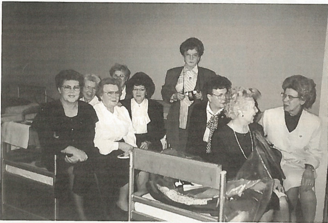
Liittokokouksen osanottajat pääsivät kokeilemaan varusmiesten majoitustiloja. Kuvassa pohjoiskarjalaiset tupa 8:n asukkaat.

Lisäksi hyväksyttiin yksimielisesti ehdotus SRUN-liiton uusiksi säännöiksi, joissa on kaksi tärkeää uudistusta. Liiton jäseneksi voidaan hy-