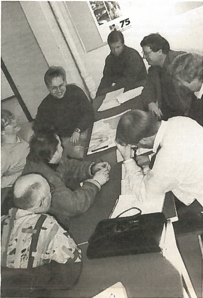
Kursseilla tehtiin myös ryhmätöitä.