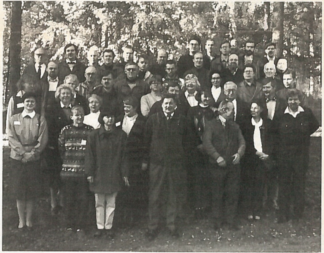
Kontiolahdella pidetyllä valmiuskurssilla oli osanottajia varsin runsaasti.

Yhdistyksissä järjestettävästä pakettikoulutuksesta saat tietoja omalta yhdistykseltäsi.