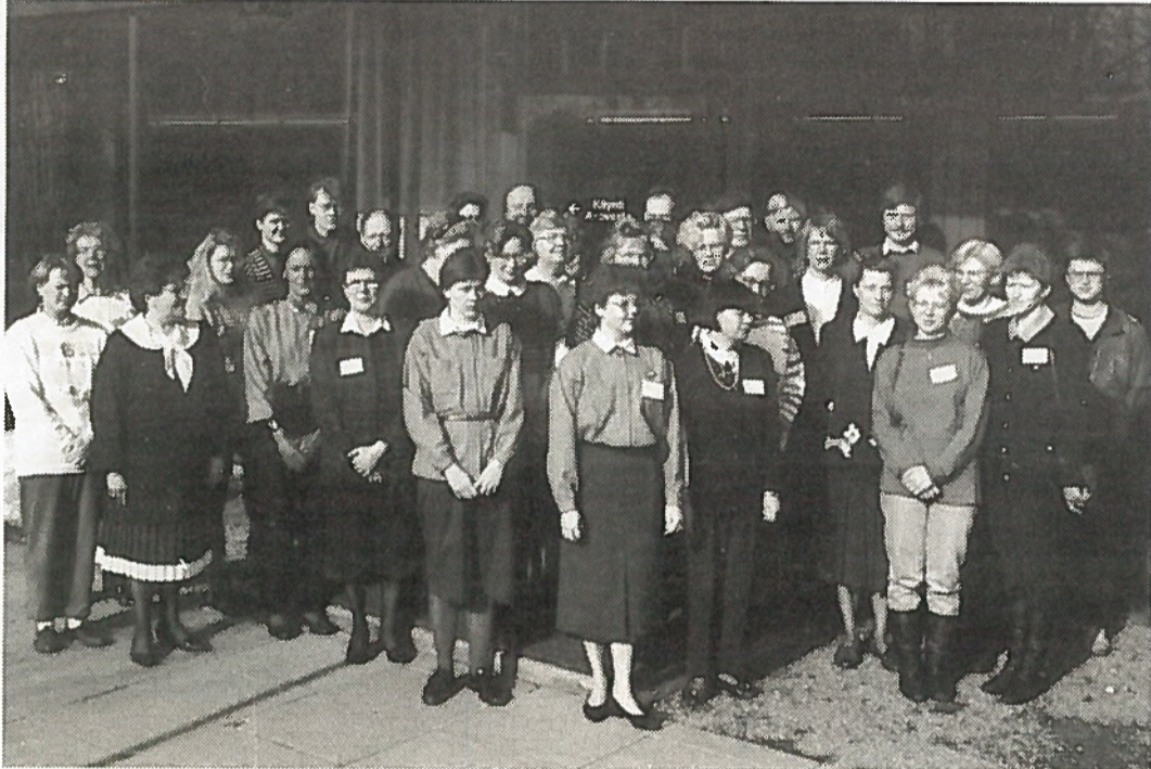
Joensuun kurssilaiset ryhmäkuvassa lääninhallituksen pihassa.

Kurssille voi osallistua 18 vuotta täyttänyt henkilö. Miesten osalta tulee varusmiespalvelus olla suori-