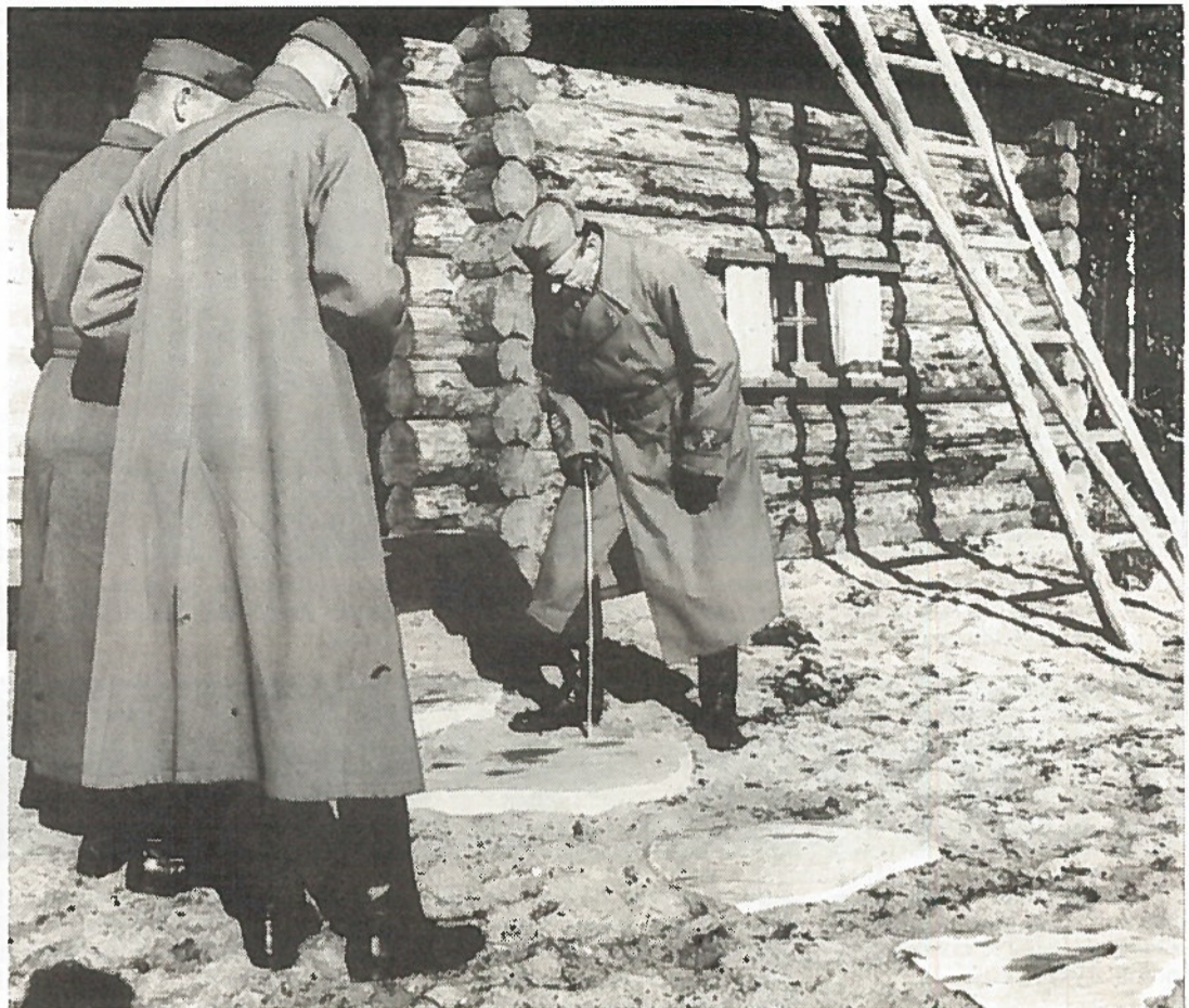
Marsalkka lahjasaunansa edustalla Repolassa syksyllä 1942.