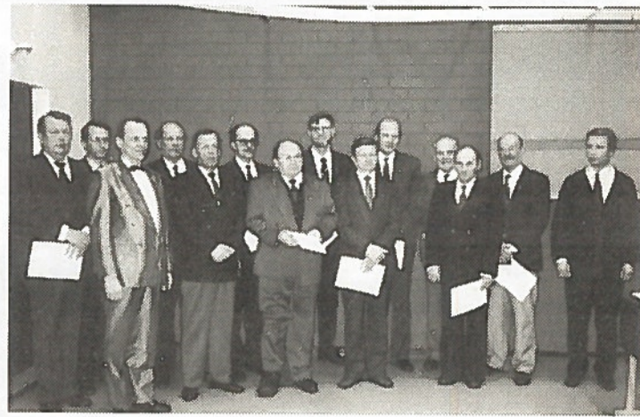
Tunnustuksen saaneita reserviläisiä yhteispotretissa.

Selvittelyt koulutustarkastajan johtaman erikoiskurssin pitämiseksi Pohjois-Karjalassa ovat käynnissä.