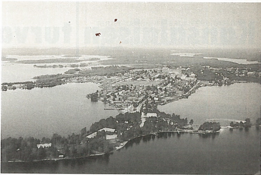
Repola ilmasta nähtynä.

M u u t a m i a vuosia myöhemmin laaditussa puolustus suunnitelmassa annettiin raja- ja suojajoukoille t e h t ä v ä k s i kriisin uhatessa Repolan valloittaminen ja Virran kapeikon haltuunotto. Näin ajateltiin aina t a l v i s o t a a n saakka, jolloin