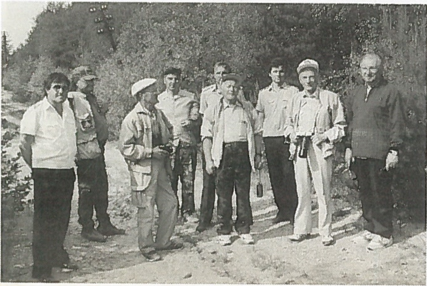
Entisiä tukikohtien päälliköitä siellä jossakin.

Repolaan keskitetyt neuvostojoukot vyöryivät rajan tälle puolen.