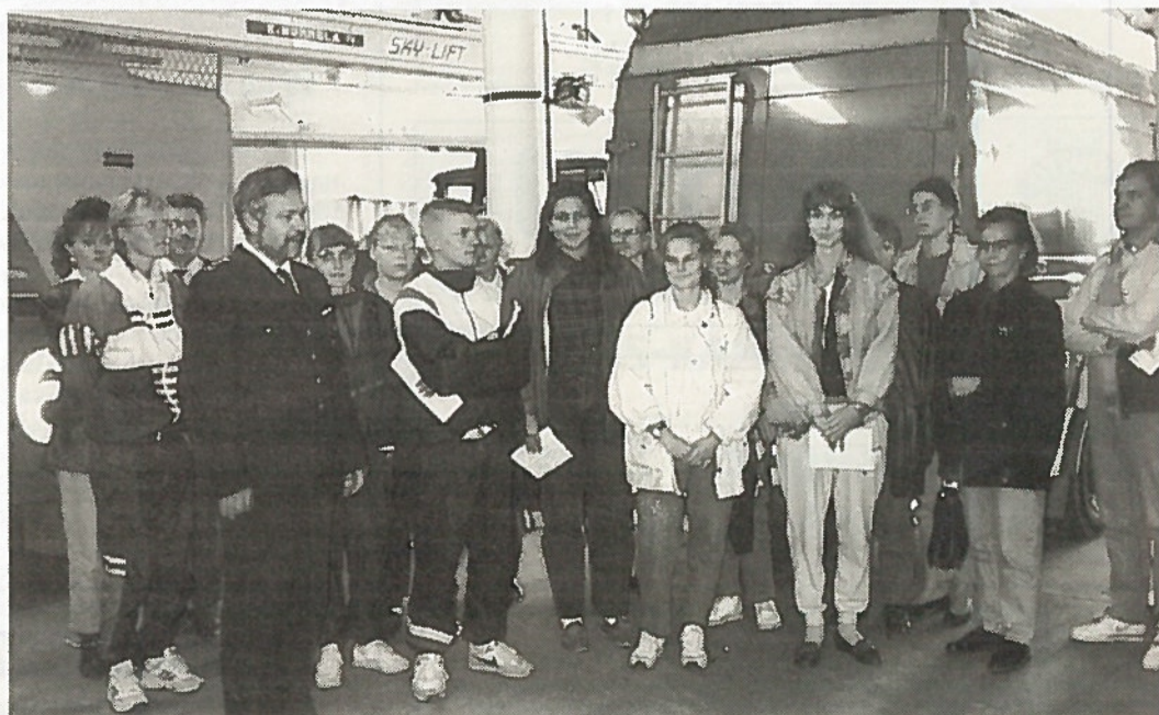
Kurssi kävi tutustumassa mm. Joensuun palolaitoksen toimintaan.