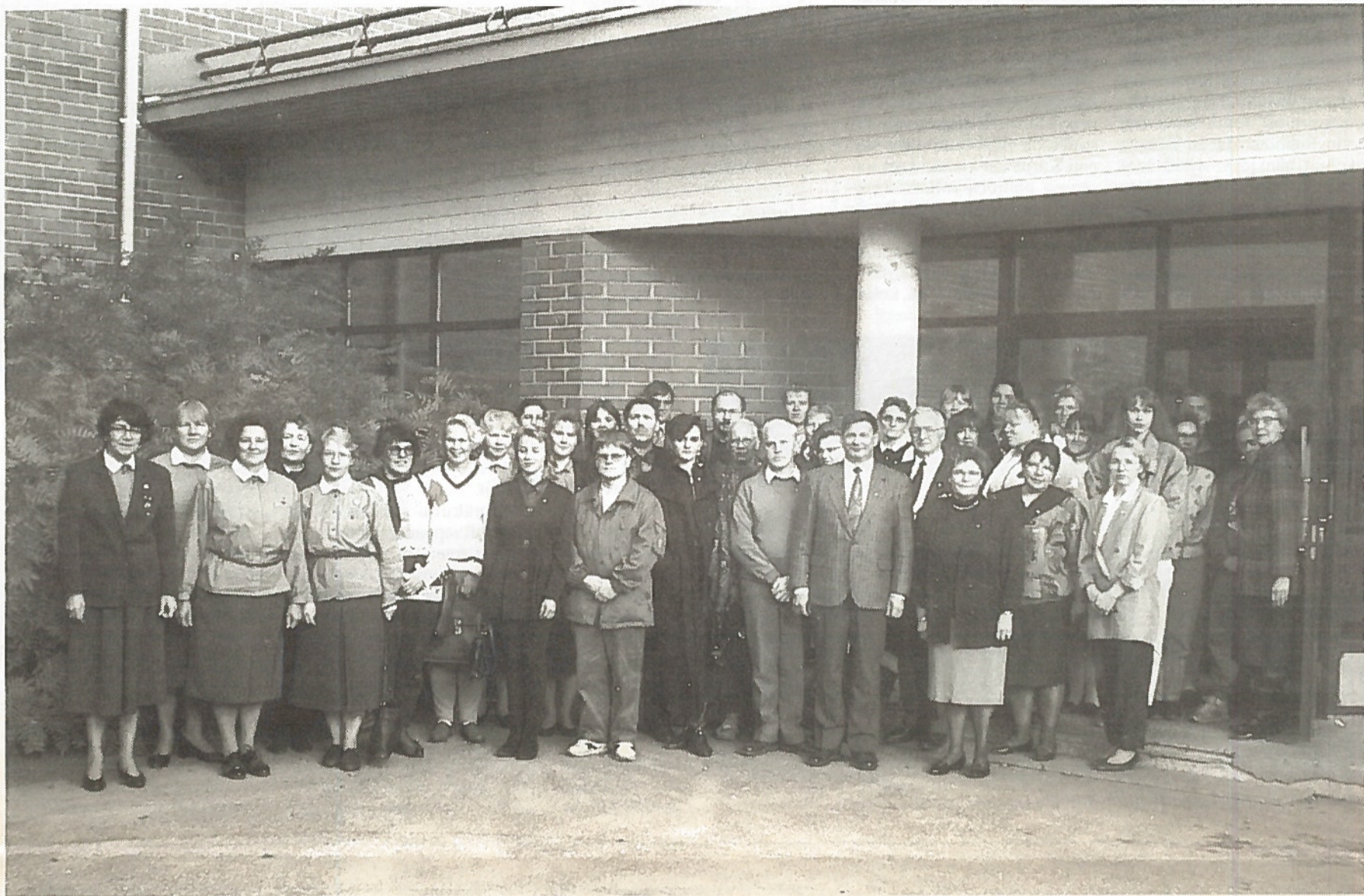
Kurssilaiset yhteisessä potretissa.

Kurssin alkuosa keskittyi kansalaisen omien taitojen ja kriisitietojen kartuttamiseen. Toinen puolisko käsitteli maanpuolustusta eri puolilta tarkasteltuna.