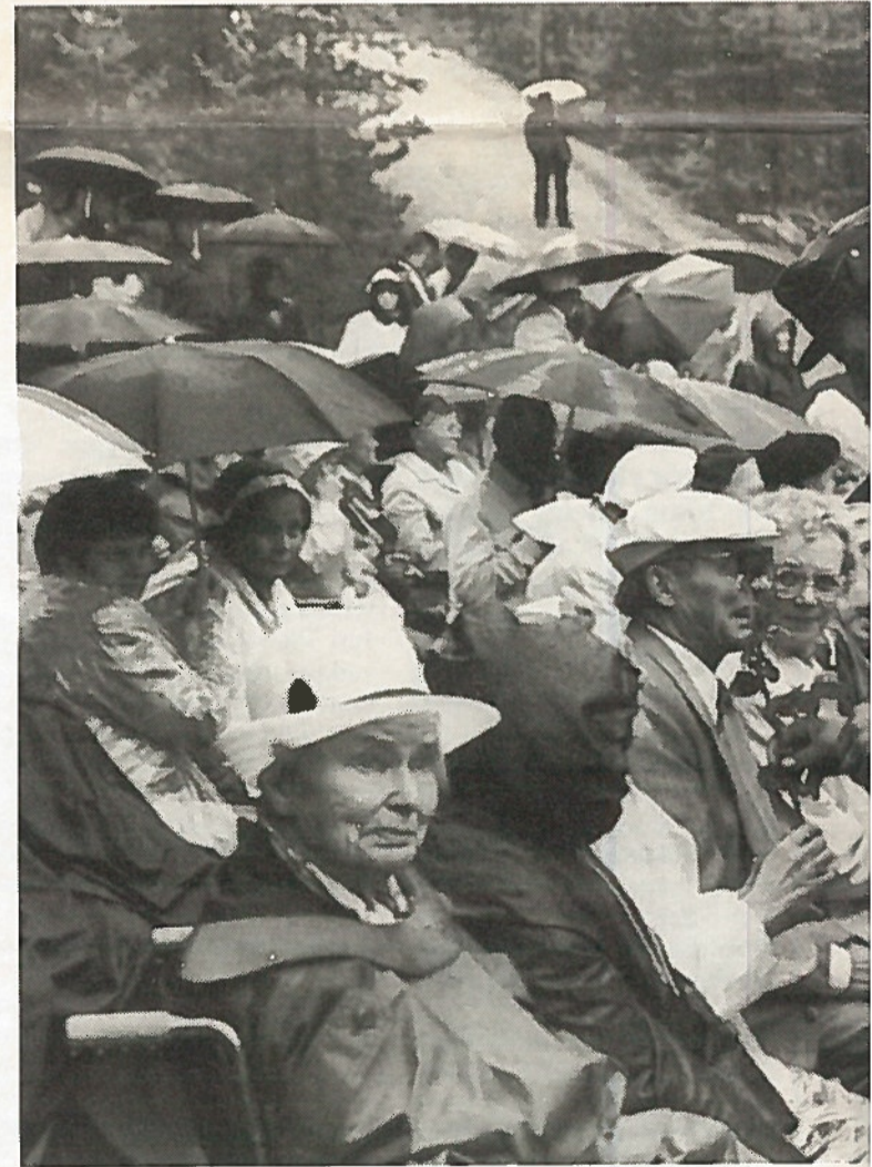
Kunniavieraana olleet lotat kukitettiin juhlan järjestäjien taholta.

Hälvä otti esille Itä-Euroopan entisissä sosialistisissa maissa sekä myös