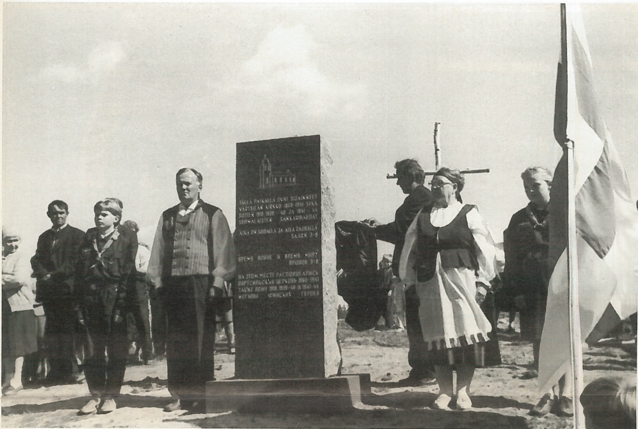
Venäjän Värtsilään pystytetty sankarivainajien muistomerkki kertoo Värtsilän antamasta uhrista isänmaalle.