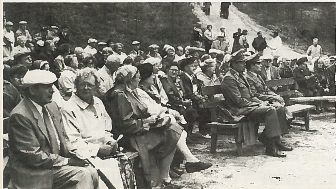
Hengellinen tilaisuus kokosi Änäkäiselle varsin runsaasti yleisöä.