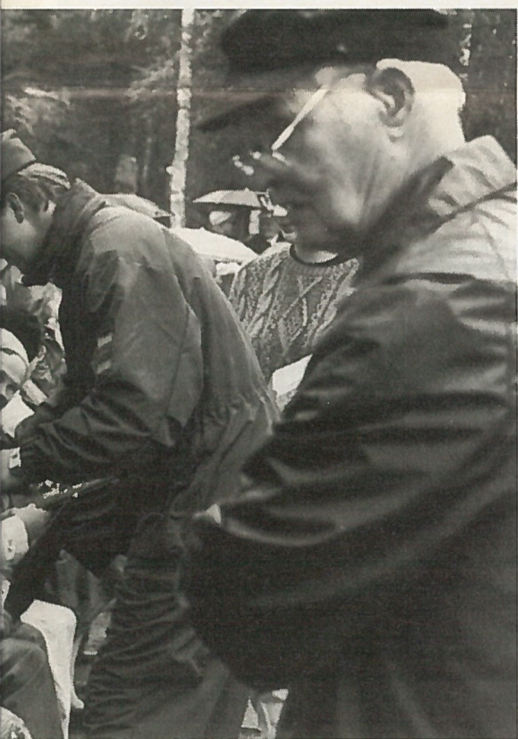
Tarjoilu tapahtui hieman samantapaisissa olosuhteissa kuin silloin ennen...

-Kukapa ei olisi kuullut lentäjä-sankareista. Tälle paikalle putosi kotka. Lentäjiä voimme kutsua kotkan