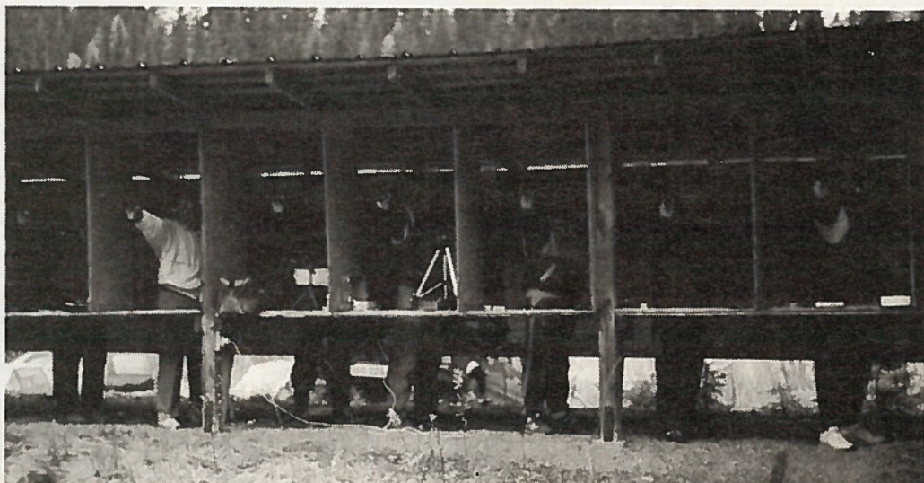
Kiteen reserviupseerikerho juhli perustamisensa 45-vuotisjuhlaa työn merkeissä. Kuvassa on menossa pienoispistoolin kuvioammunta.

Viiden vuoden kuluttua kerhon tullessa "miehen ikään" pidetään sitten kunnon vuosijuhlat arvokkaan ohjelman kera.