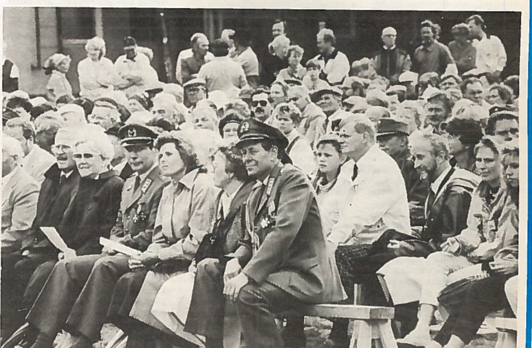
Sotilaat ja siviilit käsi kädessä yhteisessä pääjuhlassa.