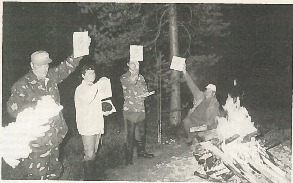
Iltauotiolla vietettiin hauskoja hetkiä marssilaulukilpailun merkeissä. Kuvassa arvostelutuumarit antavat pisteitä esityksestä kuin levyraadin ikään