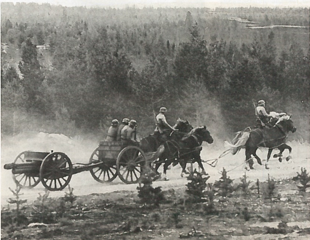
Kun tykit liikkuvat moottorivetoisina, niin ennen liikuttiin hevosvetoisesti. Juhlavieraat saivat oikein konkreettisesti nähdä asemaanajon, tulituksen ja asemanvaihdon. Se oli nostalgialta se.

Muutos tapahtuu myös koulutuksen osalta, sillä KaiTR tulee