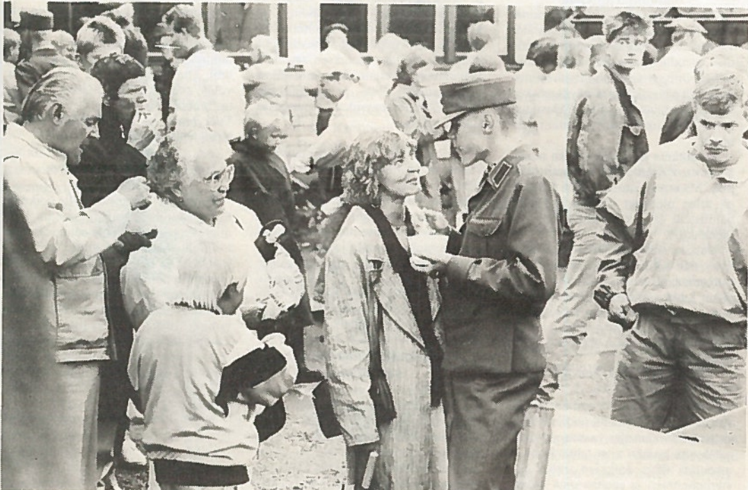
Ruoka se pitää tiellä sekä siviilin että sotilaan.