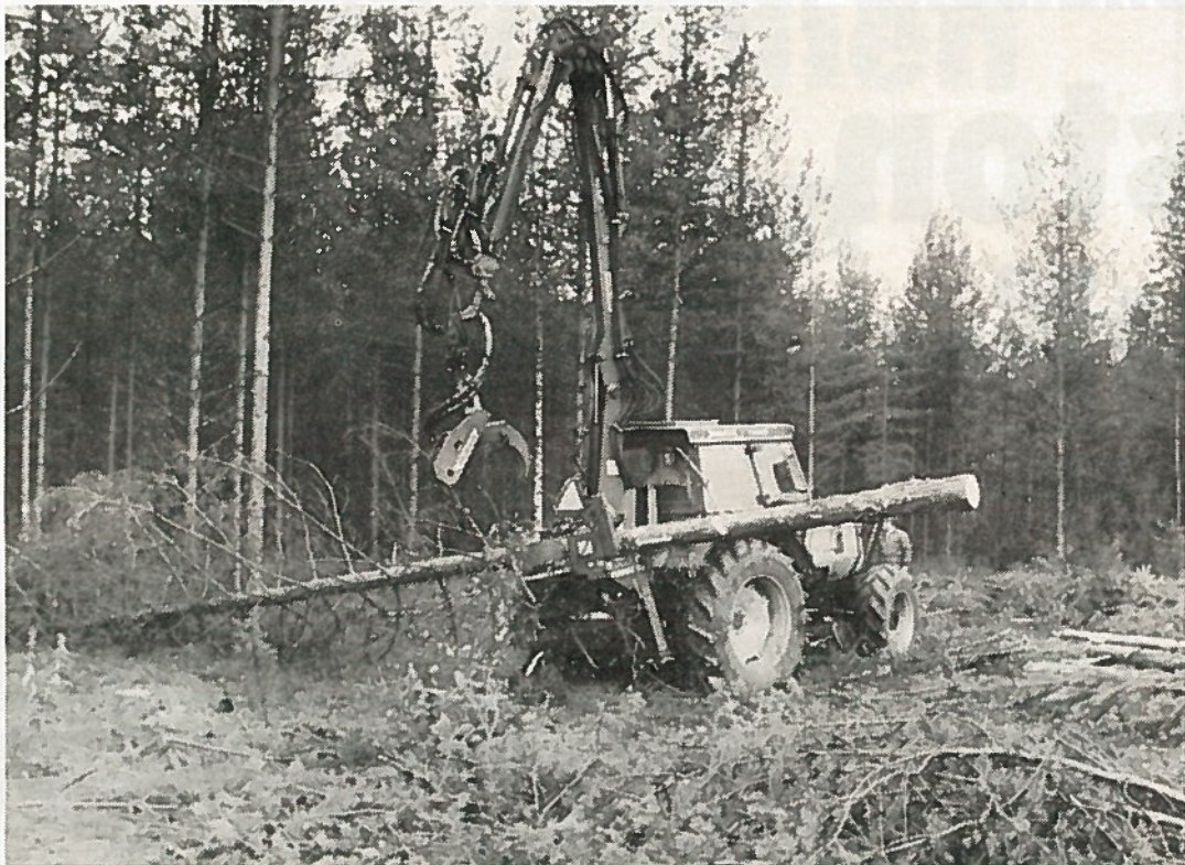
Hakkuut metsässä on sen parasta hoitoa. Hyvin hoidetussa metsässä myös maanpuolustusväki viihtyy, kirjoittaja sanoo.

Onneksi tämän päivän metsien käsittelyssä on tavoitteet toiset. Kohoavan puun tuotannon lisäksi on ohje edistää metsien hyödyntämistä sopusoinnussa muiden metsien käyttömuotojen kanssa. Metsäammattiväki alkoi myös oivaltaa, ettei tämä yhteiskunta muutu