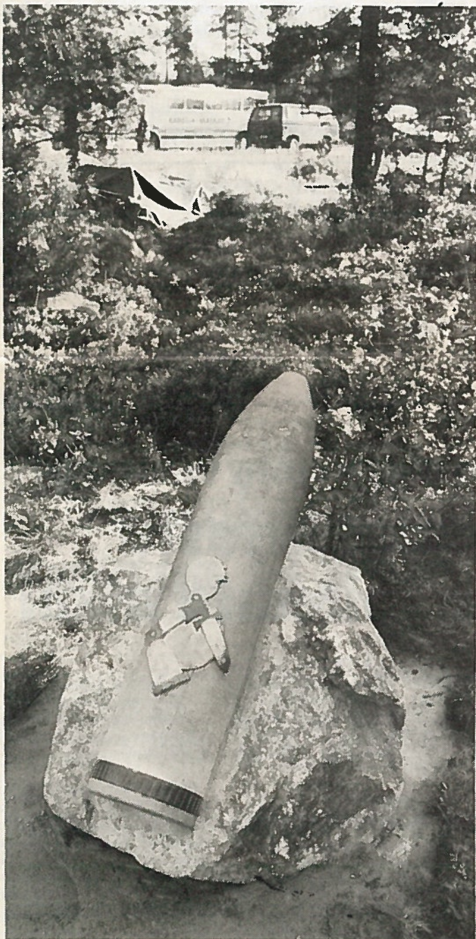
Pohjois-Karjalan Patteristosta kertova muistokivi paljastettiin Rovajärven 40-vuotisjuhlaleirin yhteydessä Heinivaarassa. Se muistuttaa yhden itsenäisen tykistöjoukko-osaston häviämistä keskuudessamme. Perinteet kuitenkin elävät

Kajaanissa kouluttamaan vain alokkaita ja Pohjanmaan Tykistörykmentti jatkokouluttaa valmiita tykkimiehiä, ryhmänjohtajia ja upseerikokelaita.