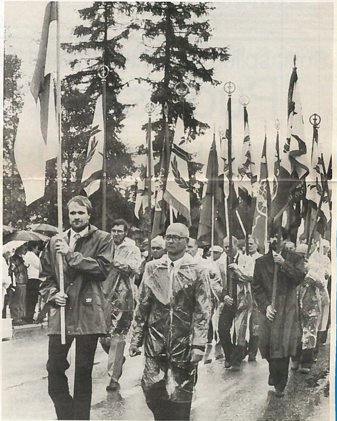
Maanpuolustusjärjestöjen lippulinna oli tälläkin kertaa mukana päivän tapahtumissa.

Maanpuolustus- ja kotiseutujuhlan tapahtumien yhteydessä oli varsin runsaasti erilaisia tapahtumia. Yleisöä riitti kaikkialle. Suotta ei tapahtumaa sanottu Polvijärven kesän kohokohdaksi.