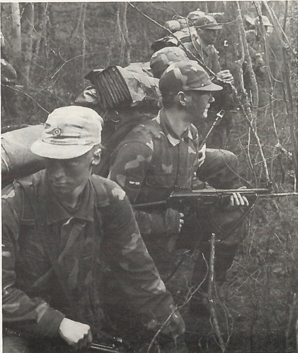
Sissin on oltava maastoon sopeutuva näkymätön taistelija.