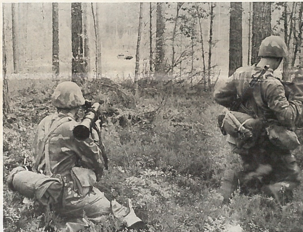
Kevytsinko on puhunut ja panssarivaunu on tuhottu.

Entiseen asevelvollisuuslakiin päädyttiin sotien jälkeen noin 40 vuotta sitten. Saapumiseriä astui palvelukseen 3/vuosi ja palvelusajat ovat 240 ja 330 vuorokautta vielä III/89 saapumiseriään saakka.