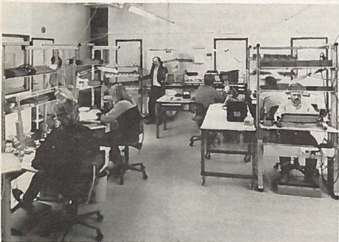
Paikkakunnalla on myös nykyaikaista teollisuutta.