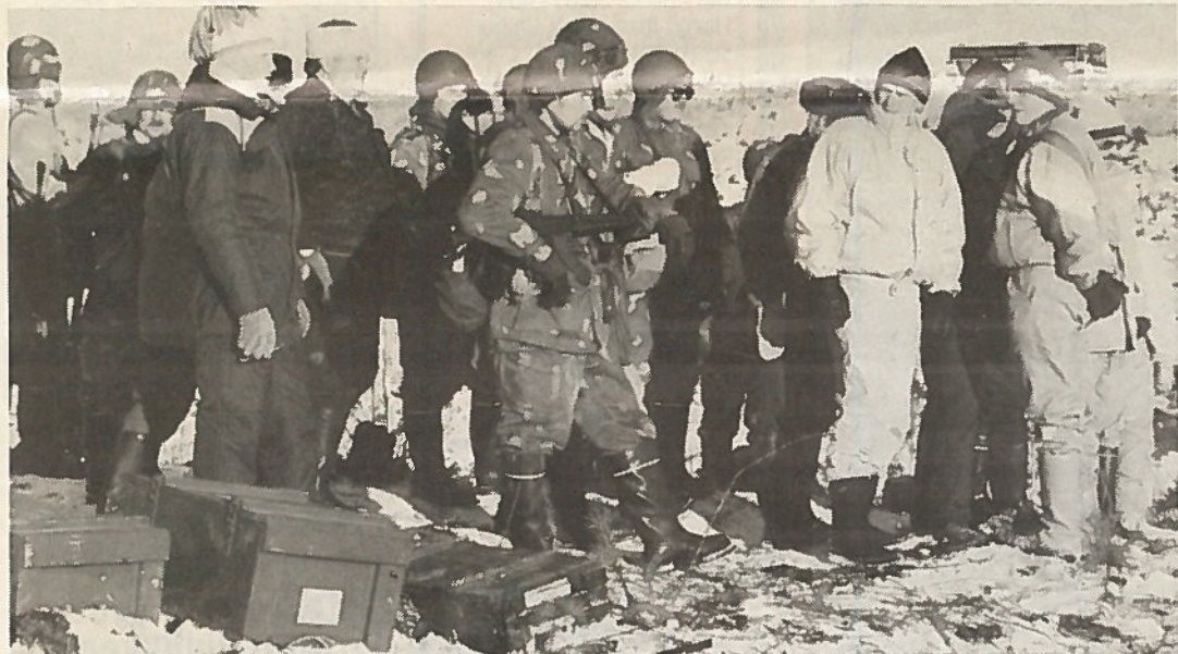
Retkeläiset seuraamassa ammuntaa.