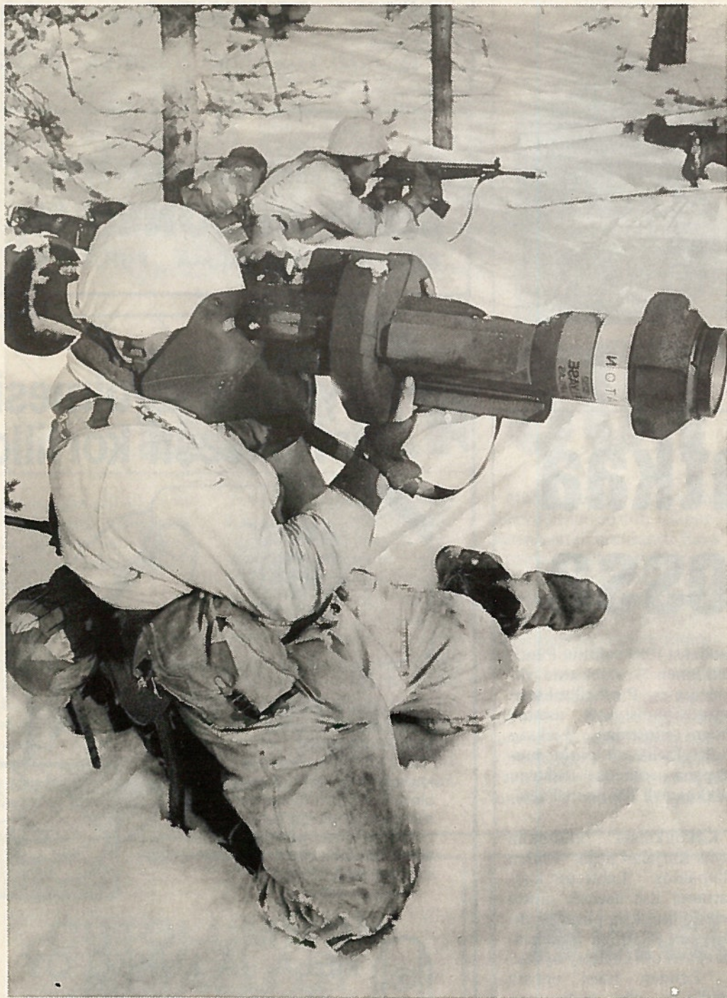
Raskas kertasinko laukaisu-valmiina.

Puolustusvoimat on osa suomalaista yhteiskuntaa. Yhteiskunnassamme tapahtuva kehitys vaikuttaa puolustusvoimien toimintamahdollisuuksiin ja toimintatavoihin.