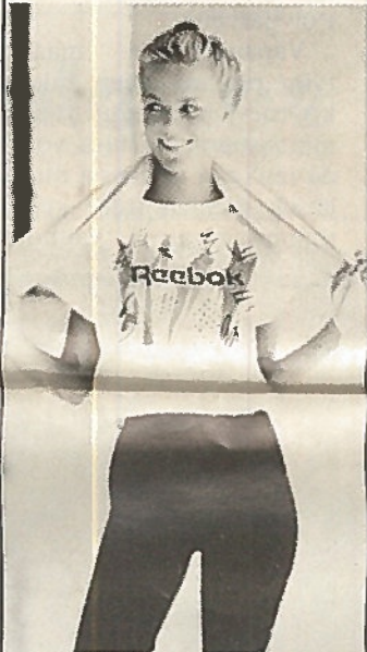
Miesten WORLD ROAD