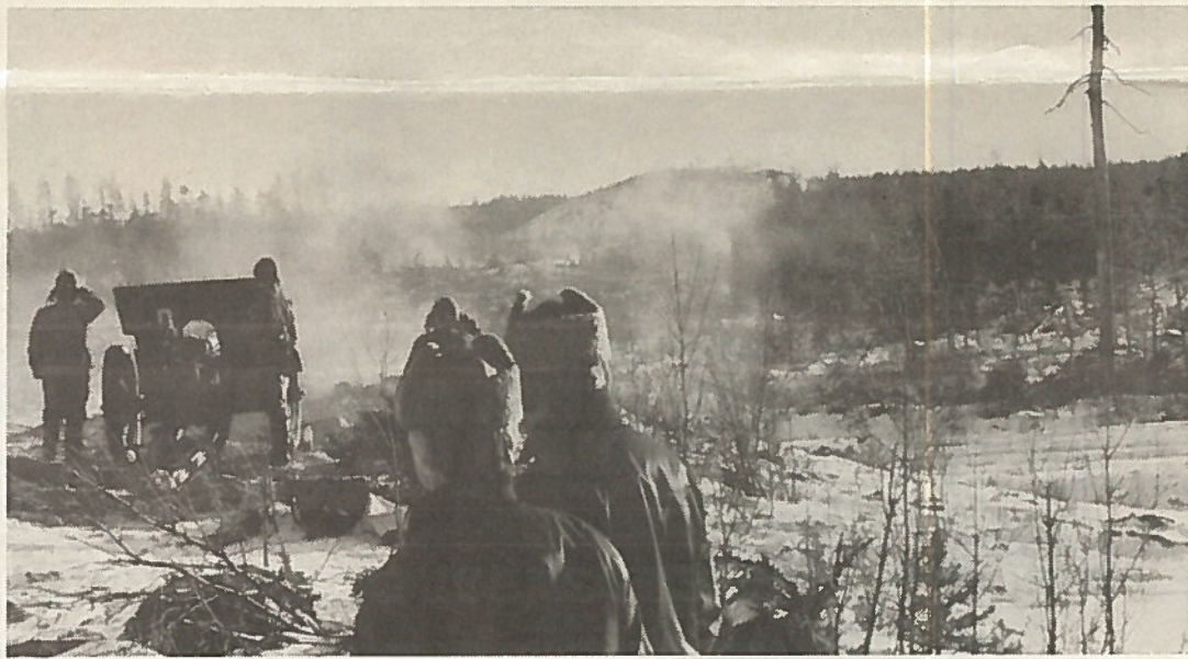
Kenttätikin suorasuuntaus synnytti melkoisen mutaryöpyn etumaastossa.