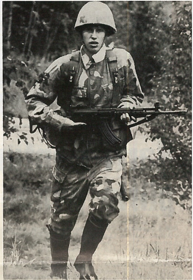
Uuden asevelvollisuuslain ehdotuksen mukaan kutsuntoihin on saavuttava jo 18 vuotiaana. Palvelusajan pituus tulisi olemaan nykyisten 240 ja 330 päivän lisäksi myös 285 vuorokautta.

Uudistukset on pakko toteuttaa. Useimmat ovat puolustusvoimien kannalta hyvin ongelmallisia, mutta ulkoisten olosuhteiden muutokset on otettava huomioon jos lakisääteisistä tehtävistä halutaan huolehtia hyvin ja tehokkaasti. Kehitys menee siihen suuntaan, että jonkun alueen etunäkökohdista, perinteistä tai eri henkilöstöryhmien välisistä hyötynäkö-