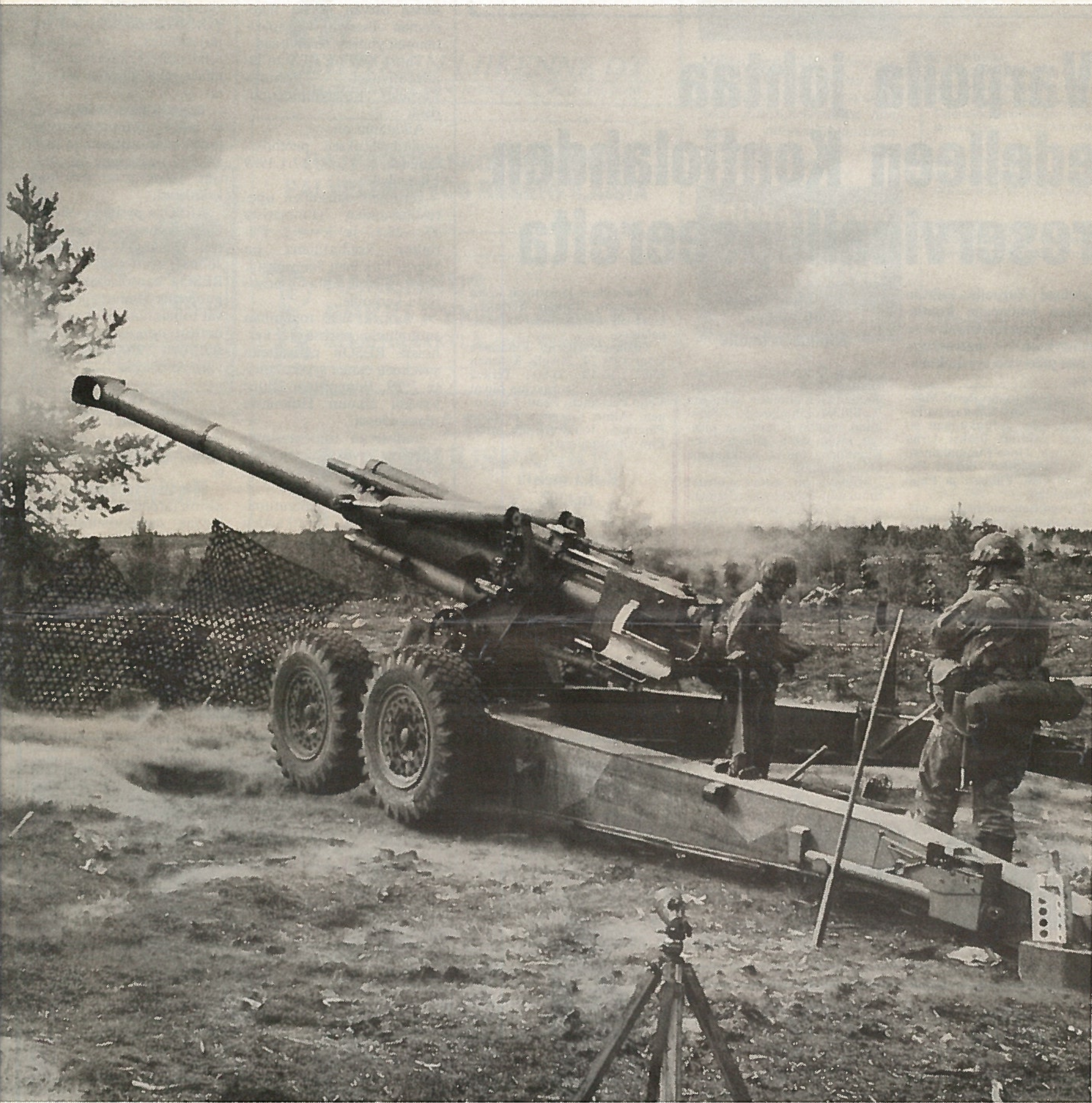
Tampellan valmistama 155 mm kanuuna vuosimallia 83.

rahojen kasvu edellisestä vuodesta on 10 %, mikä on vähemmän kuin koko budjetin reaalkasvu.