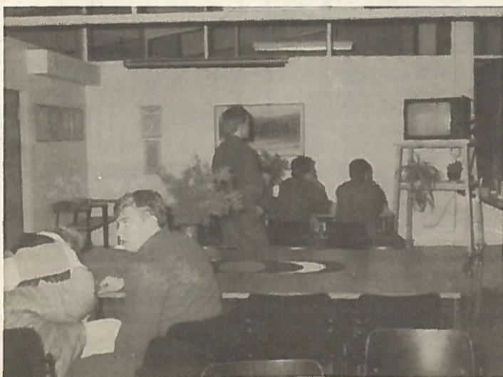
Televisio-nurkkaus on paikka, jossa viihdytään niin omaisten kuin tyttöystävienkin kanssa.

ra. Joulusauna kuuluu luonnollisesti kuvioihin. Jokainen yksikkö saa omat kuusensa ja kynttilänsä, samoin sairaala ja päävartio. Lisäksi kummanin kasarmien edustalle asetaan iso valaistu kuusi. - Joulukirkkoon voi jokainen halukas luonnollisesti mennä ja varuskunnan koulutustalli on pyhien aikana poikien täydellisessä käytössä. Tykkimestoimikunnan