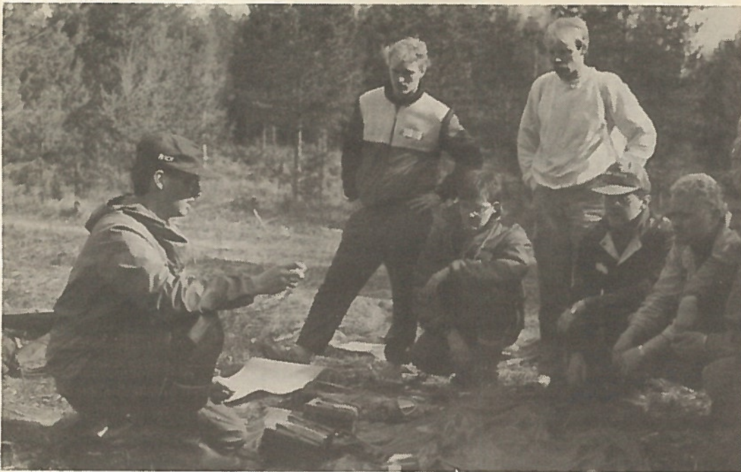
Lauantaina osanottajat kulkivat läpi useita eri rasteja, joista kuvassa hyvin ajankohtai- nen säteilyrasti.

Päivä päättyi vihdoinkin kasarmille hakeutumiseen, joukon purka- miseen ja yhteiseen illanviettoon upseerikerholla. Sunnuntaina aamupäivä kului sitten lep- poisammassa merkeissä, KarPr:n ja KarTR:n järjestämän kalusto- näyttelyn ja keskustelujen mer- keissä, ennen iltapäivällä tapah- tunutta kotiinlähtöä.