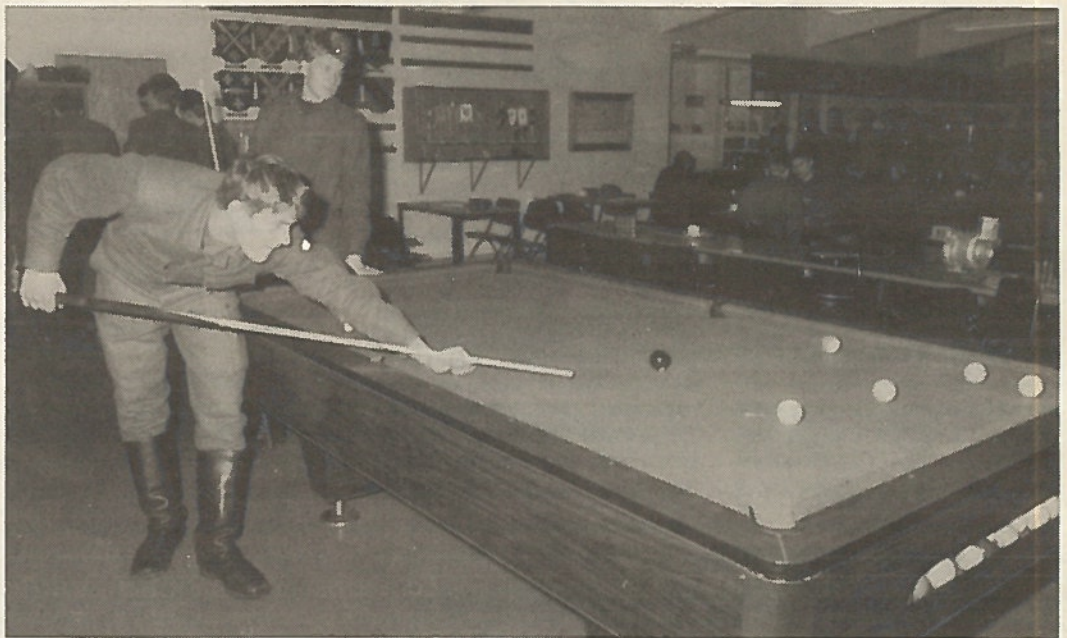
Pojat viihtyvät sotilaskodissa ja yksi viihdyke lähes kaikissa sotkuissa on biljardi. Mikä lienee viehätysten syy.