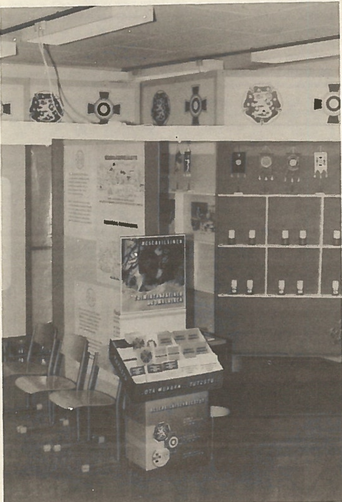
Kuvassa osa liki 30 m 2 :n suuruisesta messuosastosta. Etualalla liitosta saatu esiteline, josta oli saatavana reserviläistoimintaa esitteleviä painotuotteita.