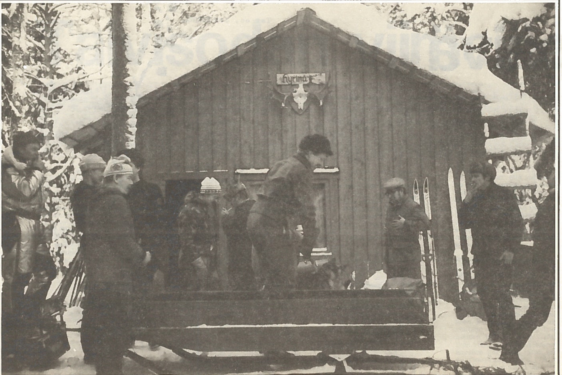
Hyvärilän Erän metsästysmaja on saavutettu ja yöpyminen edessä.