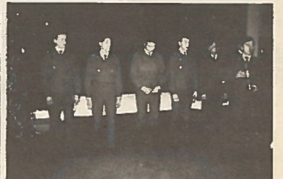
Sissijohtajia valmistuu vuo- sittain lähes 70. Tässä pal- kitaan parhaita.