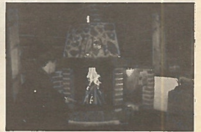
Partio yöpyy tarvittaessa partiomajassa.