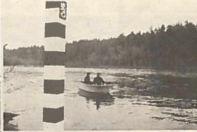
Rajapartio vesistöllä rajamerkkien tarkastuksessa.

Vartiointi ja valvonta toteutetaan partioimalla rajalla ja rajavyöhykkeellä sekä valvomalla raja-alueita ja sille johtavia kulku-uria rajavyöhykkeen takarajalla ja valvontatorneissa. Rajanylikulkua valvotaan Värtsilässä, Haapa-vaarassa ja kokkojärvellä.