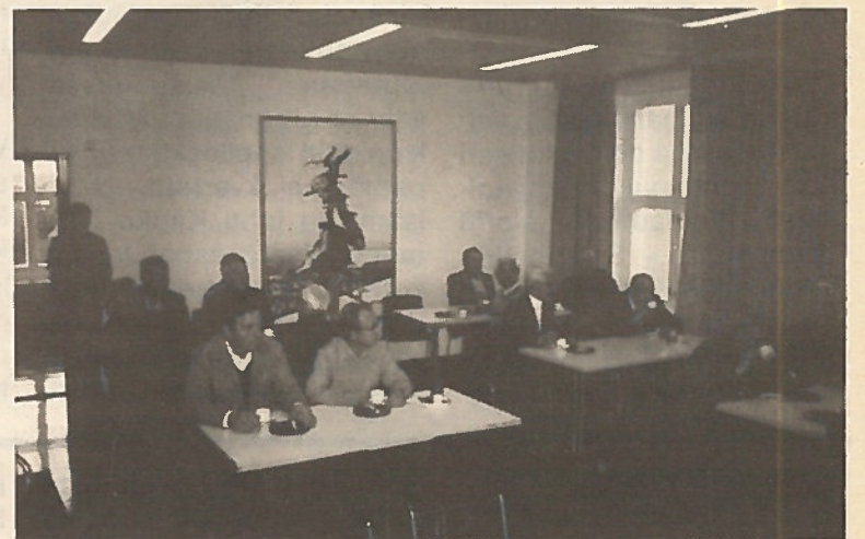
Rajarauhan ylläpitämisessä rajavartiosto tarvitsee yhteistoimintaa toimintapiirinsä eri viranomaisten sekä paikallisen väestön kanssa.

Rajavyöhykelaki ja -asetus aiheuttavat rajoituksia elämiseen ja liikkumiseen rajavyöhykkeellä. Näitä rajavyöhykettä koskevia opastauluja on rajavyöhykkeelle johtavien teiden varsilla rajavyöhykkeen takarajalla.