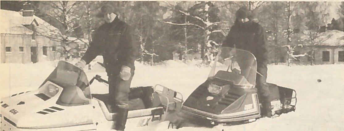
Uusinta moottorikelkkakalustoa. Varusmiesten kouluttaminen kelkkakuljettajiksi on aloitettu tämän talven aikana.

Rajavartiointi edellyttää liikkumista laajalla alueella. Tarvittava kuljetuskalusto on viime vuosina uusiutunut tyydyttäväksi. Maastoliikkuvuus on parantunut. Kaluston huolto- ja korjaustoiminta on keskitetty Onttolaan. Erikoistöissä tukeudutaan joensuulaisiin korjaamoihin.