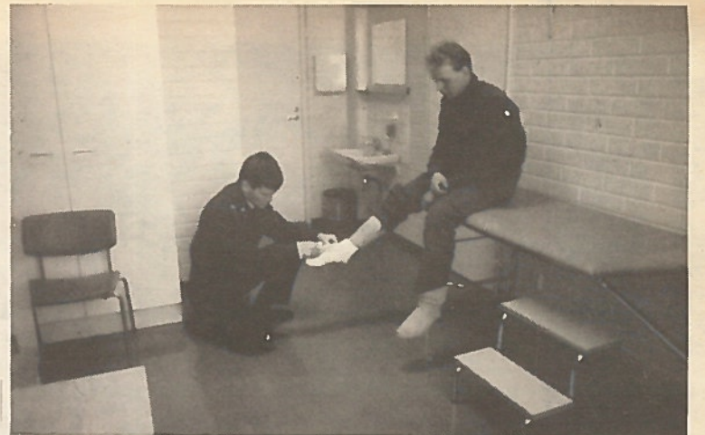
Lääkintäalikersantti antamassa ensiapua.

Terveystieteiden osastossa oman sairastuvan lisäksi tukeudu- taan terveyskeskuksiin ja valtion alueelliseen työter- veysasemaan.