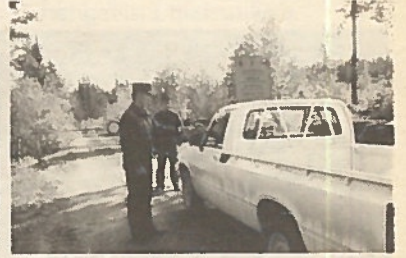
Rajavyöhykkeen takarajalla oleva valvontapartio.