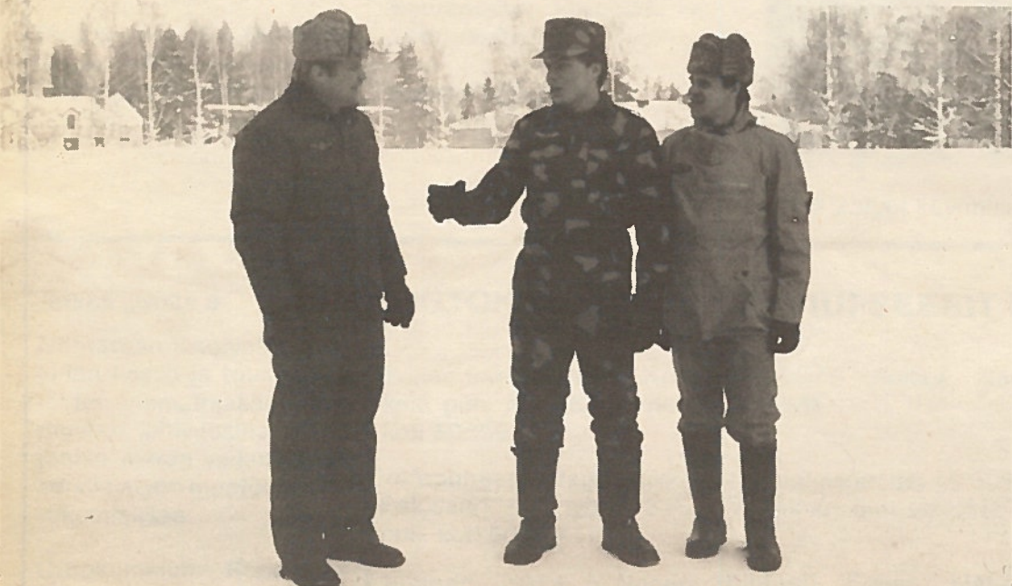
Vaatetuksessa on kiinnitetty suurta huomiota käyttökelpoisen partio- ja suojavaatetuksen kehittelyyn ja hankintaan. Kuvassa vasemmalta rajavartiomies lämpöpuvussa, partiopuvussa ja anorakkipuvussa.