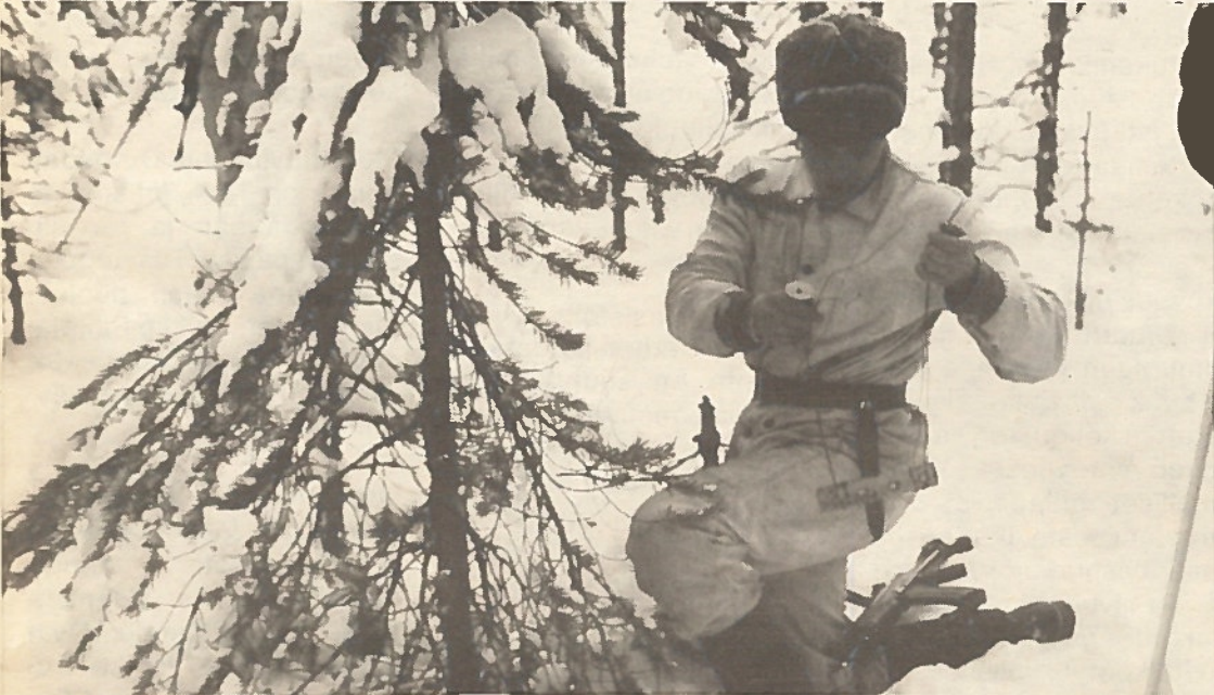
Sissikoulutus on päätehtävä sissikompaniassa.

Sissikomppania kouluttaa vuosittain yli 200 nuorukaista sisseiksi ja sissijohtajiksi. Palvelusaika käytetään tarkoin koulutukseen. Maastoharjoitusten ja taisteluammuntojen osuus on suuri. Rajavartioston omasta toimintapiiristä palvelukseen kutsuttu joukko omaksuu hyvin sissin tiedot ja taidot sekä sotilaskurin.