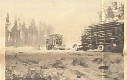
Puutavaran kuljetusta rajan takaa.