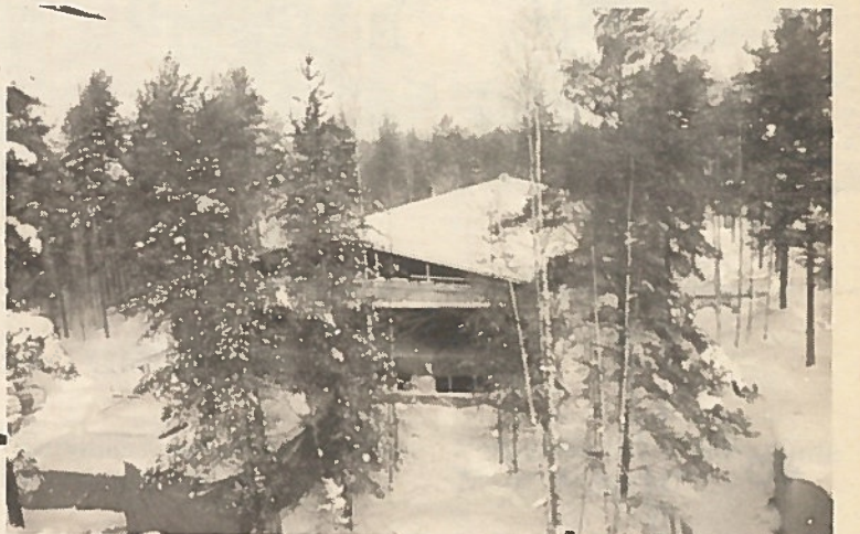
Rakentaminen ja peruskorjaukset ovat huomattava osa huollon toimintaa. Painopiste on viime vuosina ollut kou- lutus- ja johtamismahdollisuuksia edistävissä kohteissa. Näitä ovat olleet esikunnan laajennus ja uusi koulutus- ja huoltorakennus Onttolaan sekä rajakomppanioiden kom- mentopaikkojen kasarmien peruskorjaus. Kuvassa uu- den keskusvarastorakennuksen työmaa Onttolaan.