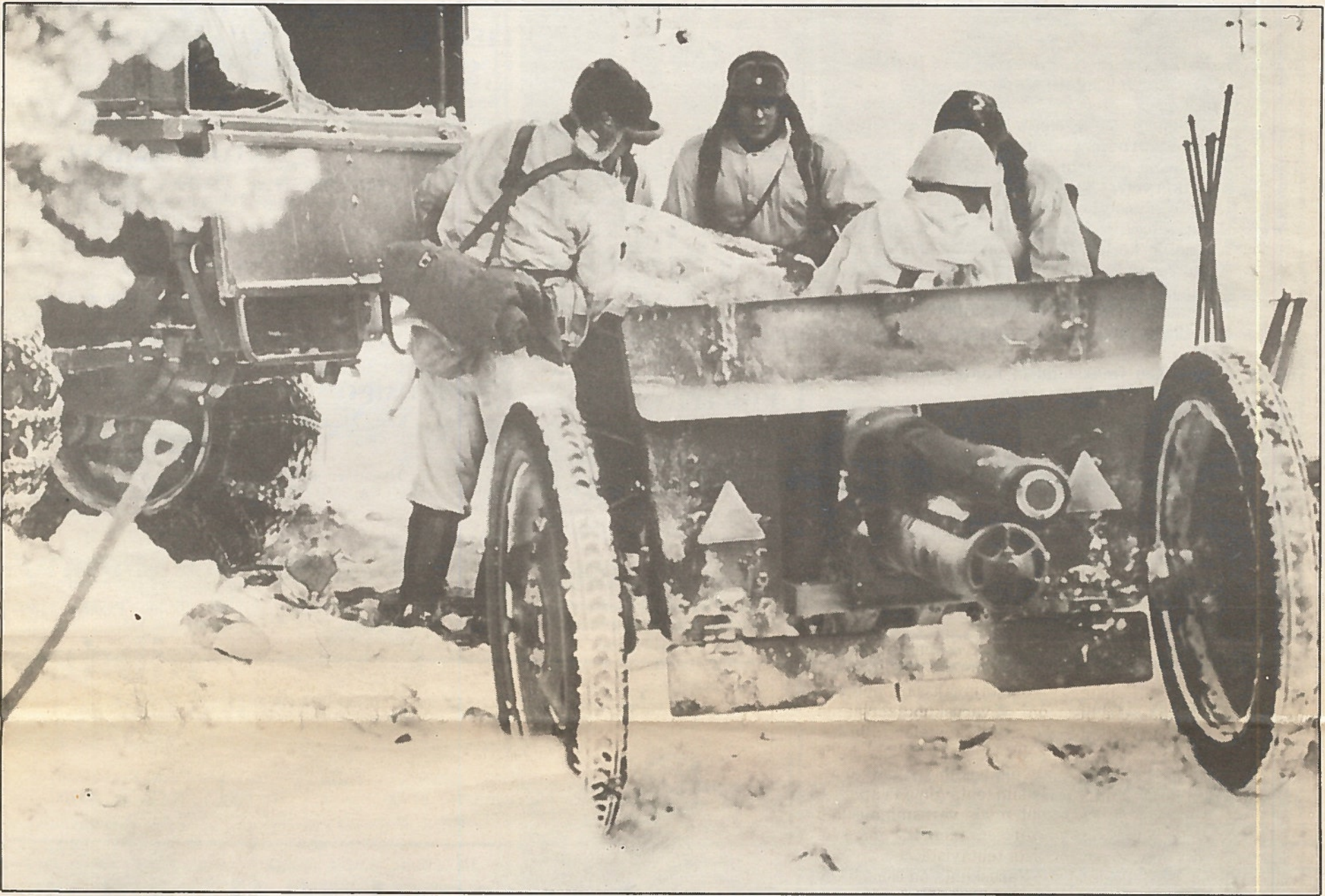
Koulutus annetaan ajanmukaisella kalustolla . . . Leireillä taitoja syvennetään myös vanhempaa kalustoa käyttäen.

Ylämylly on tullut tunnetuksi varuskuntapaikana kautta maan Väinö Linnan Tuntemattoman sotilaan ensi sivuilta. Onhan paloaukea, jonka viereltä silloinen Jalkaväki-rykmentti 8 lähti jatkosotaan, sijainnut keskellä nykyistä Ylämyllyn varuskunta-aluetta.