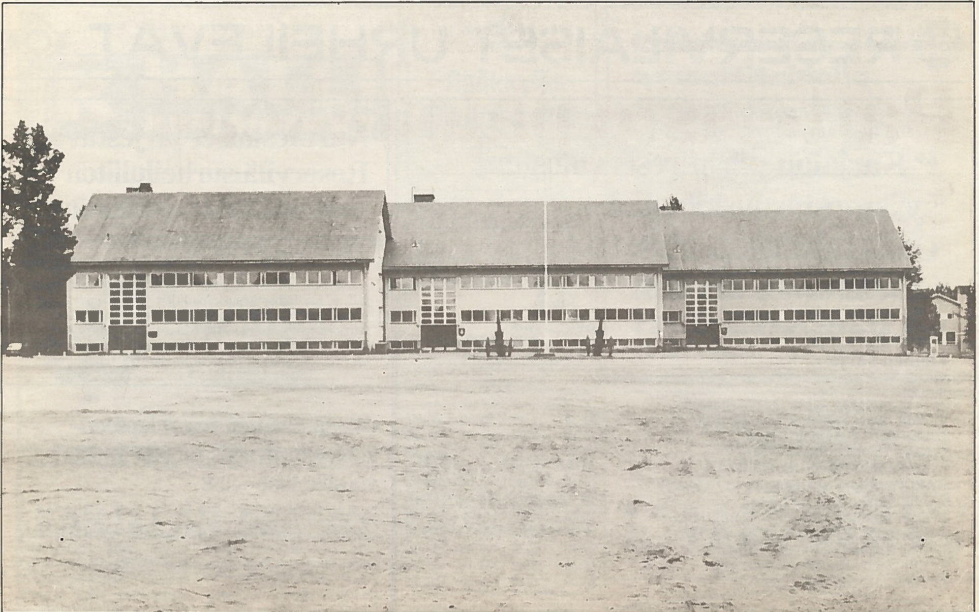
Tämän päivän kasarmi Paloaukean laidassa.

I:n lopulla suoritetaan taisteljan tutkinto, joka käsittää erilaisia tehtäviä taistelu-, ase- ja ampuma- sekä liikuntakoulutuksessa. Tutkinon suorittamisen edellytyksenä on myös osallistuminen tiettyihin taistelukoulutuksen perusharjoituksiin. Perus- ja erikoiskoulutuskausi I:n jälkeen osa siirtyy erikoiskoulutuskausi II:lle saamaan perusteellista aselajitai huoltokoulutusta ja osa siirtyy Aliupseerikouluun.