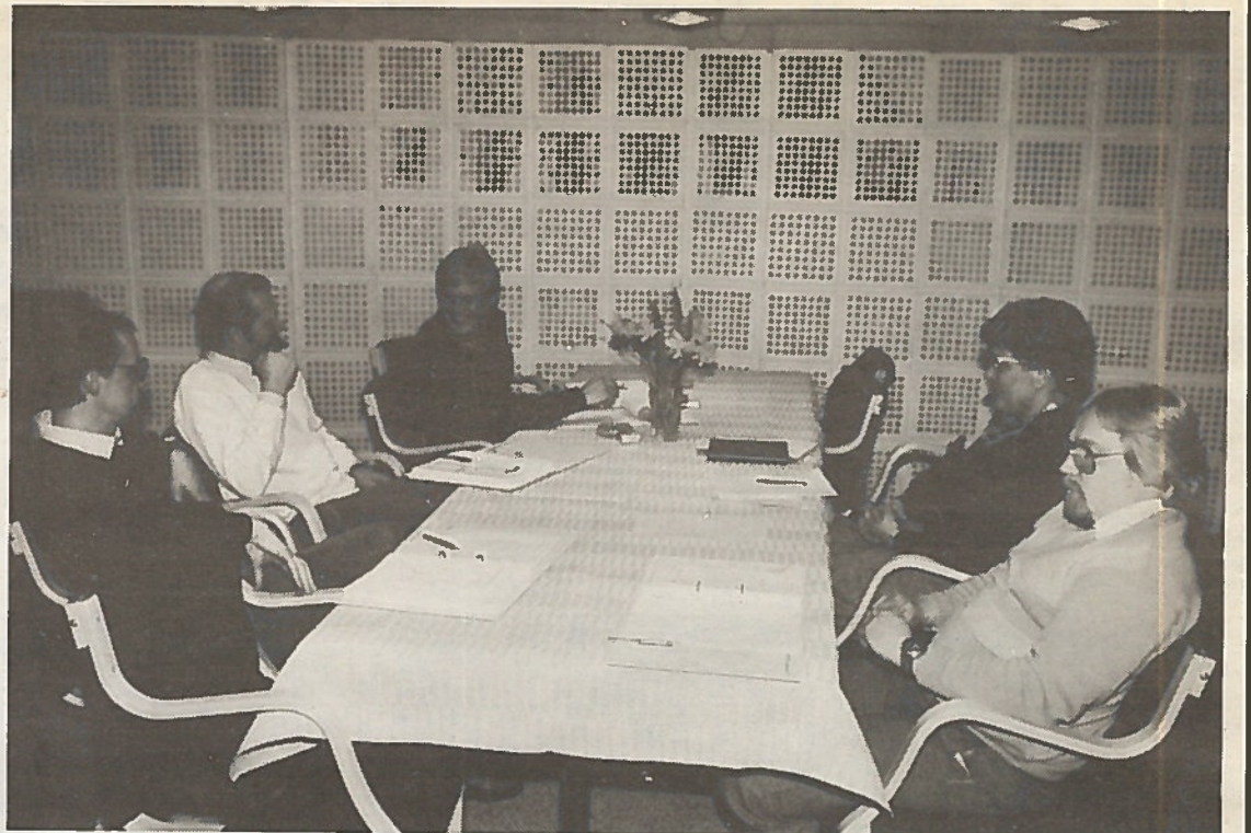
Suuri osa opiskelusta tapahtui ryhmätyöskentelynä. Ryhmien raportit käsiteltiin yhdessä ja käytiin niistä keskustelu.

nen ja opettajina joukko pohjoiskarjalaisia alan asiantuntijoita. Kokemukset kurssista olivat molemmin puolin myönteiset.