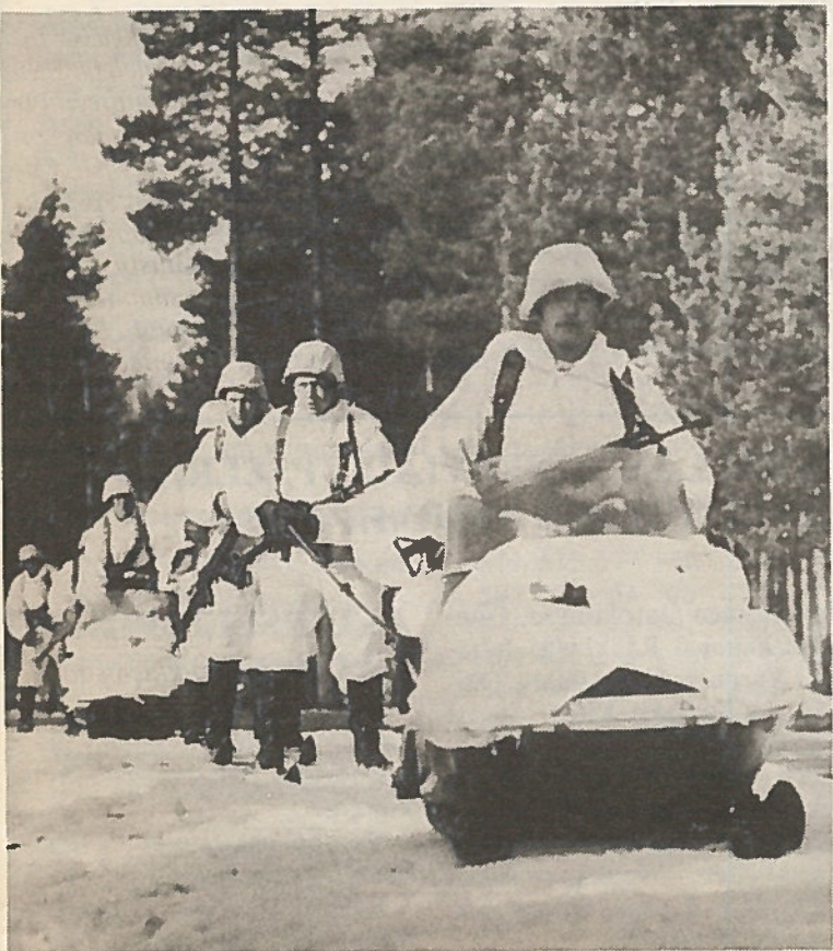
Sotilasosasto pystyy talvisin siirtymään nopeasti moottorikelkoilla. Kelkoilla voidaan hinata myös hiihtäviä miehiä.

Sotilaspiirin esikunnan tärkein rauhan aikainen tehtävä on liikekannallepanovalmistelujen suorittaminen. Se käsittää suunnittelu- ja valmistelutehtävät sodan ajan joukkojen muodostamiseksi niin henkilöstön kuin materiaalin osalta. Sotilaspiiri valmistautuu tarvittaessa puolustamaan aluettaan kaikin käytettävissä olevin voimin ja keinoin. Sotilaspiiri on kiinteässä yhteistoiminnassa lääninhallituksen, piiri- ja paikallishallinto- sekä väestönsuojeluviranomaisten kanssa maanpuolustusta koskevissa asioissa. Yhteistoiminta-aloina ovat yleinen hallinto, viestitoiminta ja muut PTL:n alat, terveydenhuolto ja lääkintähuolto, seutukaava-suunnittelu, teollisuus- ja liikekeyritykset, voimahuolto, työvoima, kuljetukset ja