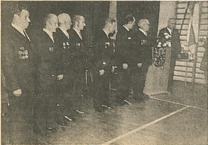
Rääkkylän Reservinallupseerien vapaaajajäsenien uljasta rivistöä.

Rääkkylän Reservinallupseerit r.y. ja Rääkkylän Reservinallupseerit r.y. perustamisesta oli 23. 10. 1972 kulunut 15 vuotta. Hyvän yhteistoiminnan osoituksena yhdistykset järjestivät myös yhteiset 15-vuotisjuhlat Rääkkylän kansalaiskoululla, jonne kokoon-tui runsas joukko vapaaehtoisen maanpuolustustyön veteraaneja, paikallista jäsenistöä ja ystäviä.