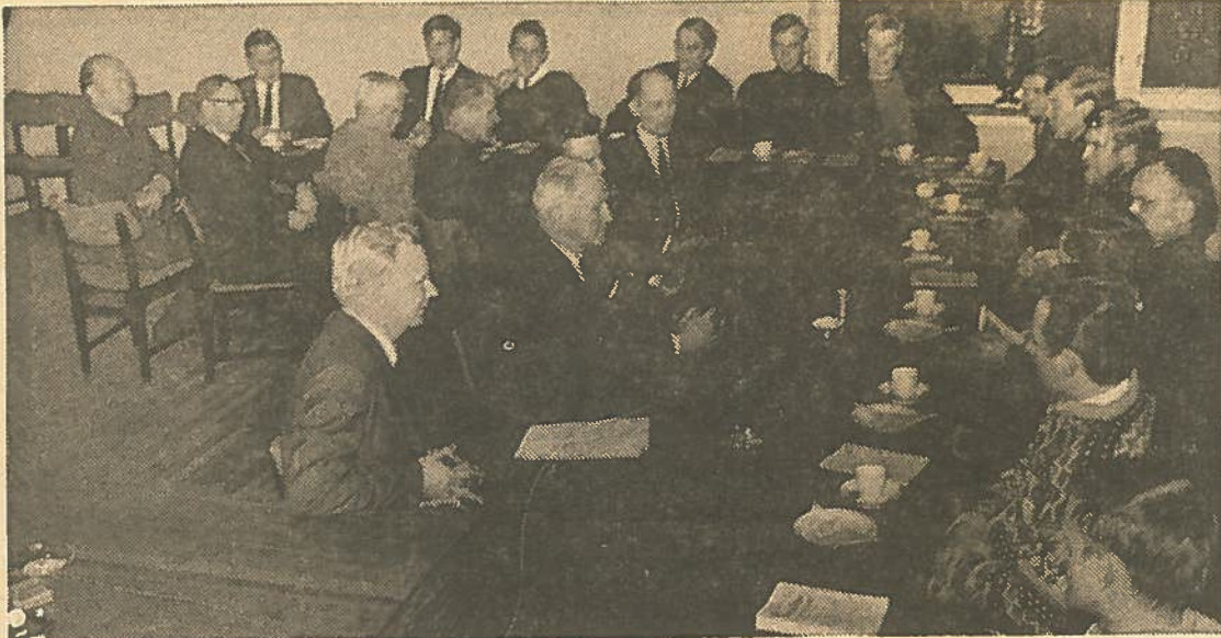
Joensuulaisia opiskelijoita kiinnostaa maanpuolustustyö. Kuvassa 17. 10. -68 Karjalan talossa Joensuun res. ups. ja res. au-yhdistysten johtoa ja WTO:n oppilaskunnan edustajia neuvottelemassa yhteistoiminnan aloittamisesta.