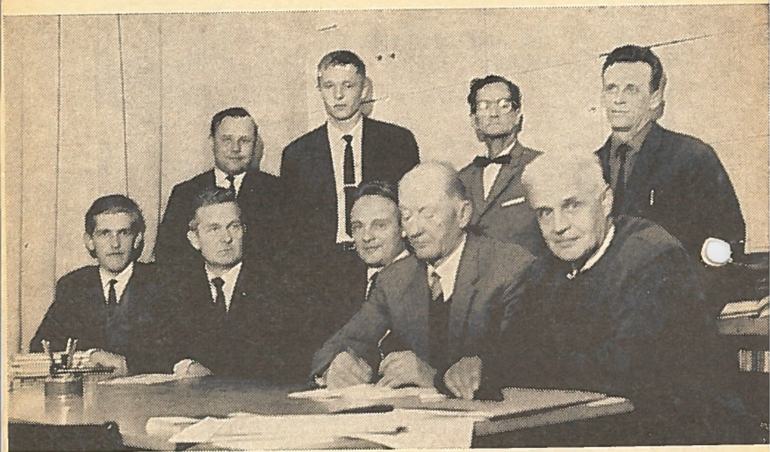
Tuupovaaran reserviupseerikerhon perustamiskokouksen osanottajat.