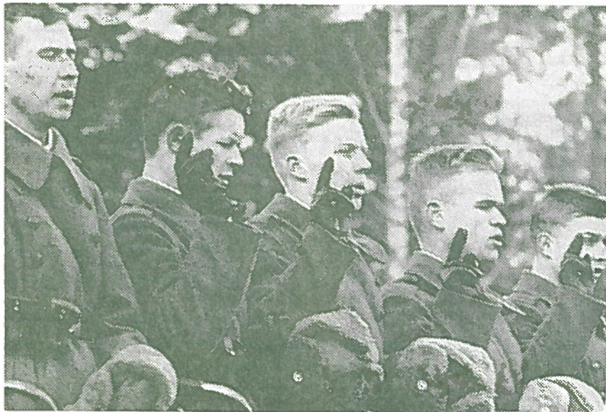
Lokakuun saapumiserä vannomassa sotilasvalansa.