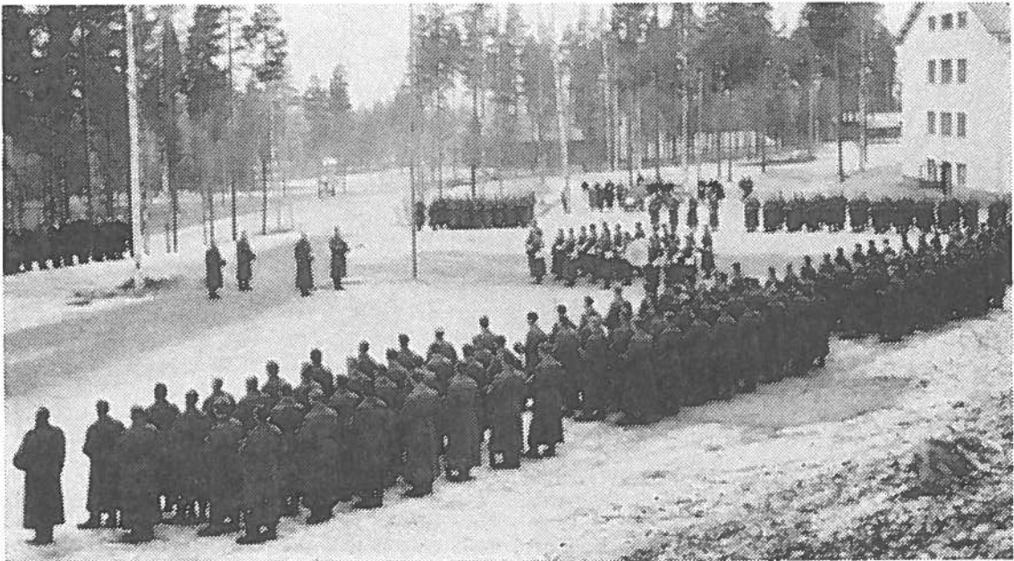
Karjalan Jääkäripataljoona järjestäytyneenä kenttäjumalanpalvelukseen ja katselmukseen kasarmiaukiolle.