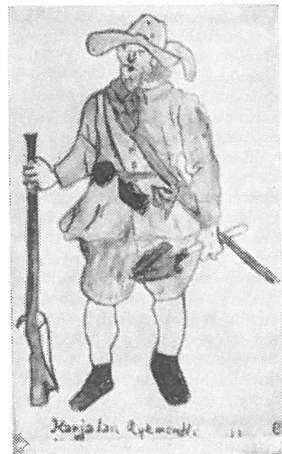
Karjalan Rykmentin sotilas ase- puvussaan.

Tämän jälkeen Suomen miehiä pidettiin edelleenkin Itämeren maakuntien varusväkenä, mikä rasitti kovasti muutenkin köyhää Suomen kansaa. Kotimaassa olevat sotaväen osastot sijoitettiin yleensä etelään rannikolle, mistä syystä sellaiset seudut kuin Pohjois-Karjala jäi täysin suojattomaksi, ilman säännöllisten sotajoukkojen suojaa. Tämä aiheutti suurta tyytymättömyyttä joukoissa, mitä taustaa vasten suuri palveluksesta kieltäytyminen oli ymmärrettävissä. Suomi kantoi 30-vuotisessa sodassa ja Itämeren maissa käydyissä sodissa sekä vartiopalveluksessa suhteellisesti suurimman rasituksen. Maan väkiluku oli noihin aikoihin suunnilleen 500.000 henkeä eli kolmannes valtakunnan Ruotsi-Suomi asukkaista. Suomi asetti sodan aikana keskimäärin 16.000 miestä.