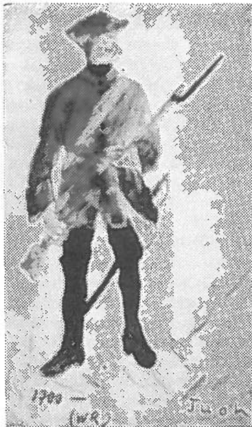
Viipurin Rykmentin sotilas 1700-luvulla.

surkeaan kuntoon. Perussyynä siihen oli miehistön aliravitsemustila, joka teki sen alttiiksi tarttuville taudeille.